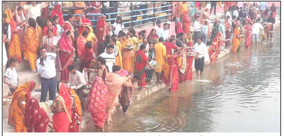
सोमवार वीरगंजको घडीअर्वा पोखरीमा उदाउँदो सूर्यलाई अर्घ्य दिएर चैती छठ समापन गर्दै भक्तजनहरू।

इरानी आक्रमणपछि संयुक्त राष्ट्रसङ्घीय सुरक्षा परिषद्को आइतवार आपत्कालीन बैठक बसेको छ। बैठकमा इजरायलले तेहरानविरुद्ध नयाँ प्रतिबन्ध लगाउनका लागि दबाब दिएको छ। महासचिव एन्टोनियो गुटेरेसले मध्यपूर्व क्षेत्र 'युद्ध'को सँघारमा रहेको चेतावनी दिएका छन्। रासस