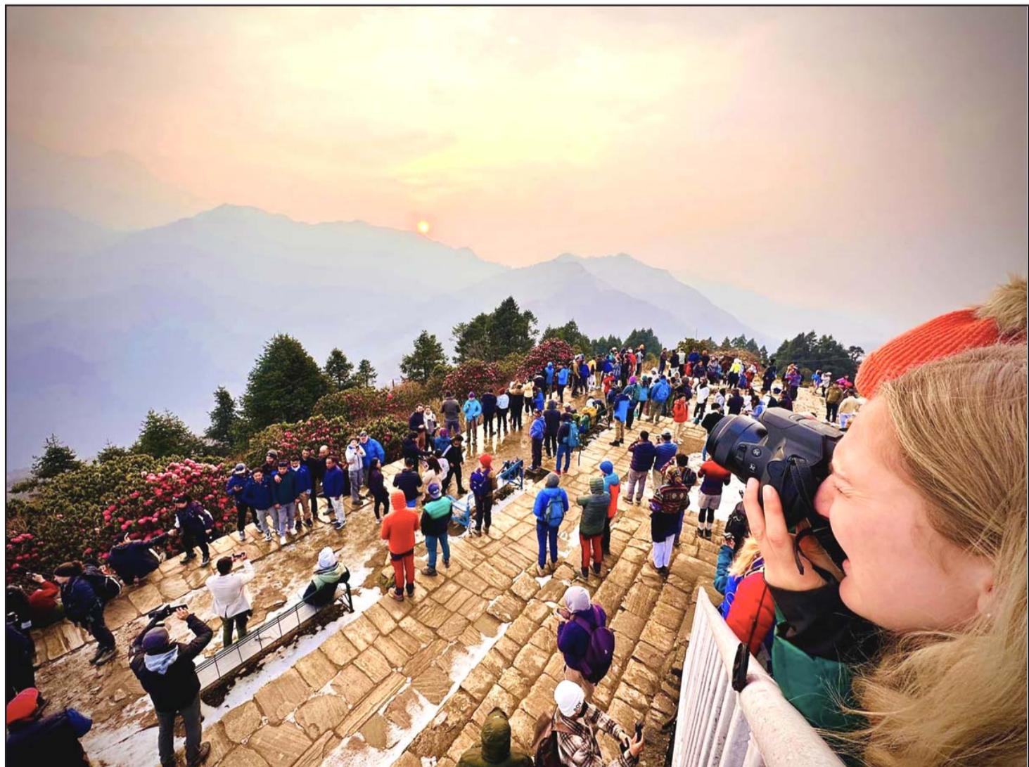
पुनहिलमा सूर्योदय अवलोकन गर्दै पर्यटक: म्याग्दीको अन्नपूर्ण गाउँपालिका-६ पुनहिलमा सोमवार बिहान सूर्योदय, गुराँसे जङ्गल र हिमशृङ्खला अवलोकन गर्दै पर्यटकहरू। समुद्री सतहभन्दा ३,२१० मिटर उचाइमा रहेको पुनहिल सूर्योदय, गुराँसेको जङ्गल र हिमशृङ्खलाको अवलोकनका लागि उत्कृष्ट गन्तव्य बनेको छ।

भएको छ। त्यस्तै, चाँदीको मूल्य प्रतिटोला रु १५ ले बढिँ भएको छ। आइतवार प्रतिटोला रु एक हजार सात सय कारोबार भएको चाँदीको मूल्य आज रु एक हजार सात सय १५ निर्धारण भएको छ।