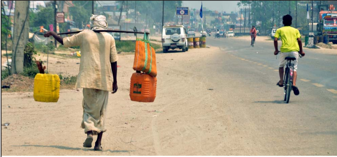
ताडीको स्वाद चाखौं है: बढ्दो गर्मीसँगै ताडीको बिक्री बढ्दो छ। ताजा ताडीको सीमित सेवनले पेटको गर्मी शान्त पार्छ भन्ने यसका पारखीहरूको भनाइ छ।