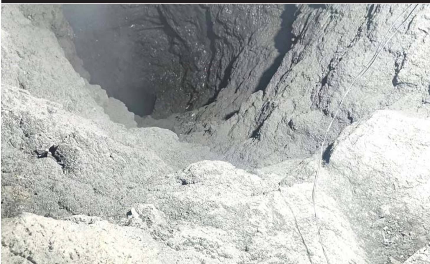
ठूलोखोला जलविद्युत् आयोजनाको सर्ज साफ्ट ब्रेक थ्रु म्याग्दीको रघुगङ्गा गाउँपालिका-८ मा निर्माणाधीन २१.३ मेगावाट क्षमताको ठूलोखोला जलविद्युत् आयोजनाको मुख्य सुरङसँग जोडिएको 'सर्ज साफ्ट'। संयुक्त ऊर्जा लिमिटेड प्रवर्द्धक रहेको ठूलोखोलाको सुरमा भन्ने ठाउँमा ४३.३६ मिटर गहिरो सुरङ बनाएर मुख्य सुरङसँग जोड्ने कार्य गराइति सम्पन्न भएको छ।