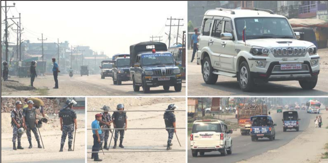
कुरा फेरियो शैली फेरिएन: गृहमन्त्री रवि लामिछानेको बिहीवार बिहान करीब ९ बजे पूर्व-पश्चिम महेन्द्र राजमार्ग निजगढ सडकखण्ड हुँदै गएको लावास्करसहितको सवारी। बिहान करीब ८ बजेदेखि बाराका धन्सार, भमरा, शहीदचोक, बुद्धचोक, बकैयापुल, तामागढी हुँदै तीन दर्जन स्थानमा जनपद, सशस्त्र र ट्राफिक प्रहरीहरू खटेका थिए।