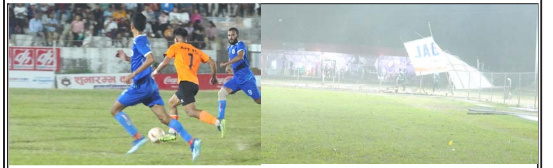
हावाहुरी आउनुअगावैको खेलको दृश्य। हावाहुरी आएपछि रङ्गशालाको अवस्था।