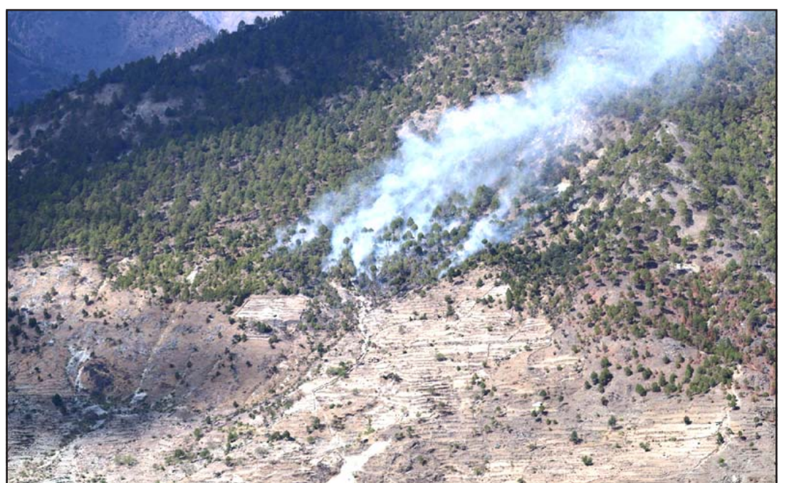
आइतबार मुगुको छायानाथ रारा नगरपालिका-१३ रुधागाउँको सिरानमा रहेको जङ्गलमा उडेको।

छ। घटनापछि स्थानीयले नाबालकको शव सडकमा राखेर जङ्गलसैया-धन्सार सडक खण्ड अवरुद्ध पारेका थिए। प्रहरीले ट्याक्टर र चालकलाई नियन्त्रणमा लिएको जनाएको छ।