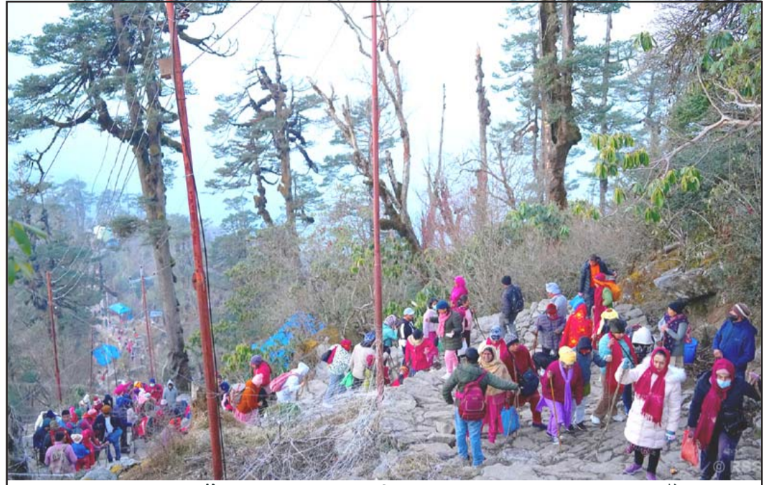
पाथीभरा देवीको दर्शन गर्न जाँदै भक्तजन: ताप्लेजुङको प्रसिद्ध तीर्थस्थल पाथीभरा देवीको दर्शन गर्न जाँदै तीर्थयात्री।