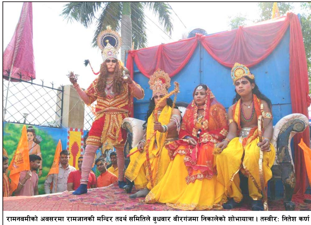
रामनवमीको अवसरमा रामजानकी मन्दिर तदर्थ समितिले बुधवार वीरगंजमा निकालेको शोभायात्रा।

महोत्सवमा प्रत्येक साँझ विभिन्न कलाकारको प्रस्तुतिसमेत रहने गरेको छ। महोत्सव आगामी वैशाख ९ गतेसम्म सञ्चालन हुनेछ।