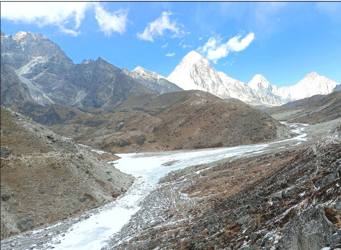
हिमनदी: सगरमाथा आधार शिविर जाने बाटो लोबुचे भएर बगेको हिमनदी। पृष्ठभूमिमा पुमोरी हिमाल, लिङ्क्रेन हिमाल र खुम्बुचे हिमाल।

वा गणतन्त्र, मन परेकालाई धोइपखाली गधाबाट गाई बनाइन्छ। अहिले गृहमन्त्री रविको मामिलामा यही फर्मुला लागू देखिन्छ। रविलाई दोषी साबित गरी कारबाई गनासाथ प्रचण्ड-ओली संयुक्त सरकार बालुवाको घरझै गज्यामगुलुम्म भुइँमा पछारिन्छ। त्यसैले रविलाई