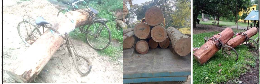
विभिन्न समयमा बरामद गरिएको सालको गोलिया ।

वन कार्यालय सोलखपुर, सबैया, बडनिहार, सखुनिया र छतवनटाँडी रेन्ज