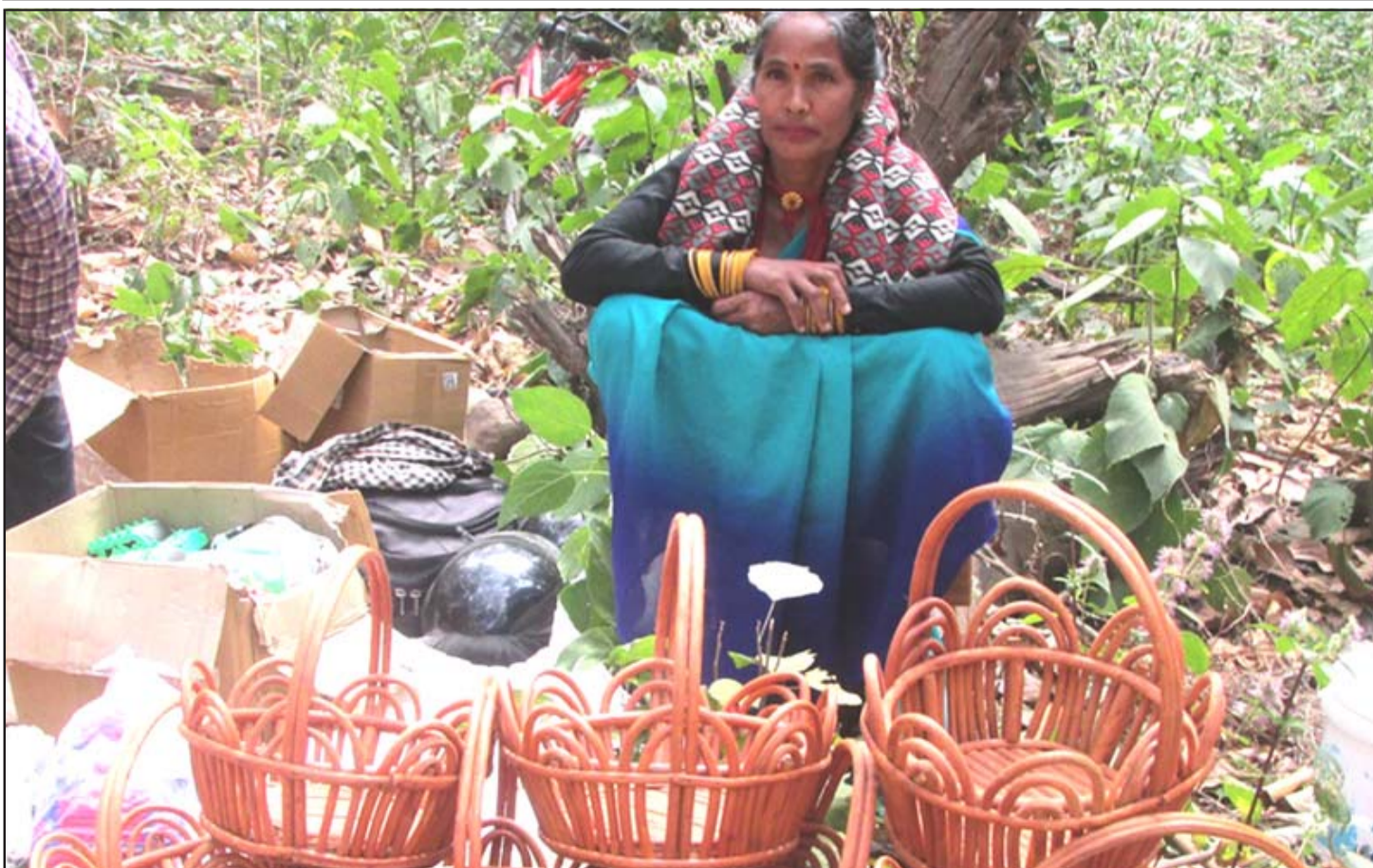
बेतको टोकरी बेच्दै: शुक्लाफाँटा नगरपालिका-७ का स्थानीय महिला सडकछेउमा बसेर बेतका टोकरी बेच्दै। टोकरी बुनेर महिलाले दैनिक रु एक हजार बढी अम्दानी गर्दै आएको छ।

भोगाइ एवं अनुभवको चरणमा रहेका प्रवासी नेपालीहरूलाई पनि स्वदेश फर्काउन सजिलो छैन। तर ज्यादै कठिन पनि छैन। विशेष किसिमका कार्यक्रमहरू जस्तै रोजगारको खास अवसर, व्यापार सञ्चालनमा सरलता, ऋण सुविधा आदि जस्ता आकर्षणहरू उपलब्ध गराएर यो चरणमा रहेका प्रवासी नेपालीहरूलाई