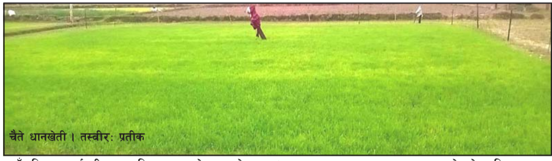
चैते धानखेती ।

मन (२०० देखि ३२० किलो) उत्पादन गरेका र यो देखेर पनि केही किसानहरू चैते धानखेतीतर्फ आकर्षित भएका किसान महराले बताए । उत्पादनका साथै चैते धानको भाउ पनि राम्रो पाएको उनले बताए । जीराभवानी गापा कृषि शाखा प्रमुख