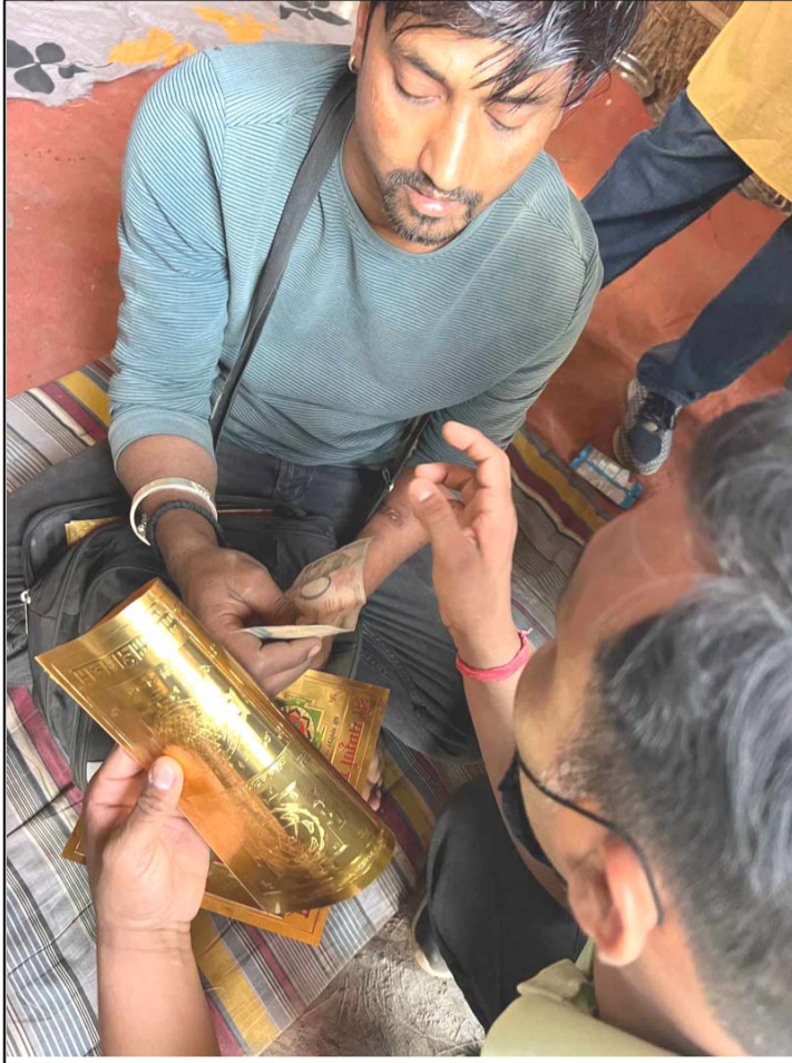
महालक्ष्मी महायन्त्रम् खरीद गर्दै ग्राहक।

बाहिरिएको छ। चैत १ गतेदेखि निशुल्क उपचार