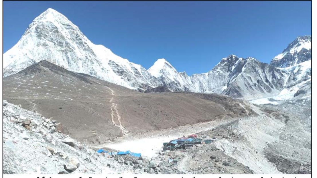
सगरमाथानजीकको मानवबस्ती: विश्वको सर्वोच्च शिखर सगरमाथाको सबैभन्दा नजीकको मानवबस्ती गोरक्षेप क्षेत्र र सगरमाथाको रमणीय दृश्य। पाँच हजार १६४ मिटरको उचाइमा रहेको गोरक्षेप सगरमाथा आधार शिविरनजीकै र कालापत्थरको काखमा रहेको छ।

नयाँ शहरीकरणको विकास प्रवृत्ति र रियल इस्टेट बजारमा आपूर्ति र मागमा आएको परिवर्तनलाई बुझेर चीनले घरजग्गाका लागि नयाँ विकास मोडेललाई बढावा दिने उनको भनाइ थियो। रासस