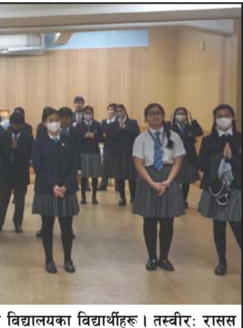
नेपाली पाठ्यक्रम अनुसार पढाइ भइरहेको जापानको टोकियोस्थित एभरेस्ट इन्टरनेशनल विद्यालयका विद्यार्थीहरू।

त्यसो त सन् १९०२ मै राणाकालीन समयमै आठजना नेपाली विद्यार्थीलाई उच्च शिक्षा हासिल गर्न भान्सेसहितको व्यवस्थामा जापान पठाइएको थियो। जापान नेपालको विकासको ठूलो सहयोगी