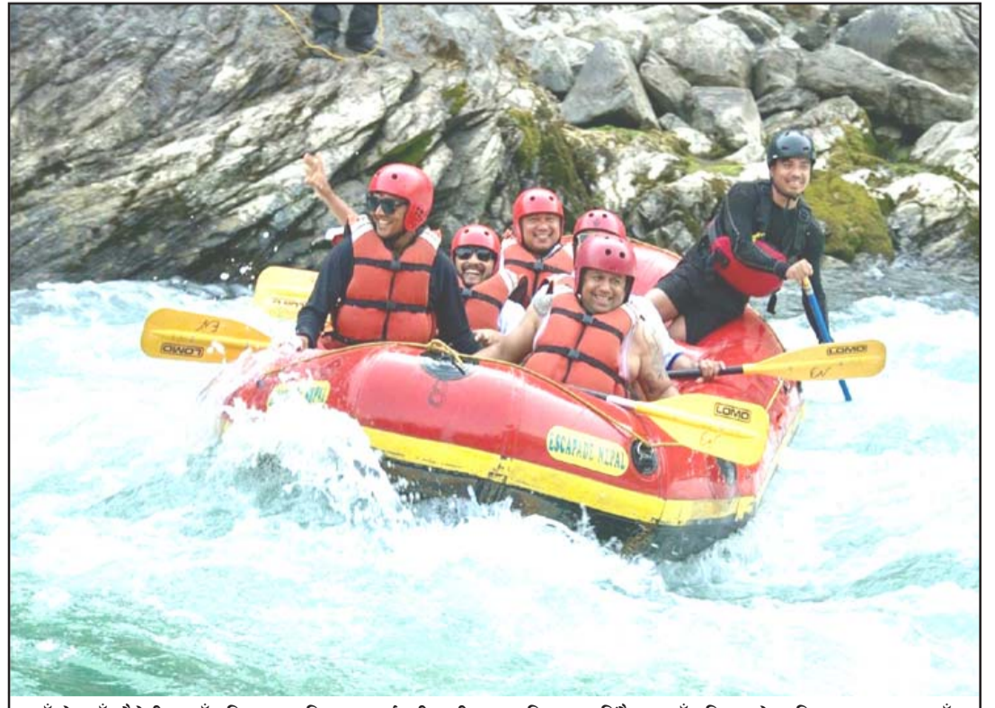
तनहुँको आँबुबैरेनी गाउँपालिका-४ स्थित मर्याङ्दी नदीमा ज्याफिटड गरिदै। गाउँपालिकाको सक्रियतामा यस ठाउँमा व्यावसायिकरूपमा ज्याफिटड सञ्चालनका लागि सम्भाव्यता अध्ययन गरिएको छ।