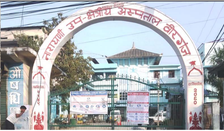
वीरगंजको साँघुरो मेनरोड र अत्यधिक बिरामीको सेवा गरिरहेको नारायणी अस्पतालको भवन।

प्रस, परवानीपुर, ५ चैत / निवेदन अनुसार गत वर्षको बोनस सूची श्रम तथा रोजगार कार्यालयका प्रमुख मात्र उपलब्ध गराइएको छ। मजदूर