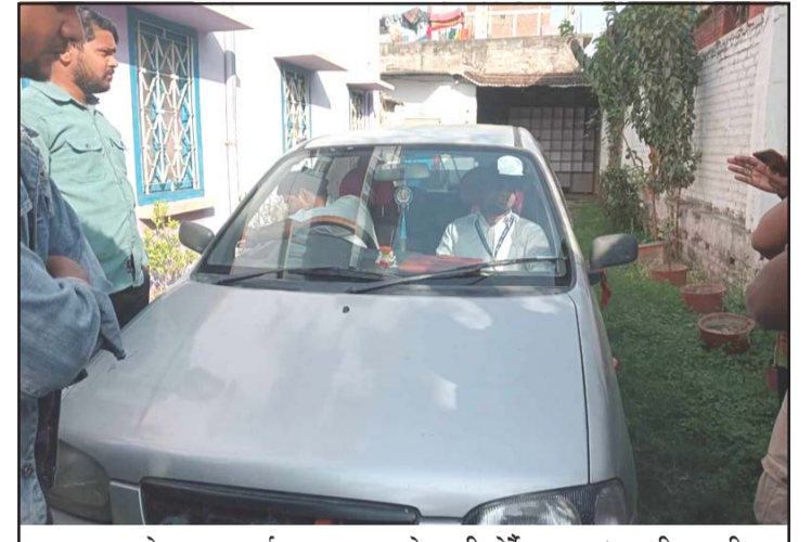
श्रम तथा रोजगार कार्यालयका प्रमुखको गाडी घेदै मजदूर।

प्रस, परवानीपुर, ५ चैत / निवेदन अनुसार गत वर्षको बोनस सूची श्रम तथा रोजगार कार्यालयका प्रमुख मात्र उपलब्ध गराइएको छ। मजदूर