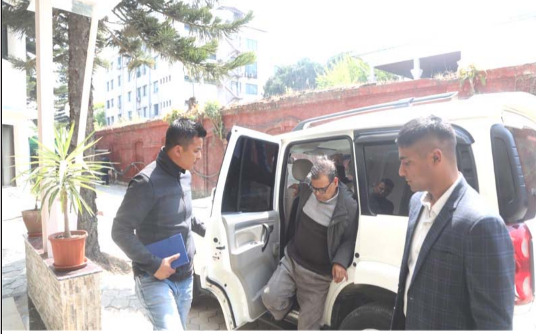
पक्राउ परेपछि पूर्वसभामुख महारालाई सिआइबी कार्यालय ल्याइँदै।

पूर्वसभामुख कृष्णबहादुर महारामाथि अनुसन्धान गर्न नेपाल प्रहरीको केन्द्रीय अनुसन्धान ब्यूरो (सिआइबी)ले चार दिनको म्याद पाएको छ। काठमाडौं जिल्ला अदालतले सुन प्रकरणको अनुसन्धान गरिरहेको सिआइबीलाई सोमवार नेता महारामाथि अनुसन्धान गर्न चार दिनको म्याद दिएको हो। म्याद थपका लागि उनलाई आजै जिल्ला अदालतमा पेश गरिएको थियो।