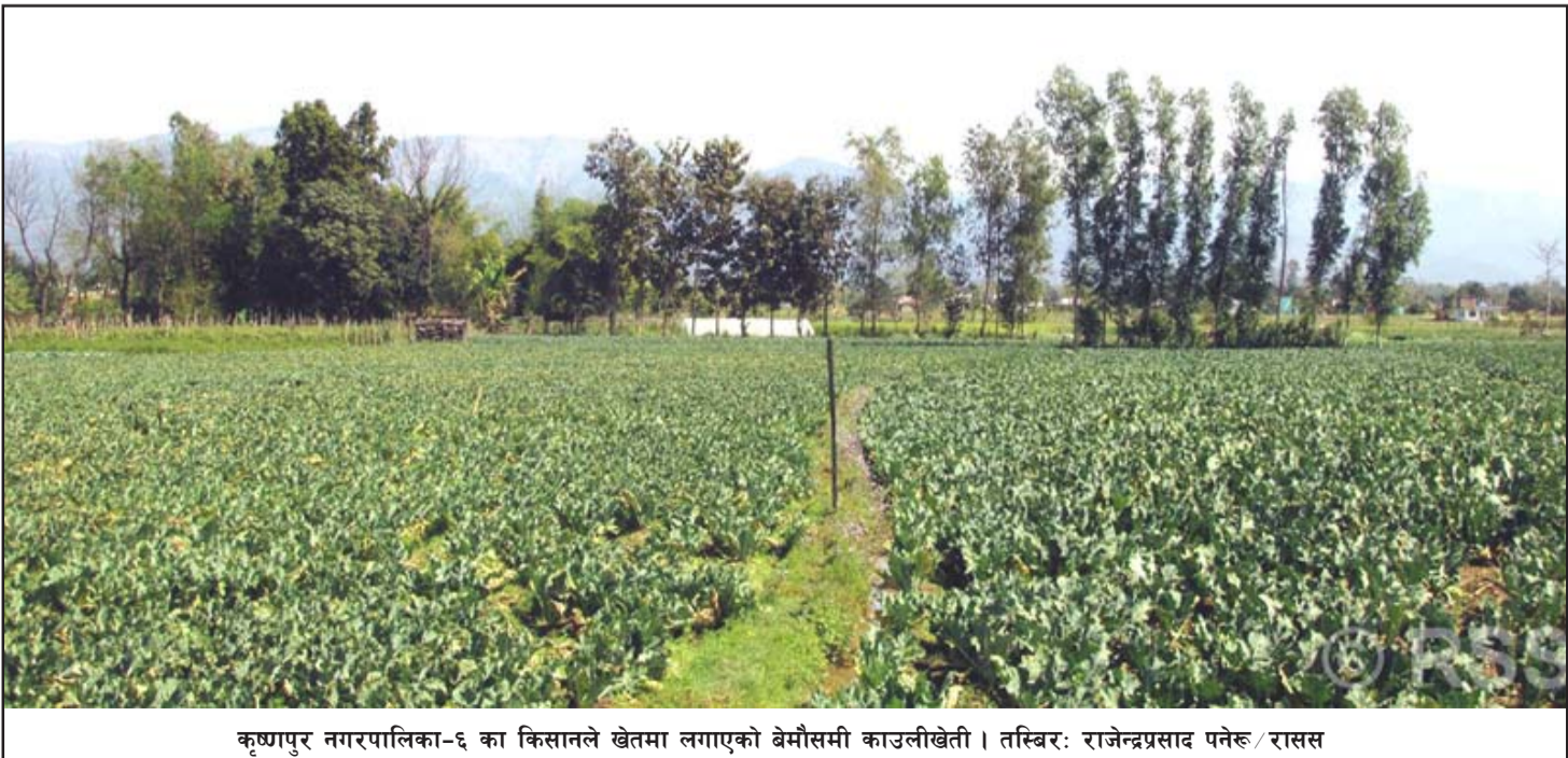
कृष्णपुर नगरपालिका-६ का किसानले खेतमा लगाएको बेमौसमी काउलीखेती।

कारोबार रकमका आधारमा गुर्खाज फाइनेन्स लिमिटेडको रू २३ करोड १४ लाख ५८ हजार ७७ बराबरको कारोबार भएको छ। कारोबार भएका शेयर सङ्ख्याका आधारमा भने अपर तामाकोशी हाइड्रोपावर लिमिटेडको छ लाख ४२ हजार ५९९ कित्ता शेयर किनबेच भएका छन्।