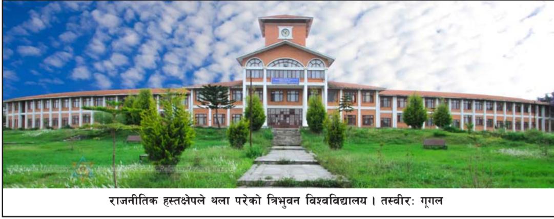
राजनीतिक हस्तक्षेपले थला परेको त्रिभुवन विश्वविद्यालय।