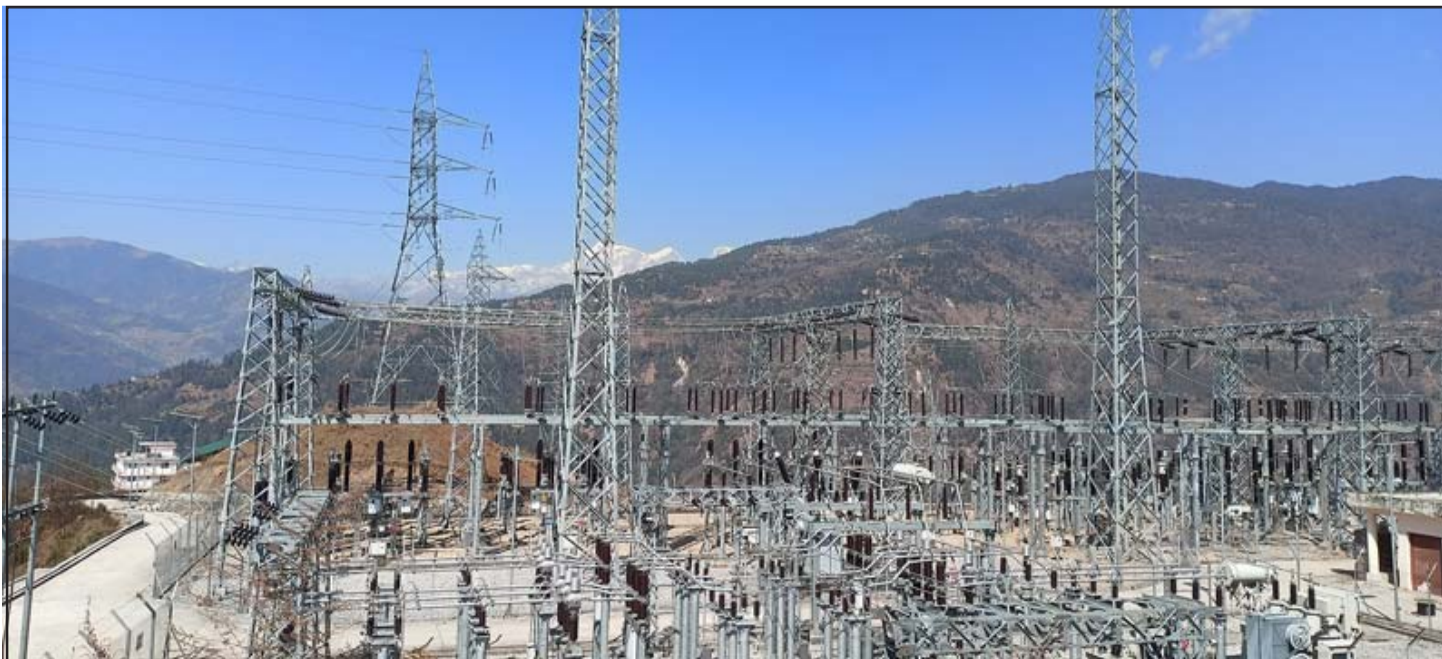
सोलु करिडोर: सोलुखुम्बुको तिङ्लास्थित सोलु करिडोर १३२ केभी प्रसारण लाइन। यस करिडोरबाट जिल्लामा उत्पादित करीब ४० मेगावाट विद्युत् राष्ट्रिय प्रसारण लाइनमा जोडिएको छ।