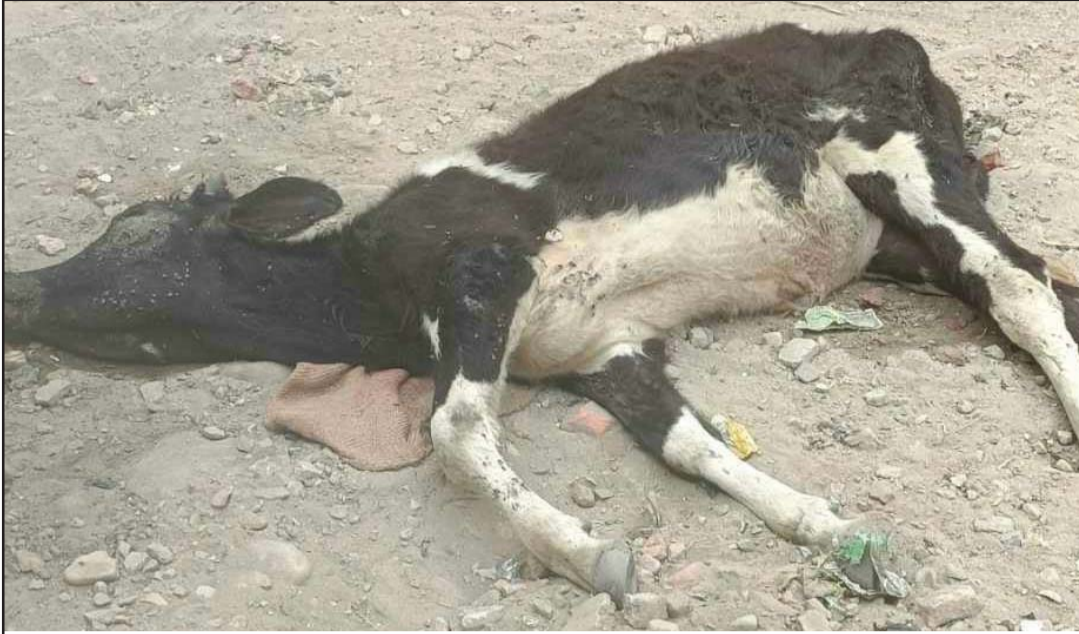
वीरगंजको श्रीपुरस्थित गुलाइचीमाई मन्दिरनजीकै दुई दिनअघि एउटा गाई मरेको अवस्थामा अलपत्र छ। स्थानीयले वीरगंज महानगरपालिकामा जानकारी गराउँदा पनि मरेको गाईको व्यवस्थापन गर्न कुनै चासो देखाइएको छैन।