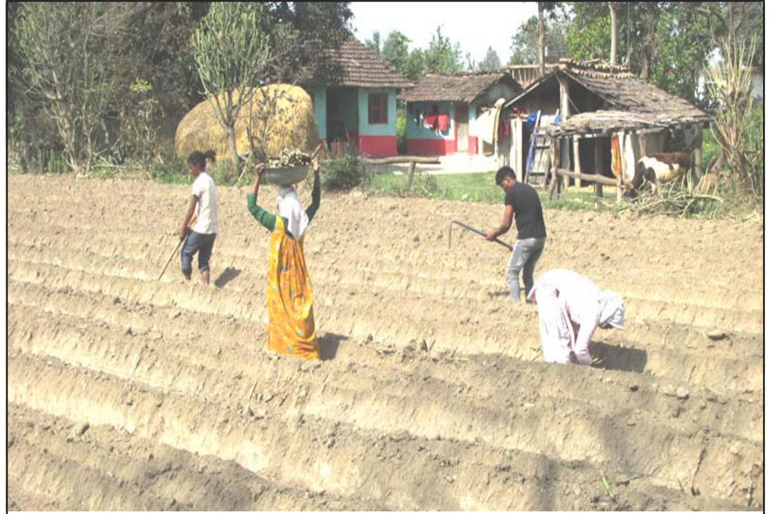
ट्रेन्क प्रविधिबाट खेतमा उखु रोप्दै किसान: कञ्चनपुरको शुक्लाफाँटा नगरपालिका-३ पिपलाडीका किसान ट्रेन्क प्रविधिबाट खेतमा उखु रोप्दै। आधुनिक तरिकाले उखुखेती गरी किसानले मनग्य आमदानी गरेका छन्।

नेतान्याहुले गाजामा अहिले पनि बन्धकहरूको भाग्य र सरकारविरोधी आन्दोलनबाट बढ्दो सार्वजनिक दबाबको सामना गर्नुपरिरहेको छ। युद्धका कारण इजरायलमा दुईपटक ढिलो भइसकेको नगरपालिका निर्वाचन मङ्गलवार हुँदैछ। निर्वाचनले हमासविरोध इजराइलको झन्डै पाँच महीनाको युद्धमा जनताको मनस्थिति अनुमान लगाउन सकिन्छ। रासस