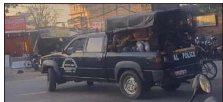
जुवाडेहरूलाई लार्दै वडा प्रहरी कार्यालयको भ्यान।

सो होटलमा जुवा, तास हुने गरेको र यसबारेमा वडा प्रहरी कार्यालय श्रीपुर, जिल्ला प्रहरी कार्यालय पर्सामा जानकारी गराए पनि सुनवाड नभएको स्थानीयको गुनासो छ। प्रहरी उपरीक्षक परिवर्तन भएपछि काम देखाउनका लागि शुक्रवार जुवाडेहरूलाई पक्राउ गरिएको स्रोतले