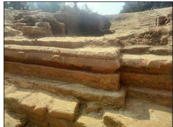
पतौरामा भेटिएको संरचनाको उत्खनन हुँदै।