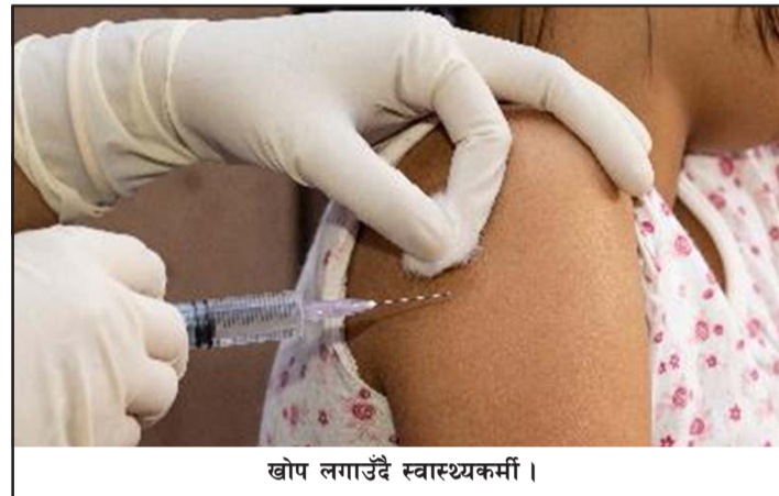
खोप लगाउँदै स्वास्थ्यकर्मी।