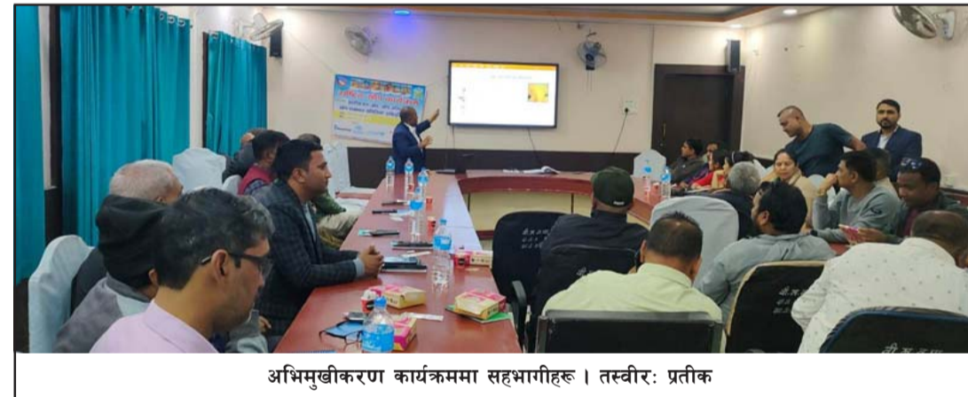
अभिमुखीकरण कार्यक्रममा सहभागीहरू।

महावीर प्रसाद बृजलाल केडिया सेवा ट्रस्ट वीरगंज, पर्स, नेपाल