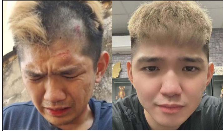
पक्राउ परेका दुईजना ताइवानी नागरिक।

यातनासहित हिरासतमा राख्ने, बलात्कार गर्ने र मानव अङ्ग बेचबिखनसम्बन्धी