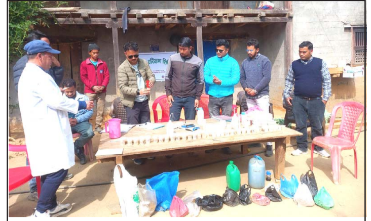
बाली उपचार तथा माटो परीक्षण हुँदै: जिल्ला कृषि विकास कार्यालयको आयोजनाका साथै एकीकृत कृषि प्रयोगशाला, वीरेन्द्रनगर, सुर्खेतको प्राविधिक सहयोगमा भेरी नगरपालिका-५ मा बाली उपचार तथा माटो परीक्षण हुँदै । परीक्षणपछि आउने जानकारीका आधारमा कार्यालयले माटो सुधारका कार्यक्रम सञ्चालन गर्ने कृषकसामु प्रतिबद्धता व्यक्त गर्दै ।

साना र मझौला स्वरोजगारमूलक उद्योगधन्दा ठूलो सङ्ख्यामा बन्द भएका छन् । पूँजीगत खर्चको अवस्था र क्षमता आर्थिक वृद्धि र रोजगार सिर्जनासँग जोडिएर आउँछ । यसरी अहिले अर्थतन्त्रमा देखिएको मन्दी, दबाव वा आसन्न सङ्कटको मूल कारण आर्थिक स्रोतको अभाव मात्र होइन, अर्थतन्त्र व्यवस्थापनमा सरकारले प्रदर्शन गर्न नसकेको शासकीय र नियामकीय निकायहरूबीचको समन्वयको चरम अभाव एवं समस्या समाधानमा सिर्जनशील दृष्टिकोणको अभाव नै हो । नेपाल राष्ट्र बैंकले परिस्थितिबश समस्यामा परेका ऋणीहरूको हकमा, कृषि तथा वन, माछापालन, खानी, कृषि, वन र पेय पदार्थ उत्पादन उद्योग, गैरखाद्य वस्तु उत्पादन, धातु, मेशिनरी तथा विद्युतीय औजार तथा जडान, यातायात, भण्डार र सञ्चार, थोक तथा खुद्रा बिक्री, पर्यटन, शिक्षा एवं स्वास्थ्य, निर्माण क्षेत्रसँग सम्बन्धित कर्जाको पुनर्संरचना र पुनर्तालिनीकरण गर्न बैंकहरूलाई छुट दिएको थियो । कर्जा अपचलन गर्ने, समयमै ऋण नतिर्ने वा अन्य वित्तीय अपराध गरेको सूची तयार गरेर कर्जाको जोखिम व्यवस्थापन गर्नेलागत काम गर्नेगरी २०४६ जेठ १ गतेदेखि कर्जा सूचना केन्द्र सञ्चालनमा ल्याइएको हो । नेपाल राष्ट्र बैंकले विभिन्न अवस्थामा कुनै व्यक्ति वा संस्थालाई कालोसूचीमा राख्न सक्ने व्यवस्था छ । त्यसैले अब जलवायु परिवर्तन, उपभोक्ताको बदलिँदो हचि, बढ्दो डिजिटल कारोबार आदिले नाटकीय गतिमा रूपान्तरण गरिरहेको अर्थतन्त्रको स्वरूप र आर्थिक अन्तर्क्रियाको परिवेश अनुसार राजस्व प्रशासन र सिङ्गो विकासको मोडललाई कसरी समयसापेक्ष एवं मुलुक-सान्दर्भिक बनाउन सकिन्छ, सरकारले यस दिशामा काम थाल्नुपर्ने देखिन्छ ।