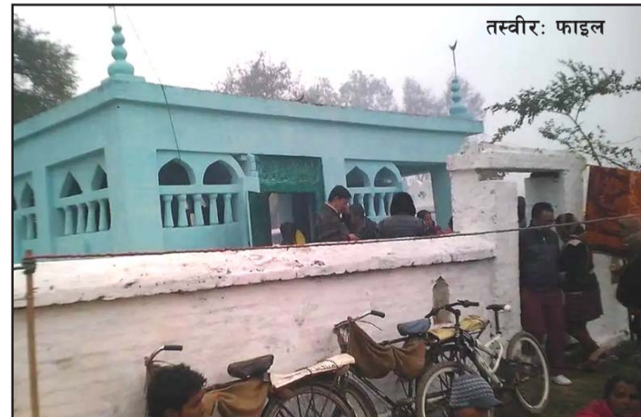
हुने भन्दै भक्तजन आउने गरेका छन् । हिन्दू र मुस्लिम समुदायले एकसाथ

रूपमा रहेको बताए । यहाँ भारतका विभिन्न स्थानबाट समेत मनोकामना पूरा