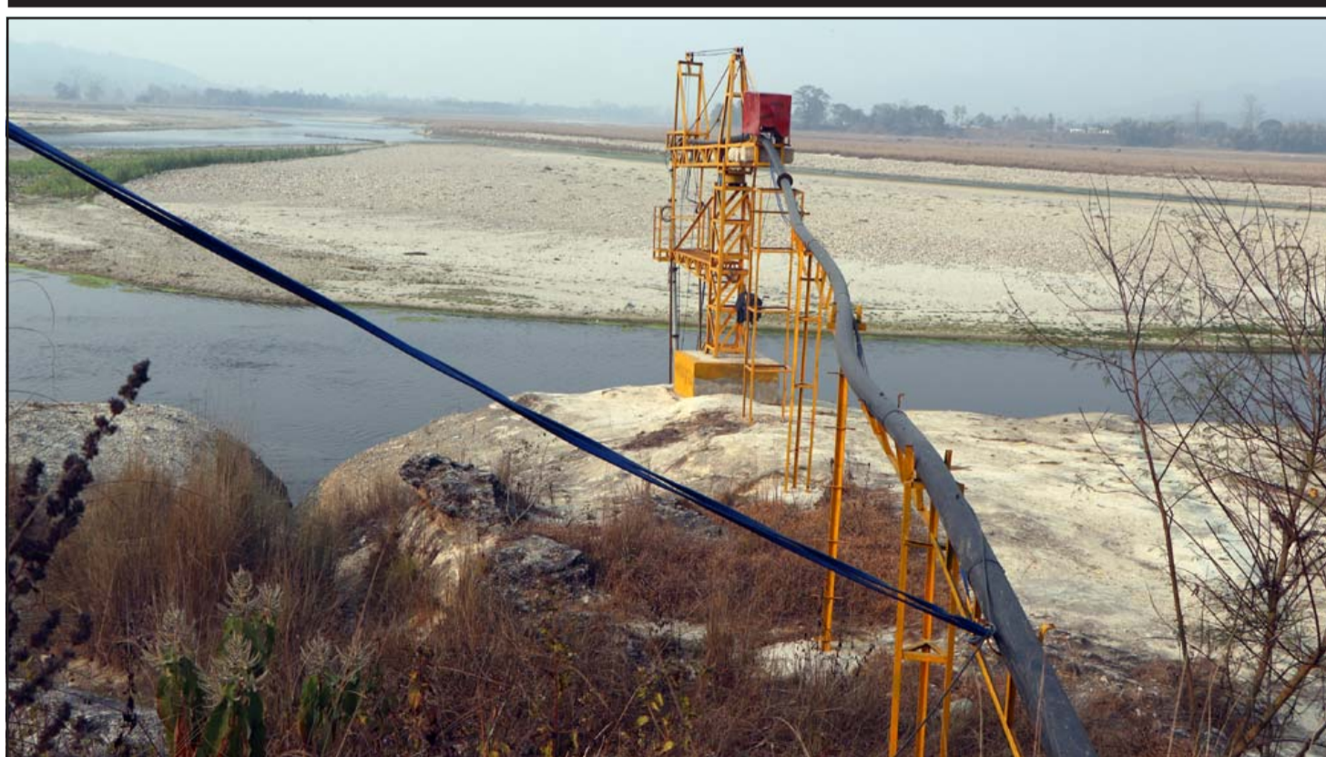
क्रेन लिफ्ट सिंचाइ आयोजना: चितवन भूमिगत संयोजनात्मक जल सिंचाइ आयोजनाले मकवानपुरको बागमती गाउँपालिका वडा नं २ राईगाउँस्थित बागमती नदीमा निर्माण गरेको क्रेन लिफ्ट सिंचाइ आयोजना । आयोजनाबाट यस क्षेत्रको सुख्खा जमीन सिञ्चित भएपछि स्थानीयवासी खुशी छन् ।