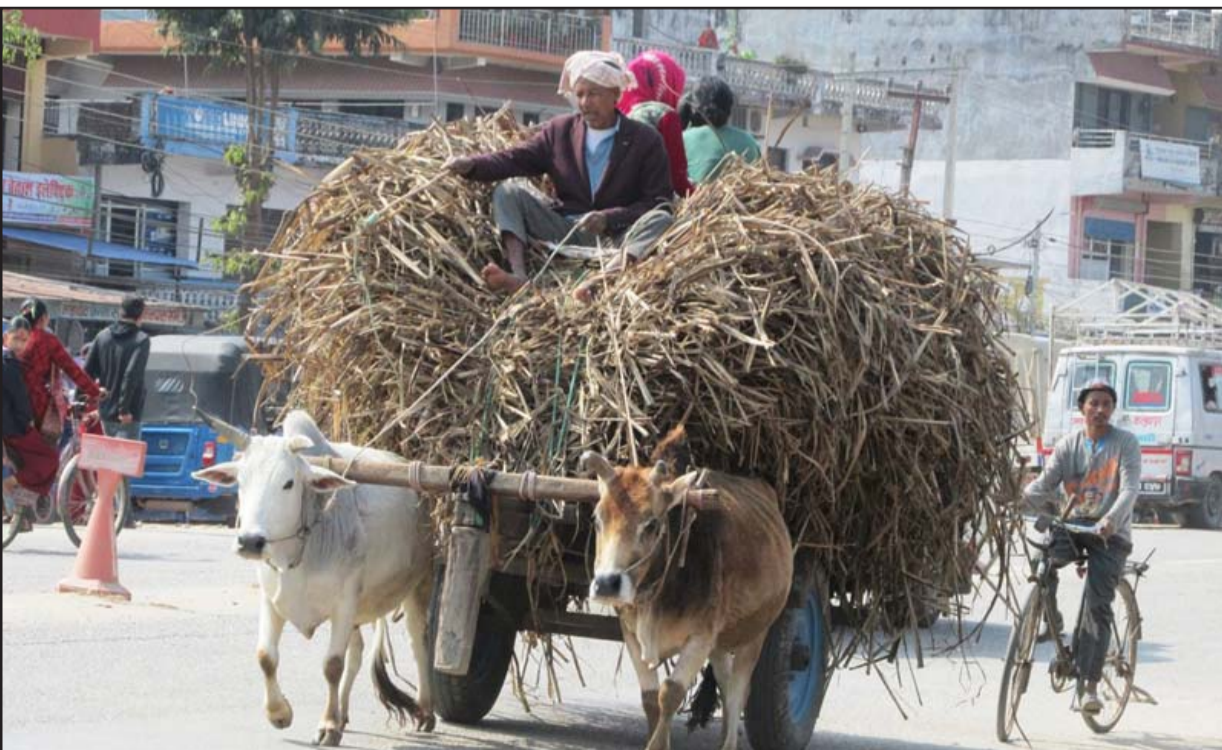
बैलगाडामा उखुका सुकेका पात बोकेर लैजाँदै: कञ्चनपुरको झलारी बजार भएर बैलगाडामा उखुका सुकेका पात बोकेर लैजाँदै गरेका किसान। उखुलगायत सुकेका पातहरू कुहाएर किसानले जैविक मल बनाइ खेतमा हाल्ने गरेका छन्।

माथिको प्रसङ्गलाई फेरि दोहोर्‍याउँ। मानव तस्करलाई नेपालमा एक करोड रुपियाँ भुक्तान गरेर अमेरिका आउन तयार रहेको एक युवक वा युवतीले नेपालमा नै कुनै सानो आकारको व्यापार गरे हुँदैन ? एक करोड रुपियाँ, जुन उक्त व्यक्तिसँग छ, के उसले त्यसलाई पूँजीको रूपमा उपयोग गर्न सक्तैन ? यस प्रश्नको उत्तर सजिलो छ। हामी