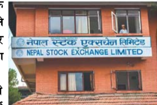
हिमालयन उर्जा विकास कम्पनी र आठ करोड ५७ लाख ५१ हजार ९४५ बराबरको कारोबार भई शीर्ष पाँचमध्ये पनौ सफल भएका छन्।