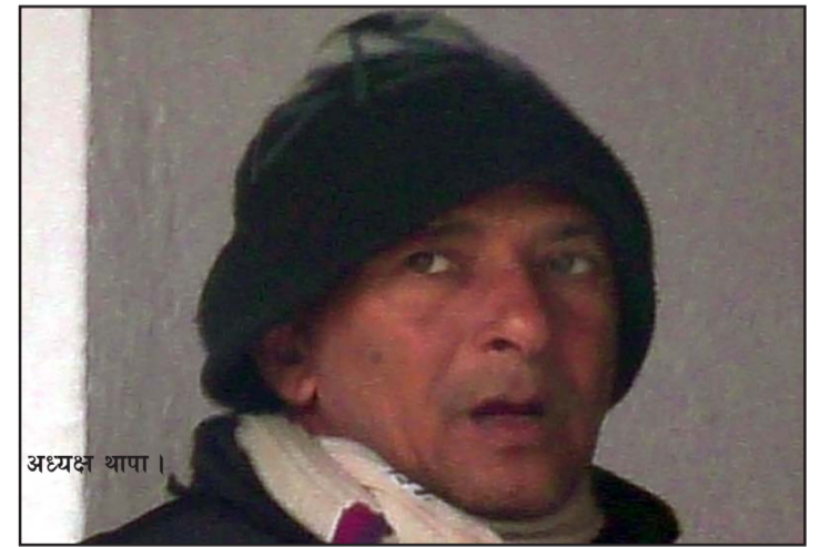
अध्यक्ष थापा ।

सो सामुदायिक वन उपभोक्ता समूहको २० हेक्टरभन्दा बढी वन क्षेत्रलाई आबाद गर्दै आएको उजुरी अख्तियार दुरुपयोग अनुसन्धान आयोग र राष्ट्रिय सतर्कता केन्द्रमा परेको थियो । तत्कालीन माओवादी सशस्त्र द्वन्द्वताका फौडानी गरिएको सो वन क्षेत्रमा स्थानीयले मानवबस्ती बसाउन रोक लगाए पनि हाल ११ घर रहेको वन कार्यालयले जनाएको छ । अतिक्रमण गरिएको वन क्षेत्रमा सामुदायिक विद्यालय, मठमन्दिर, गुम्बा, सङ्घसंस्था सञ्चालनका लागि जमीन भागबन्डा गरी सो वन क्षेत्रको जमीनमा खेतीपाती गर्न ठेक्कासमेत लाग्दै आएको स्थानीयले बताएका छन् ।