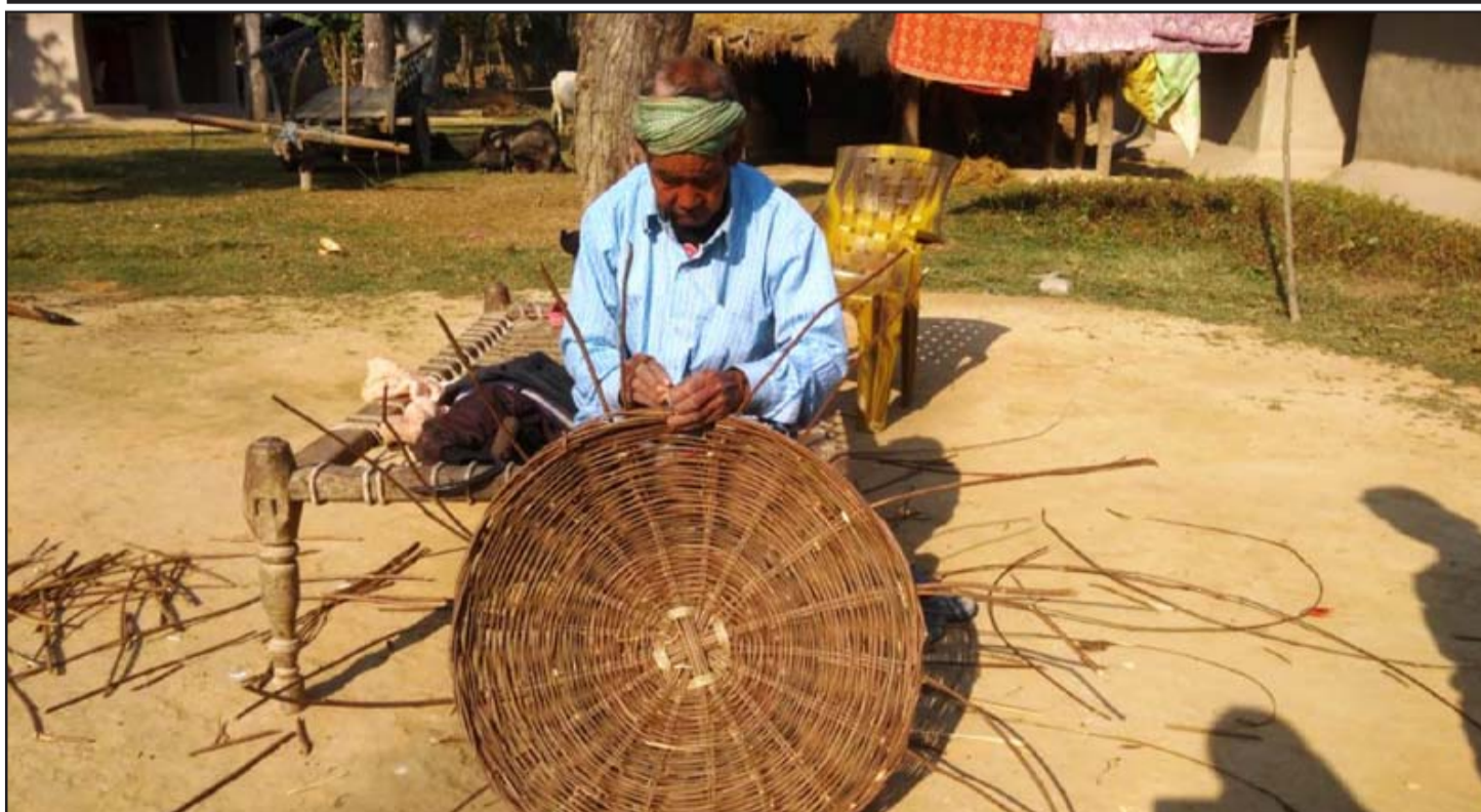
लालझाडी गाउँपालिकाको डाँडाजाईका राना थारू समुदायका व्यक्ति बेतको टोकरी बुन्दै। बेतबाँसबाट निर्मित सामग्री थारू समुदायका कृषि र घरायसी प्रयोजनका लागि प्रयोग हुने गरेका छन्।

मुलुकभित्र उद्यमशीलताको विकास गरी विभिन्न उद्योग व्यवसायहरूको स्थापना एवं सञ्चालन विनाउत्पादन बढाउन सकिदैन। उत्पादन नबढाई आम्दानी हुने कुरै भएन। आम्दानी नबढाई देशमा समृद्धि सम्भव छैन। यसरी औद्योगिक क्षेत्रको विकास तथा उत्पादनमा वृद्धि नगरी आर्थिक समृद्धि सम्भव देखिदैन। त्यसैले आयातमुखी अर्थतन्त्रलाई उत्पादनमुखी बनाउन एवं आयात विस्थापन र रोजगार सृजना गर्ने खालका परियोजनामा लगानी बढाउनुपर्ने सरकार को रणनीति हुनुपर्छ।