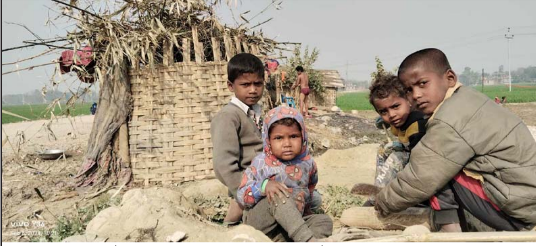
बारा जिल्लाको फेटा गाउँपालिका वडा नं १ मा संविधानमा उल्लिखित मौलिक अधिकार विद्यालय जानबाट वञ्चित डोम समुदायका बालबालिकाहरू।