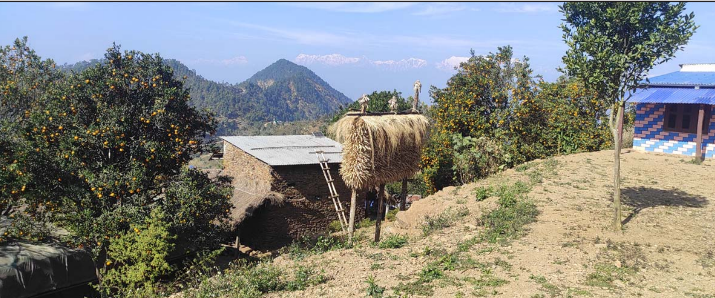
मकैको बीउका लागि परम्परागत शैलीमा राखेको मकैको सुली: तनहुँको देवघाट गाउँपालिका-३ छिपछिपेमा किसानले मकैको बीउका लागि परम्परागत शैलीमा राखेको मकैको सुली।