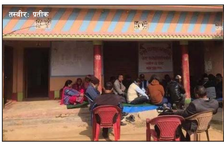
पटकपटक नगरसभा आह्वान भए पनि बैठकमा बहुमत नहुदाँ नगरसभा हुन