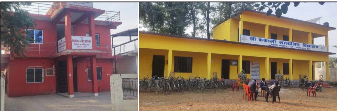
बन्द नगर अस्पताल खुले पनि सुनसान र सामुदायिक विद्यालय खुलेपछिको चहलपहल ।