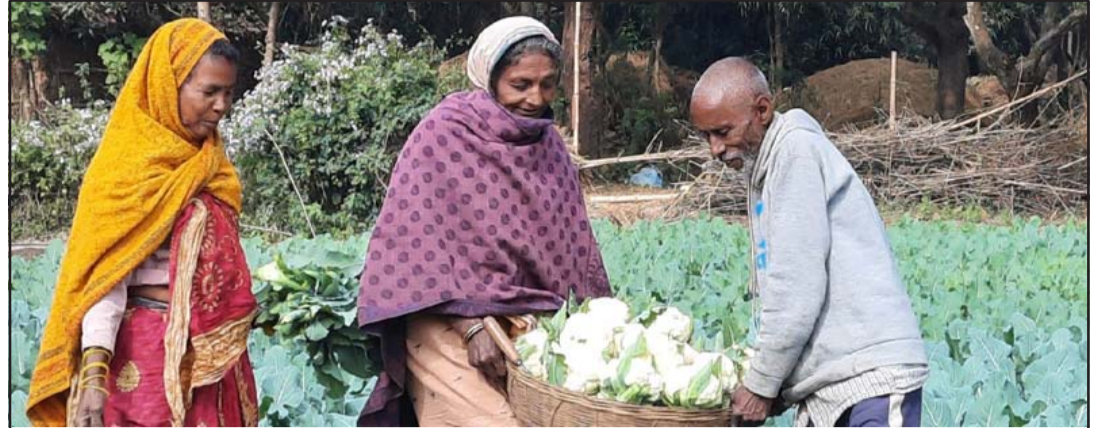
काउलीखेती: सप्तरीको राजविराजस्थित पडरियामा माँ भगवती कृषक समूहले लगाएका काउली बिक्रीका लागि बजार लैजाँदै।

बुधवार तीनवटा धावनमार्ग खुला गरिए पनि दिनभरि करीब १०० वटा उडान बन्द हुने अनुमान गरिएको छ, जसका कारण १९ हजार यात्रुको यात्रा