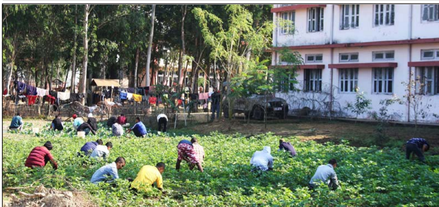
आलु गोडमेल गर्दै बाल बन्दी: बाँकेको डुडुवा गाउँपालिका-६ असमानपुरस्थित जयन्तु बाल सुधार गृहमा रहेका बाल बन्दीहरूले सुधार गृहभित्र रहेको घाँसे जमीन र खाली जमीनलाई हातले नै खनेर लगाएको आलु गोडमेल गर्दै।

त्यस्तै लगानीको विविधीकरण नभएको, जोखिम व्यवस्था नगरिएको, अनुत्पादक क्षेत्रको लगानी र पर्याप्त तरलता समेत नराखिएका कारण पनि सहकारी क्षेत्रमा समस्या आएको देखिन्छ। स्वेच्छिक तथा खुला सदस्यता, सदस्यद्वारा लोकतान्त्रिक नियन्त्रण, आर्थिक सहभागिता, स्वायत्तता र स्वतन्त्रता, शिक्षा, तालीम र सूचना, सहकारीबीच पारस्परिक सहयोग तथा समुदाय र वातावरणप्रति सहकारीका आधारभूत सिद्धान्त हुन्। सहकारीको जन्म गरीबी, असमानता र भेदभावविरुद्ध भएको हो। नेपालमा पछिल्लो समयमा सहकारीको सङ्ख्यात्मक वृद्धि तीव्र गतिमा भएको पाइन्छ। नेपालमा सहकारीको ठूलो सञ्जाल छ। मुलुकभर ३० हजारभन्दा बढी सहकारी संस्था छन् र तिनमा ७० लाखभन्दा बढी सदस्य छन्। सबै सहकारी संस्था समस्याग्रस्त छैनन्, कानून पालना गर्दै स्वनियमनमा चलेका सहकारी संस्थाहरूले राम्रा-राम्रा काम गरिरहेका पनि छन्। उद्यम गर्न चाहनेहरूलाई कर्जा प्रवाह गरेका छन्, सदस्यहरूले भविष्य सुरक्षाका लागि बचत गर्दै लाभ लिइरहेका छन्। सहकारी संस्था आफैँले उद्योग-व्यवसाय चलाएर रोजगार पनि दिइरहेका छन्। नियमनकारी निकायहरू सुस्ताउँदा यस्ता सहकारी संस्थाहरूसमेत बेथितिबाट सङ्क्रमित हुने जोखिम छ। सरकारी संस्थाको कार्यक्षेत्र अनुसार नियमन गर्ने दायित्व सङ्घ, प्रदेश र स्थानीय सरकारलाई हुन्छ। तर सहकारी संस्थाको बेथिति नियन्त्रणका लागि तिनै तहका सरकार उदासीन देखिन्छन्। यसले लाखौँ बचतकर्ताको अबै रकम जुनसुकै बेला जोखिममा पर्ने डर छ। हरेक सहकारी संस्थामाथि सम्बन्धित निकायले कडाइका साथ नियमन गर्न ढिला भइरहेको छ।