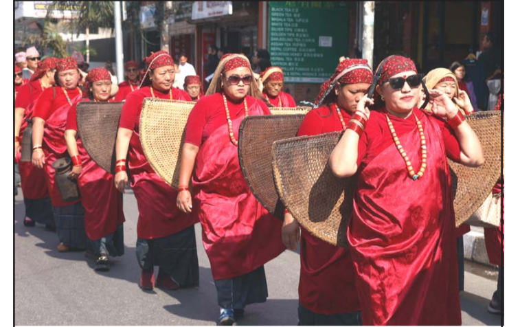
रेस्टुराँ एण्ड वार एसोसिएसन (रेवान) पोखराद्वारा अङ्ग्रेजी नयाँ वर्ष २०२४ का अवसरमा आयोजित २५औँ पोखरा सडक महोत्सवमा घुम प्रदर्शन गर्दै महोत्सवका सहभागी गुरुङ समुदायका महिलाहरू।

सङ्घद्वारा आयोजित उक्त महोत्सव १९औँ संस्करणसम्म आइपुगेको हो। सातौँ बागलुङ महोत्सव बुधवारदेखि शुरू भएको छ। बागलुङ उद्योग वाणिज्य सङ्घले चार वर्षपछि सो महोत्सव आयोजना गरेको हो।