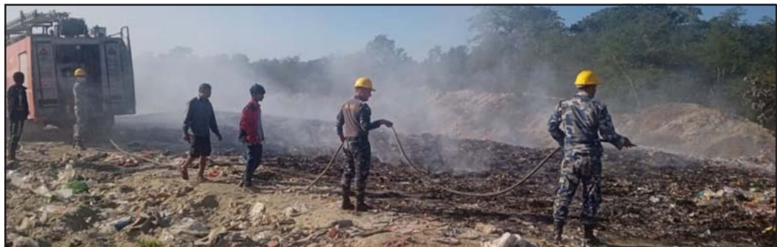
डम्पिङ साइटमा लागेको निभाउँदै सशस्त्र प्रहरी।

मिलेमतोमा आगो लगाउने गरिएको स्थानीयहरूले आशङ्का व्यक्त गरेका छन्। सो धुवाँले मानव स्वास्थ्यमा नराम्ररी प्रभाव पार्ने स्वास्थ्यकर्मीहरू बताउँछन्। रुघा, खोकी, दम, सास फेर्न गाह्रो हुने, क्यान्सरसम्मको रोग लाग्न सक्ने