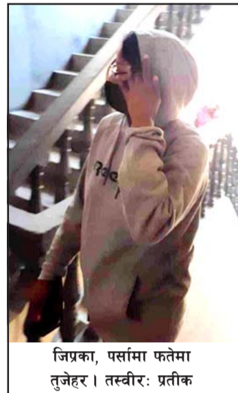
जिप्रका, पर्सामा फतेमा तुजेहर।

प्रस, वीरगंज, ६ मङ्सिर/ बङ्गलादेशमा चिकित्साशास्त्र अध्ययन गरिरहेका एकजना नेपाली पुरुषसँग छ