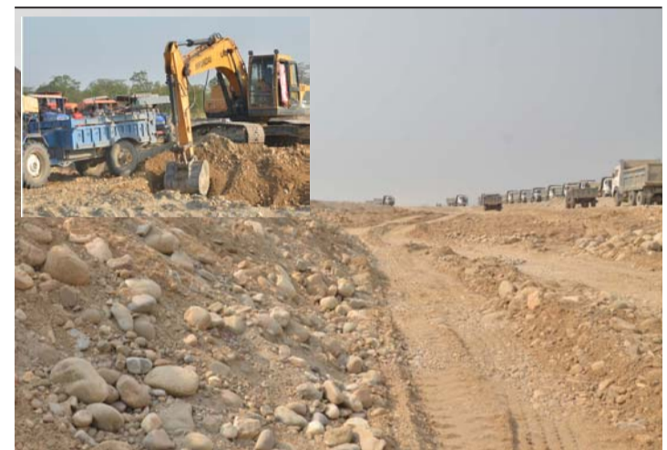
अघिल्लो वर्ष मापदण्डविपरित कोल्हवी नपास्थित बकैया खोला खन्दै ठेकेदार कम्पनी।

ठेक्का लगाउने बाटो यी दुई स्थानीय तहलाई अझै खुलेको छैन। जसले गर्दा बर्सेनि करोडौं राजस्व गुम्ने सम्भावना छ भने, अर्कोतिर दिनदहाडै नदी खोलाबाट चोरी गरिएको नदीजन्य पदार्थ क्रसर उद्योगहरूमा निर्बाध भित्रिरेको छ।