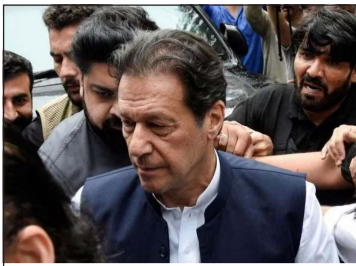
पाकिस्तानका पूर्वप्रधानमन्त्री इमरान खान ।

आरोपका लागि मुद्दा कारागारभित्र भएको थियो र ट्रायल गोप्यरूपमा भएको थियो ।