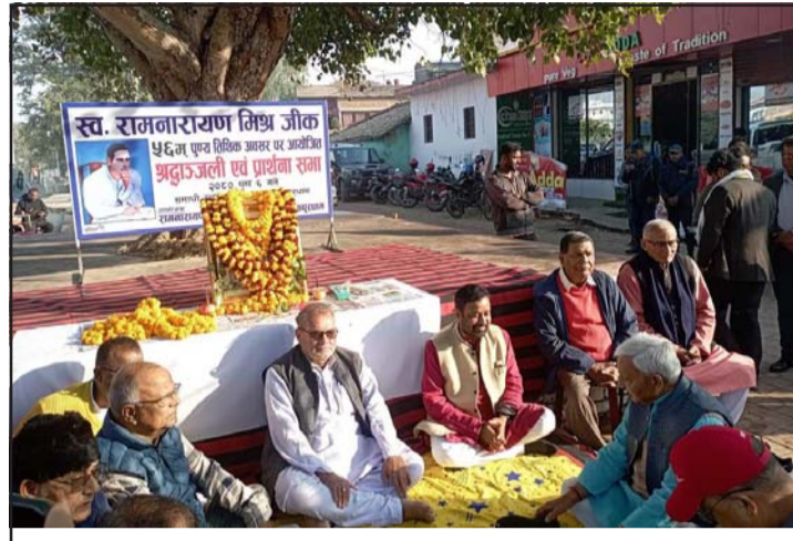
स्व रामनारायण मिश्रको ५६औं पुण्यतिथिको अवसरमा शुक्रवार जनकपुरधाममा आयोजित श्रद्धाञ्जलि एवं प्रार्थनासभा ।