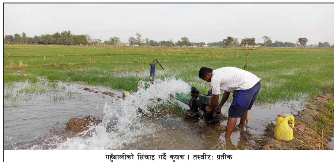
गहुँबालीको सिंचाइ गर्दै कृषक।

त्यसपछि मल नआएको बताए। उनले मल आएको खण्डमा वितरण गरिने बताए। कृषि सामग्री कम्पनीले हालै