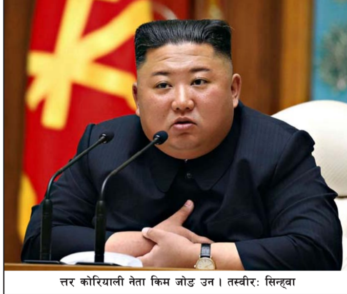
उत्तर कोरियाली नेता किम जोङ उन।

उत्तर कोरियाले सोमवार आफ्नो (बाँकी तस्वीर पातामा)