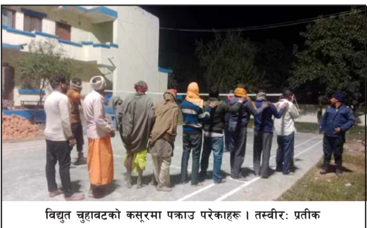
विद्युत् चुहावटको कसूरमा पक्राउ परेकाहरू।