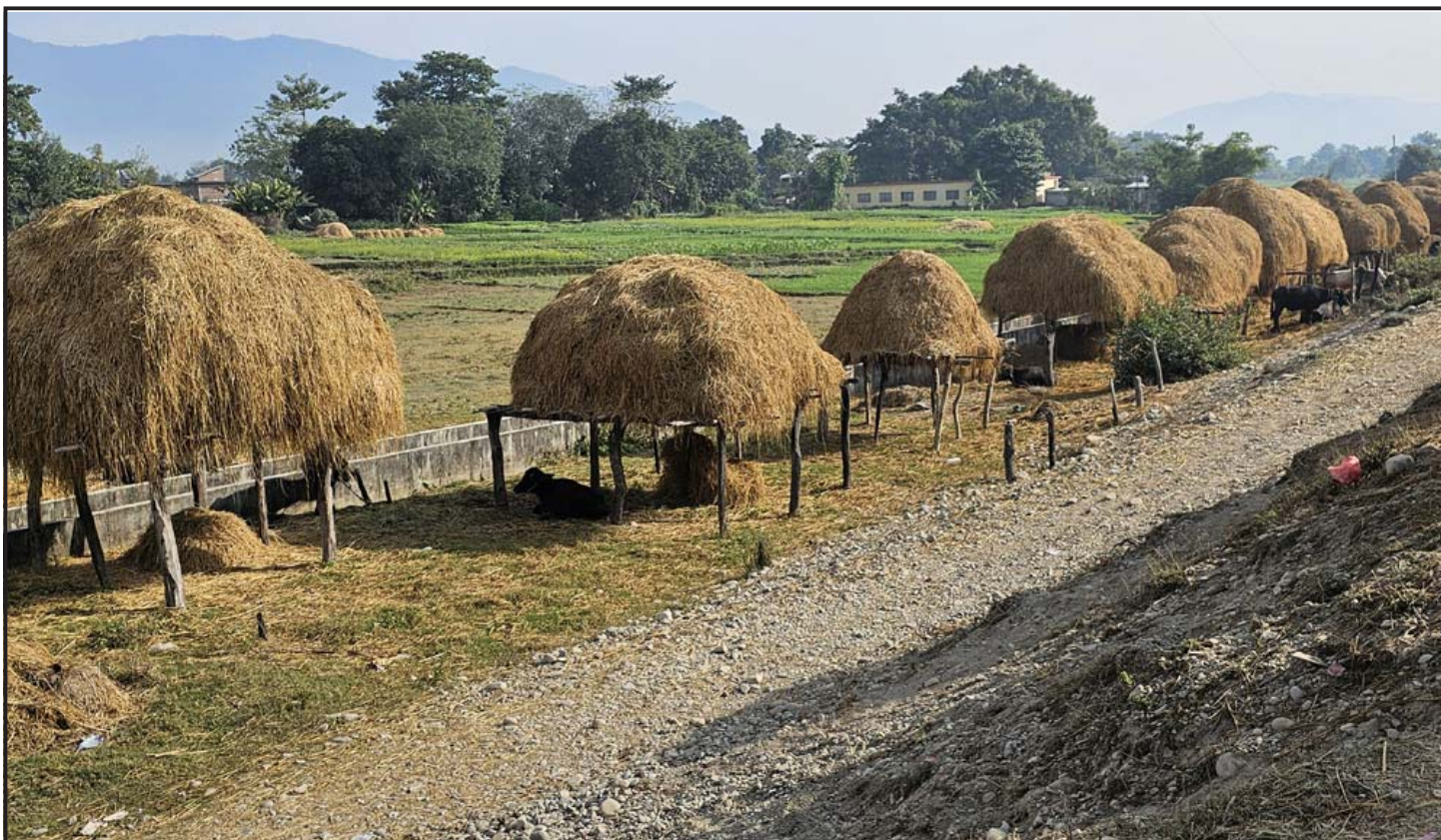
पारालको जोहो : दाङको राप्ति गाउँपालिका-३ स्थित खुर्रियाका स्थानीयवासीले गाईवस्तुलाई खुवाउन सुरक्षित गरेर राखेको पाराल।

उनीहरूले वन नियमावली, २०७९ को नियम ३० (५) र वातावरण संरक्षण ऐन, २०७६ को दफा ३ (ख) बमोजिम तथा ढुङ्गा, गिट्टी, बालुवा उत्खनन, बिक्री तथा व्यवस्थापनसम्बन्धी मापदण्ड, २०७७ को दफा ४(ख) र ६(३) बमोजिमको प्रक्रिया पूरा नगरी अवैध ढुङ्गा, गिट्टी तथा बालुवाको उत्खनन गर्ने गराउने कार्यमा संलग्न रहेको अनुसन्धानबाट खुलेको विज्ञप्तिमा उल्लेख छ।