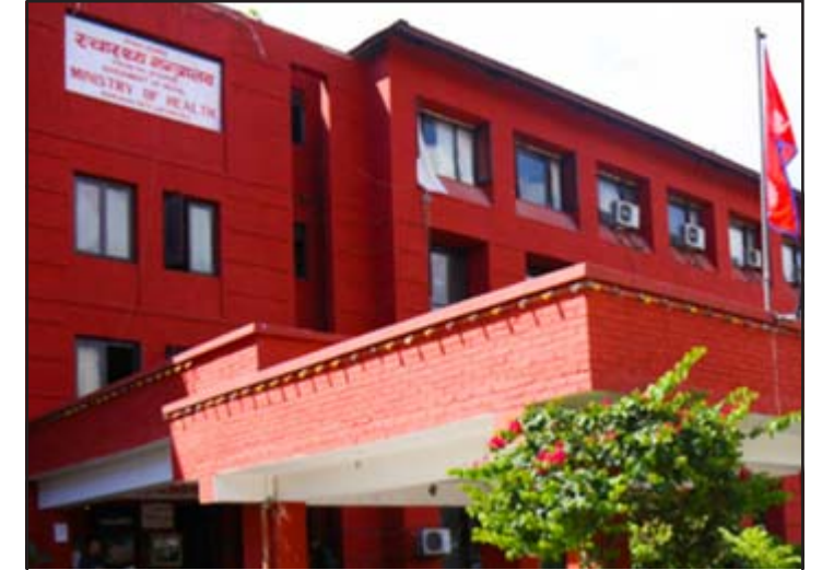
स्वास्थ्य तथा जनसङ्ख्या मन्त्रालय।

श्वासप्रश्वाससम्बन्धी नै लक्षण अहिलेको नयाँ भेरियन्टमा देखिएको छ,” उनले भने, “हामीसँग भएका भौतिक पूर्वाधार