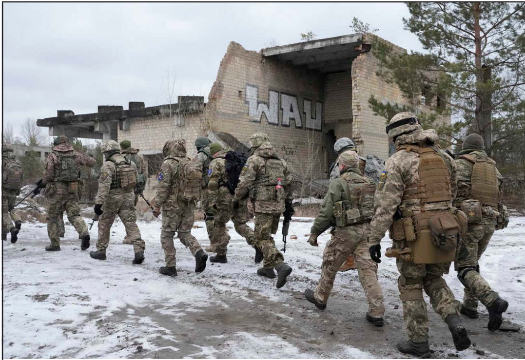
कारबाईको तयारीमा युक्रेनमा रूसी सेना।

सरकारी कामकाज, रूसी सरकारको छात्रवृत्ति तथा पेशा व्यवसायमा संलग्न भएकालाई बाहेक अन्य सर्वसाधारण नागरिकहरूलाई रूस यात्रा गर्नुपरेमा परराष्ट्र मन्त्रालय अन्तर्गतको कन्सुल सेवा विभागबाट जारी गरिने नो अब्जेक्सन सर्टिफिकेट (एनओसी) लिएर मात्र यात्रा गर्न सकिने व्यवस्था गरिएकोमा सो व्यवस्थालाई विस्तार गरी भारत, बङ्गलादेश, श्रीलङ्का, संयुक्त अरब इमिरेट्स, साउदी अरब, कुवेत, कतार र बहराइनबाट समेत रूस यात्रा गर्नुपरेमा तत् देशमा रहेका नेपाली राजदूतावास तथा