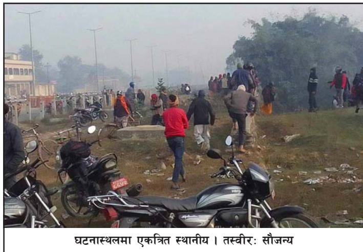
घटनास्थलमा एकत्रित स्थानीय।

प्रहरीलाई खबर गरेको जिल्ला प्रहरी कार्यालय, पर्साले जनाएको छ। उनी मोतिहारीबाट केही दिनअगाडि पत्नीसँगै