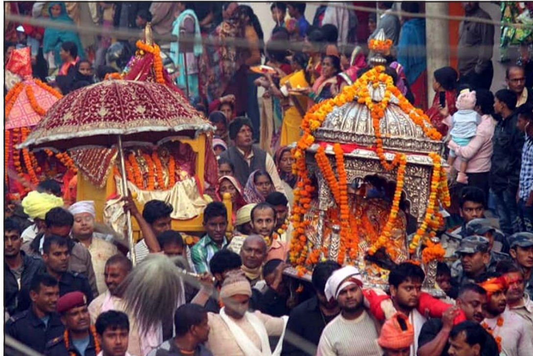
विवाह पञ्चमीका अवसरमा जनकपुरधाममा आइतवार भगवान् राम सीताको डोलासहित निकालिएको भ्रुकीमा देखिएका श्रद्धालु भक्तजनको भीड।

त्रेतायुगमा मिथिलापति शिरध्वज जनकले सीता स्वयंवरको आयोजना गर्दा देशदेशान्तरका सयौं राजा र राजकुमार उपस्थित हुन पुगेको ऐतिहासिक तथा पौराणिक मान्यता छ। अहिले पनि हिन्दू