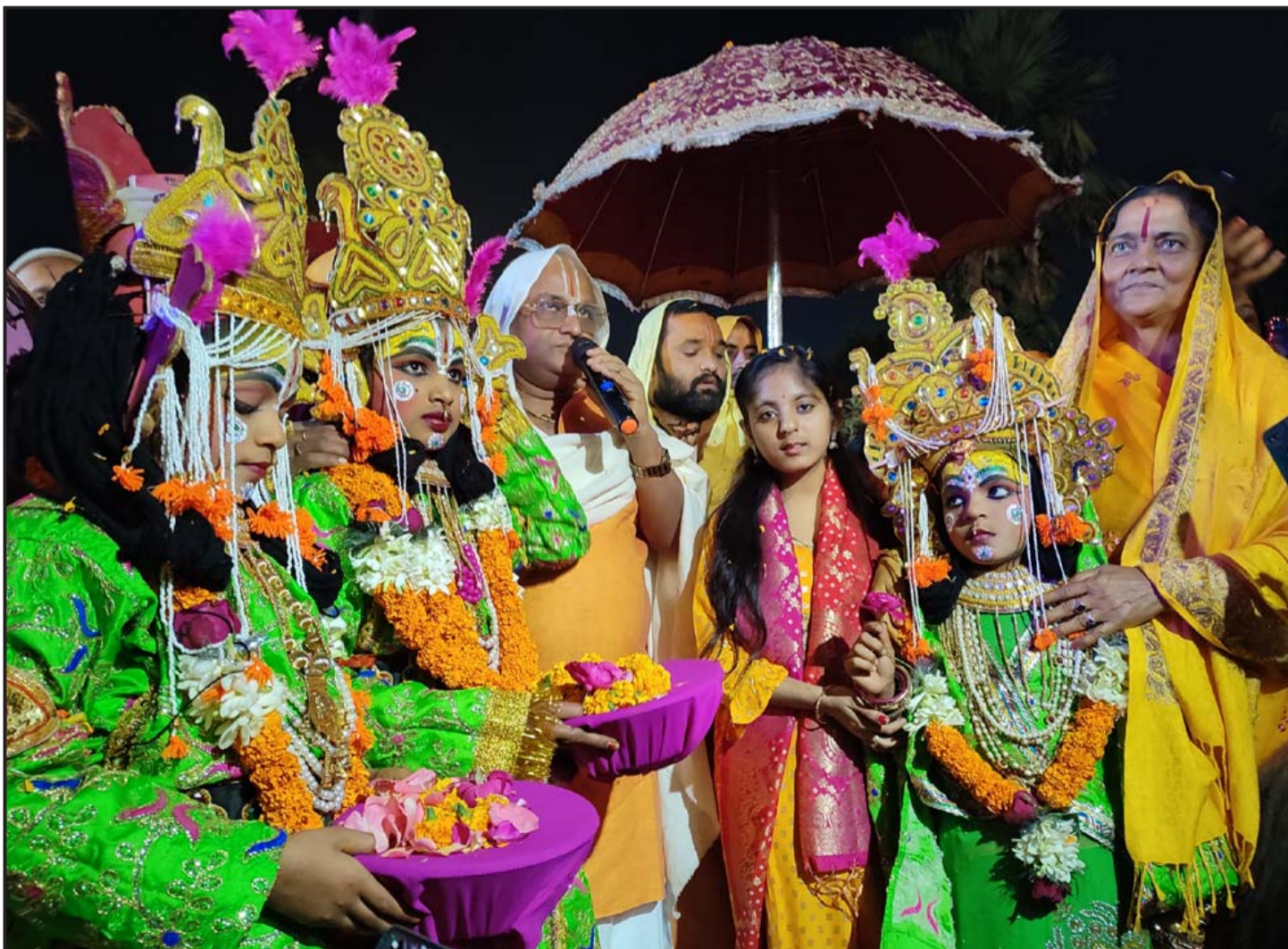
सीताराम विवाहपञ्चमी महोत्सव : जनकपुरधाममा मङ्गलवारदेखि शुरू भएको सप्ताहव्यापी सीताराम विवाहपञ्चमी महोत्सवको दोस्रो दिन बुधवार फूलबारी लीला मनाउने क्रममा जानकी मन्दिर छेउमा रहेको विवाहमण्डप परिसरमा राम, लक्ष्मण तथा सीताको भेषमा सजिएका कलाकारहरू।

"इजरायलका विभिन्न क्षेत्रमा रोजगारको प्रलोभन देखाइ पैसा माग्ने गरेको भन्ने सूचना हामीलाई प्राप्त भएको छ, हामी छानबीन गर्दैछौं।"