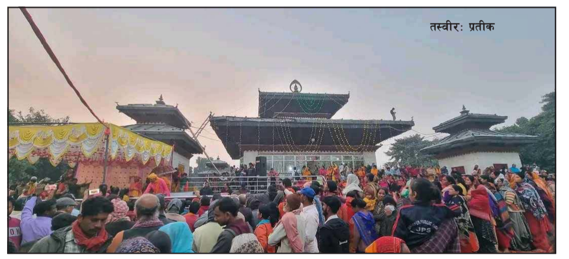
आकलन गरिएको तर आशा गरेभन्दा बढी भक्तजनहरू आउन थालेको बताए ।