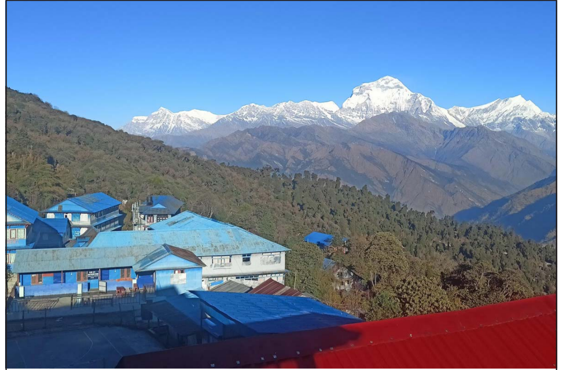
सुन्दर घोडेपानी: चक्रीय अन्नपूर्ण पदमार्गले समेटिएको म्याग्दी जिल्लाको अन्नपूर्ण गाउँपालिका-६ मा अवस्थित पर्यटकीयस्थल घोडेपानीको मनोरम दृश्य। यहाँबाट धौलागिरि र अन्नपूर्ण हिमशृङ्खलाको अवलोकन गर्न सकिन्छ।

जून २०२२ को अन्त्यमा दुई लाख ५८ हजारभन्दा बढी भारतीय नागरिकले भ्रमण भिसा प्राप्त गरेका छन्, यो अघिल्लो वर्षको तुलनामा ६३० प्रतिशतले बढी हो। रासस