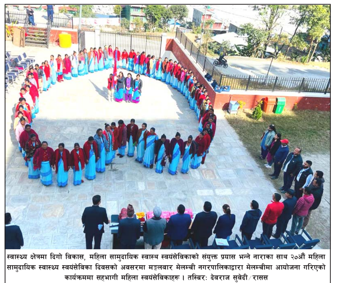
स्वास्थ्य क्षेत्रमा दिगो विकास, महिला सामुदायिक स्वास्थ्य स्वयंसेविकाको संयुक्त प्रयास भन्ने नाराका साथ २०औं महिला सामुदायिक स्वास्थ्य स्वयंसेविका दिवसको अवसरमा मङ्गलवार मेलम्ची नगरपालिकाद्वारा मेलम्चीमा आयोजना गरिएको कार्यक्रममा सहभागी महिला स्वयंसेविकाहरू ।

सरकार निष्कर्षमा पुग्ने बताए । "किनबेच (बाँकी पाँचौं पातामा)