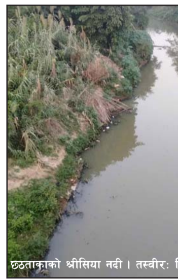
छठताकाको श्रीसिया नदी ।

प्रस, वीरगंज, १९ मङ्सिर/ श्रीसिया नदी छठपछि पुनः प्रदूषित भएको छ । छठको बेला श्रीसिया नदी प्रदूषण गर्ने उद्योगहरूले एक साताको लागि कारखानाको फोहर नदीमा नफालेपछि नदी सफा भएको थियो । तर छठ सकेसँगै नदी आसपासमा रहेका उद्योगहरूले कारखानाका प्रदूषित पानी नदीमा विसर्जन गर्न शुरू गरेपछि अहिले नदी पुरानै अवस्थामा प्रदूषित भएको छ ।