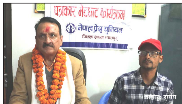
कार्यालयका पदाधिकारीसँग छलफल जारी रहेको भन्दै मन्त्री महतले त्यसपछि

नियमन गर्ने निकाय नेपाल दूरसञ्चार प्राधिकरण र राजस्वका सम्बन्धमा राजस्व अनुसन्धान एवं कर