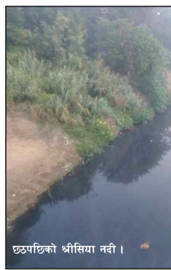
छठपछिको श्रीसिया नदी ।

नगरप्रमुख सिंहले यसबीच श्रीसिया नदी प्रदूषण नियन्त्रण समिति भङ्ग गरेका छन् र यससम्बन्धी कारबाही अगाडि बढ्न सकेको छैन । श्रीसिया नदी प्रदूषणमुक्त गर्ने अभियान अहिलेदेखि चलेको होइन, तीन दशक लामो समयदेखि विभिन्न सङ्घसंस्थाहरूले नदी प्रदूषणमुक्त अभियान सञ्चालन गरेका थिए तर अभियान सञ्चालन भइरहेसम्म प्रदूषण गर्ने कार्य मत्थर हुने र त्यसपछि अभियान सेलाउने र पुनः नदी प्रदूषण हुने कार्य जारी छ ।