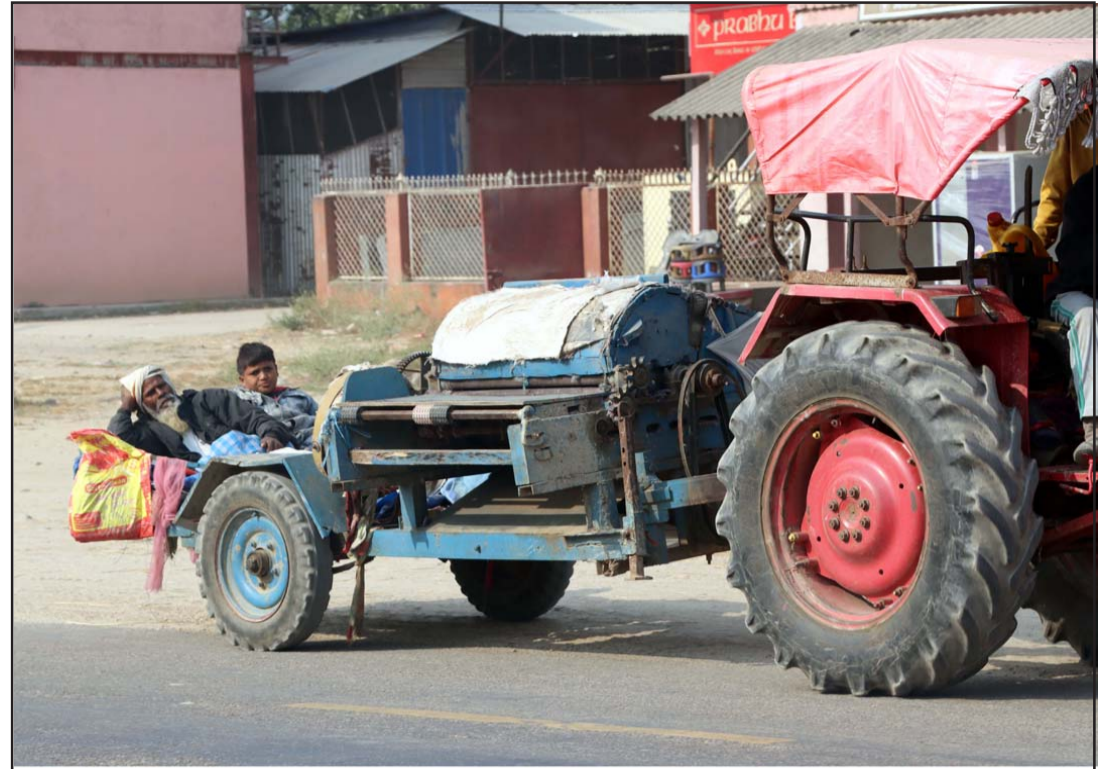
गन्तव्य कहाँ तर जोखिम यात्रा: पुराना कपडा पेलेर उसना, सिरक, चकटी तयार गर्ने मेशीनको टेलरमा चढेर पूर्व-पश्चिम महेन्द्र राजमार्गको निजगढ सडकखण्ड भएर पूर्व गन्तव्यतर्फ जाँदै।