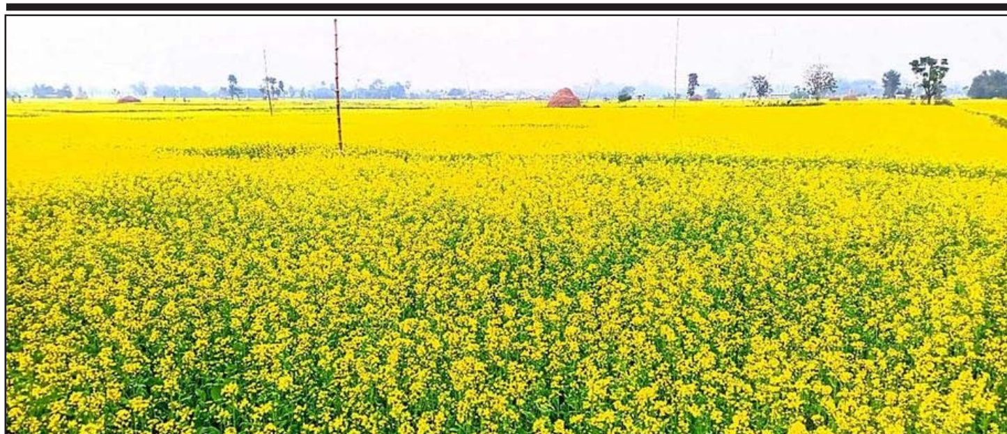
पर्साको ठोरी गाउँपालिका वडा नं ५ सुवर्णपुरमा लगाइएको तोरीबाली।

यसैगरी, नेपाल विश्वकै एक सुन्दर प्राकृतिक देश हो। पर्यटकीय हिसाबले नेपाल विश्वका प्रमुख १० गन्तव्यभित्र रहेको छ। विश्वका २८ अग्ला हिमालमध्ये सबैभन्दा शिखर सगरमाथासहित १४ ठूला हिमशृङ्खला नेपालमै छन्। आँखाले हेरेर नभ्याउने भीमकाय महाभारत पर्वतहरू नेपालमै