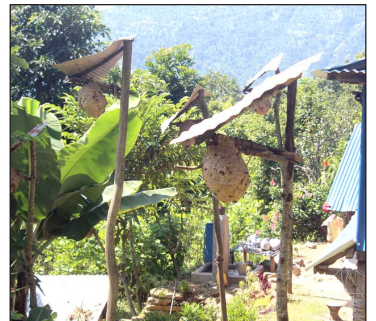
अरिङ्गलपालन: गोरखाको शहीद लखन गाउँपालिका-६, घैरुडस्थित एक स्थानीयको घरमा पालिएको अरिङ्गलको गोला ।