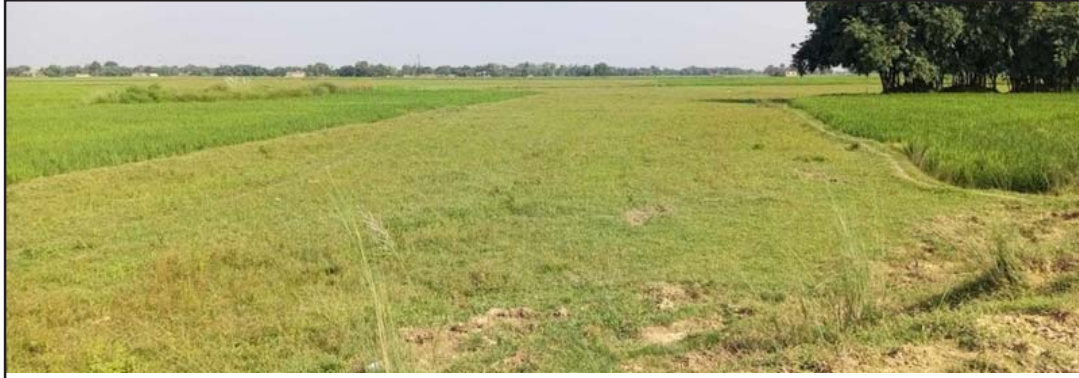
पटेवांसुगौली गाउँपालिका-५ हुलाकी राजमार्गनजिकै बाँझो अवस्थामा रहेको २५ बिघा जमीन ।

बनाइएका छन् भने मत्स्यपालनका लागि पोखरी पनि खनिएका छन् ।