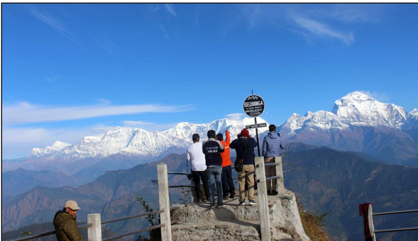
म्याग्दीको बेनी नगरपालिका-३ भकिम्ली र बागलुङको काठेखोला गाउँपालिका-३ धम्जा ओखलेको सिमानामा अवस्थित पर्यटकीय स्थल बेलढुङ्गाको धुरीबाट मनोरम हिमशृङ्खलाको अवलोकन गर्दै गरेको पर्यटकहरू।

यदि तपाईं तनावमा हुनुहुन्छ भने मखानाको सेवन गर्नुहोस्। राति सुत्नुभन्दा पहिले एक गिलास दूधसँग मखाना खानुहोस्। यसबाट निद्रा निकै राम्रो हुन्छ र तनाव रहँदैन।