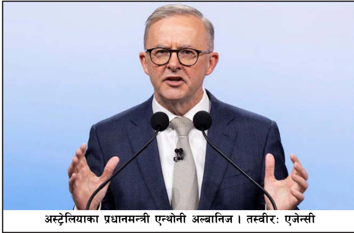
अस्ट्रेलियाका प्रधानमन्त्री एन्थोनी अल्बानिज।

बेइजिङको बढ्दो प्रभावविरुद्ध दबाव दिँदै चीनसँग थप सौहार्दपूर्ण सम्बन्ध खोजेको छ। आइतवार प्रधानमन्त्री अल्बानिजले भने, "एशिया प्रशान्त क्षेत्रको विकास यस्तो लेन्स हो, जसको माध्यमबाट हामी भविष्यका बारेमा धेरै देखौं, चीनसँग अस्ट्रेलियाको सम्बन्ध यी सबैमा एउटा महत्त्वपूर्ण हिस्सा हो।"