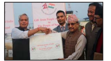
भेन्टिलेटरलगायत चिकित्सा उपकरण र अत्यावश्यक औषधि छन्।

भारतीय वायुसेनाको विशेष विमानले आज दुवानी गरेका ११ टनभन्दा बढी राहत सामग्री मन्त्री खड्कालाई हस्तान्तरण गरिएको हो। आज हस्तान्तरित सामग्रीमा त्रिपाल, टारपोलिन सिट, कम्बल र स्लिपिड ब्याग, पोर्टेबल