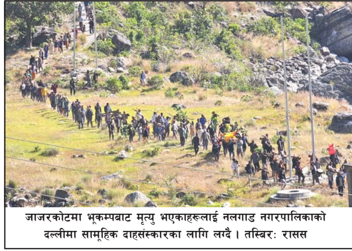
जाजरकोटमा भूकम्पबाट मृत्यु भएकाहरूलाई नलगाड नगरपालिकाको दल्लीमा सामूहिक दाहसंस्कारका लागि लगे।

यो गाउँका पीडितलाई राहत र पुनर्स्थापनाका लागि कुनै कसर बाँकी नराख्ने कर्णाली प्रदेश सरकारले प्रतिबद्धता जनाएको छ।