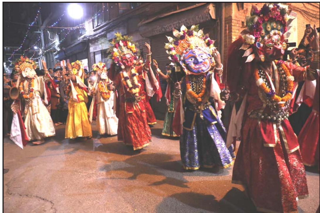
पचली भैरवको १२ वर्षे खड्ग सिद्धि नाच शनिवार राति काठमाडौं महानगरपालिका-२१ ज्यावहा:मा प्रदर्शन गर्दै देवगण। स्थानीय भाषामा गथु प्याखँ भनिने यो नाचमा पचली भैरव, गणेश, ब्रह्मायणी, रुद्रायणी, कुमारी, इन्द्रयणी बाराही, महालक्ष्मी, सिध्दिणी, व्यङ्गिणी, चामुण्डा, वैष्णवी र श्वेतभैरव गरी १३ देवीगण हुन्छन्।