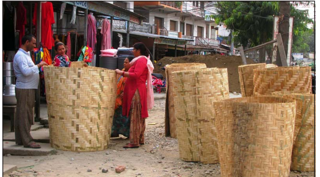
बाँसका भकारी : शुक्लाफाँटा नगरपालिका-१० झलारी बजारमा बिक्रीका लागि राखिएका बाँसबाट निर्मित भकारी। परम्परागत सीपको प्रयोग गरी निर्माण गरिएका बाँसका भकारी धान, गहुँ राख्नका लागि किसानले प्रयोगमा ल्याउने गरेका छन्।

अफगानिस्तानको आन्तरिक मन्त्रालयको लागूऔषध विभागले युएनओडिसीको प्रतिवेदनमा पम्पीको उत्पादनको अनुमानमा केही हदसम्म सहमत भएको जनाएको छ। रासस