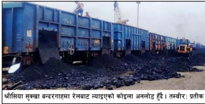
श्रीसिया सुक्खा बन्दरगाहमा रेलबाट ल्याइएको कोइला अनलोड हुँदै ।

थपेर जाँचपास भयो । त्यसपछि युनाइटेड सिमेन्टको एक ट्याक र शिवम् सिमेन्टको दुई ट्याक गरी कुल चार ट्याक कोइला