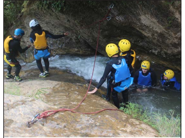
चितवनको इच्छाकामना गाउँपालिका-६ स्थित जलवीरे लामो झरनामा क्यानोनिङमा रमाउँदै पर्यटक।

हुनत उद्यमशीलताले नै दिगो आर्थिक विकास, स्वाधीन अर्थतन्त्र र पूँजी निर्माण गर्ने हो। अर्थतन्त्र सबल बनाउने हो। तर, अहिलेको परिस्थितिमा उद्यमशीलता नै सिर्जना हुन सकेको छैन। उद्यमशीलता गर्न थाल्नु र उद्यमीको मनोबल गिनु सबल अर्थतन्त्रका चुनौती हुन्। त्यसैले उद्योग स्थापनाका लागि स्वदेशी तथा विदेशी लगानीलाई प्रोत्साहित गर्न सक्नुपर्छ। यसका साथै वैदेशिक रोजगारमा देखिएको आकर्षणलाई विकर्षणमा बदलेर युवाका लागि गाउँमै बस्ने र गरीबताले बातावरण सिर्जना गर्नु सरकारको प्रमुख कार्यभार हुनुपर्दछ। औद्योगिक प्रवर्द्धन तथा उद्यमशीलताको माध्यमबाट रोजगार सिर्जना गरी मुलुकको आर्थिक तथा सामाजिक रूपान्तरण गर्ने कार्यमा सरकारको अर्जुनदृष्टि हुनुपर्दछ। विदेशी लगानी भित्र्याउने रणनीतिको उद्देश्य पनि उत्पादकत्व वृद्धि र आर्थिक विस्तारकै लागि हुनुपर्छ। अहिले नेपाल राष्ट्र बैंकले सीमा घटाउन गरेको नीतिगत परिवर्तन धेरै उद्देश्यबन्दा तत्काल विदेशी मुद्रा सञ्चिमा परेको चाप कम गर्न प्रेरित भएको देखिन्छ। लगानी नीतिलाई उत्पादकत्वबन्दा फरक उद्देश्य प्रतिको औजार बनाइयो भने त्यसले परिणाम दिदैन र थप विकृति जन्माउँछ। त्यसैले औद्योगिक प्रवर्द्धन तथा उद्यमशीलताको माध्यमबाट रोजगार सिर्जना गरी समतामूलक एवं दिगो आर्थिक विकास हासिल गर्नका लागि वर्तमान सरकारले प्रत्यक्ष वैदेशिक लगानीको उचित वातावरण बनाउन सक्नुपर्दछ।