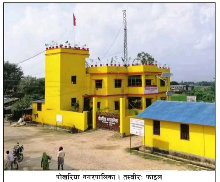
पोखरिया नगरपालिका।