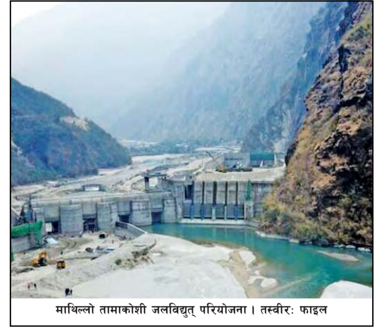
माथिल्लो तामाकोशी जलविद्युत् परियोजना।

कार्यान्वयन भएमा नेपालको जलविद्युत्ले भारतमा राम्रो बजार पाउनेछ।”