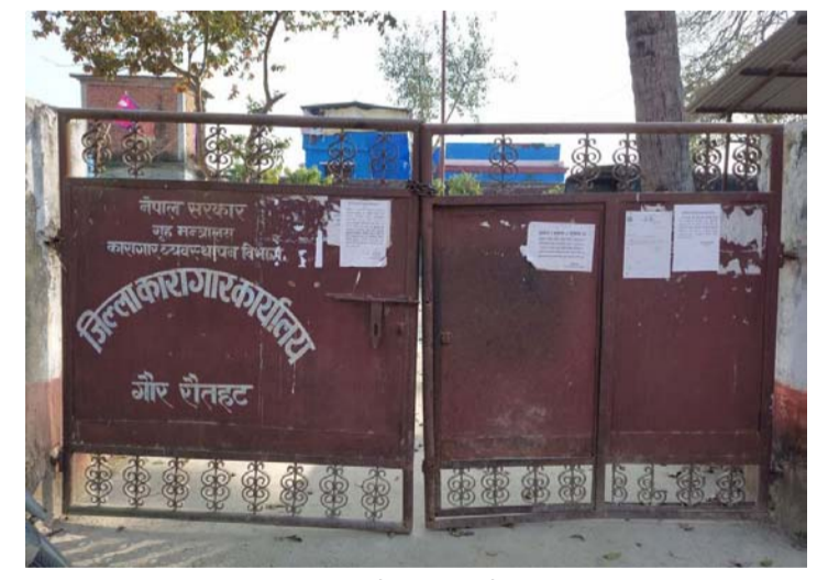
सोबाट प्राप्त रकमले पीठो खरीद गर्छौं, खाने कैदीबन्दीहरू २० जना र एक छाक उनले भने । कारागारमा प्रतिदिन रोटी (बाँकी अन्तिम पातामा)

प्रस, रौतहट, २ कात्तिक/ गौर कारागारका कैदीबन्दीले सरकारद्वारा उपलब्ध गराइएको चामल बिक्री गर्ने गरेका छन् । प्रतिबन्दीलाई सरकारले ७५० ग्राम मन्सुली चामल र ८० रुपैयाँ दुई छाकका लागि दिएकोमा चामल भने कैदीबन्दीहरूले बिक्री गर्ने गरेको पाइएको छ । उनीहरूले चामल बिक्री गर्नुको उद्देश्य भने पीठो खरीद गर्नका लागि गरिएको एकजना कैदीबन्दीले बताए । सरकारले पीठो उपलब्ध नगराउने र चामल मात्र दिने गरेकोले बढी भएको चामल पीठो खरीद गर्नका लागि बिक्री गर्दै आएको उनको भनाइ छ । बढी भएको चामल बिक्री गर्छौं अनि