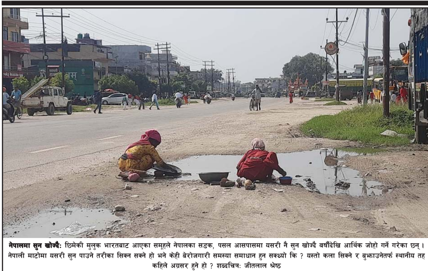
नेपालमा सुन खोज्दै: छिमेकी मुलुक भारतबाट आएका समूहले नेपालका सडक, पसल आसपासमा यसरी नै सुन खोज्दै वर्षौंदेखि आर्थिक जोहो गर्ने गरेका छन् । नेपाली माटोमा यसरी सुन पाउने तरीका सिक्न सक्ने हो भने केही बेरोजगारी समस्या समाधान हुन सक्थ्यो कि ? यस्तो कला सिक्ने र बुझाउनेतर्फ स्थानीय तह कहिले अग्रसर हुने हो ? शब्दचित्र: जीतलाल श्रेष्ठ

एउटा शक्तिशाली राष्ट्रको रूपमा रूसको उदय र चीनको बलियो बन्दै गएको आर्थिक स्थितिले विश्वको राजनीतिक सन्तुलन फेरिएको छ । पहिले अमेरिका एक्लो शक्तिशाली राष्ट्र रहेकोमा अहिले रूस पनि शक्तिशाली बन्न पुगेको छ तर चीनको सहयोगमा ।