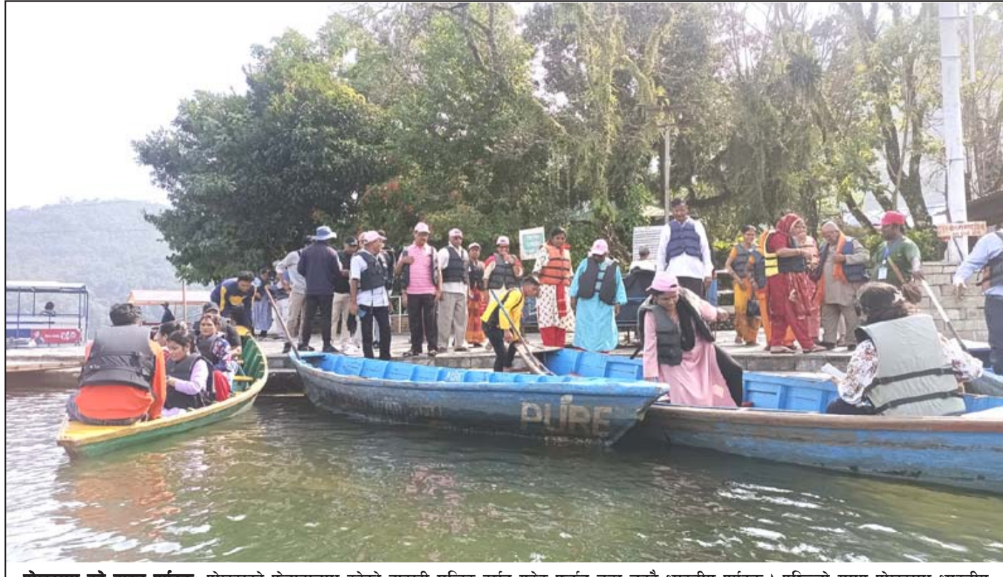
पोखरामा बढे बाह्य पर्यटक: पोखराको फेवातालमा रहेको बाराही मन्दिर दर्शन गरेर फर्कन डुङ्गा चढ्दै भारतीय पर्यटक । पछिल्लो समय पोखरामा भारतीय पर्यटकको आगमन बढेको छ ।

नवरात्रको पहिलो दिन असोज २८ गते आइतवार दशैघर वा पूजा कोठामा वैदिक विधिपूर्वक घटस्थापना गरी जौको जमरा राखिएको थियो । त्यसै दिन घटस्थापना गरिएको स्थानमा नौ दुर्गामध्येकी पहिलो देवी शैलपुत्रीको आह्वान गरी विधिपूर्वक पूजा आराधना गरियो । दोस्रो दिन सोमवार पूजास्थलमा (बाँकी पाँचौं पातामा)