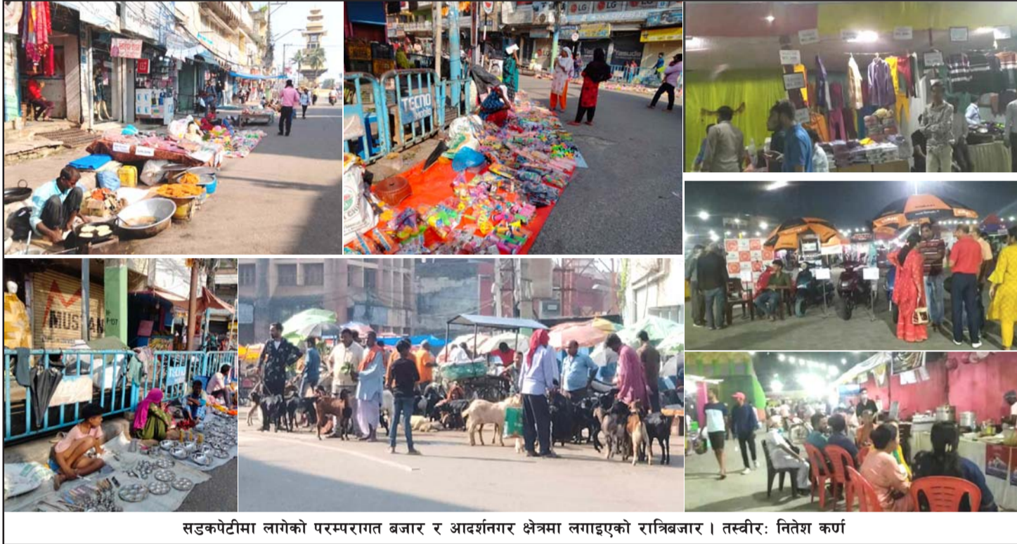
सडकपेटामा लागेको परम्परागत बजार र आदर्शनगर क्षेत्रमा लगाइएको रात्रिबजार ।

प्रस, वीरगंज, २ कात्तिक/ वीरगंज महानगरपालिका कार्यालयले