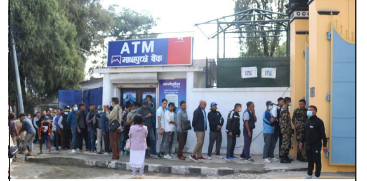
नयाँ नेपाली नोट साट्न लामबद्ध: नेपाल राष्ट्र बैंक, बालुवाटारमा बिहीवार नयाँ नेपाली नोट साट्नका लागि लामबद्ध सर्वसाधारण । दशैका लागि उनीहरू नयाँ नेपाली नोट साट्न पालो कुरेर बसेका हुन् ।

माथि बयान गरिएका परिस्थितिहरूले गर्दा विश्व अर्थव्यवस्थामा ठूलो सङ्कट आउने देखिएको छ । यदि तेस्रो विश्वयुद्ध भएमा विश्व अर्थव्यवस्था ध्वस्त पनि हुन सक्छ । कामना गरौं, तेस्रो विश्व युद्ध नहोस् । इजराइल-हमास युद्ध र रूस-युक्रेन युद्ध सदाको लागि समाप्त होस् ।