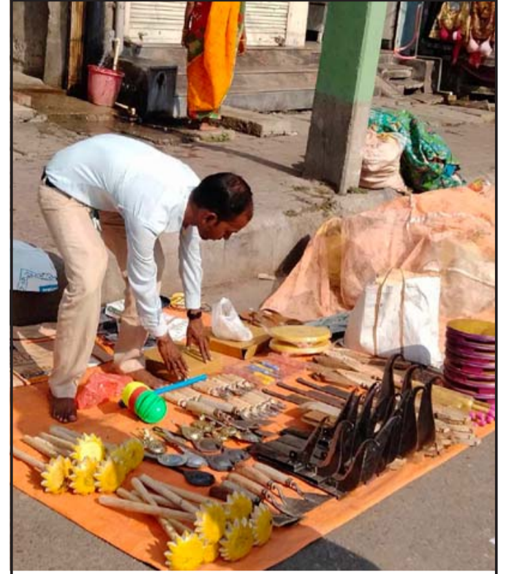
माईस्थान क्षेत्रको सडकपेटिमा बसेर चुलेसी, दाल मथने, खुर्पी, बेलना-चौकी तथा अन्य औजार बेच्दै एकजना व्यापारी ।

नेपालमा अधिकांश सुन्तला कात्तिकदेखि मङ्सिरको अवधिमा पाक्छन् । खड्काले भने भदौदेखि असोजको समयमा पाक्ने जापानिज जातका सुन्तला लगाएका छन् । खड्काले पाँच रोपनी क्षेत्रफलको सुन्तला बगैचामा हालसम्म १४ प्रजातिका सुन्तलाका बिरुवा लगाएका छन् । खड्काले मौसमी र बेमौसमी सुन्तला उत्पादनसँगै किवी, अलैंची र तरकारी खेती गर्दै आएका छन् ।