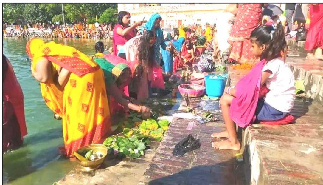
सन्तान र पतिको दीर्घ जीवन, पुत्रप्राप्ति तथा पारिवारिक सुख-शान्तिका कामनासहित तराई/मधेस क्षेत्रमा मनाइने जितिया पर्वको अवसरमा बिहीवार पोखरीमा झिगनीको पातमा खरी र तेल चढाउँदै भक्तजन।