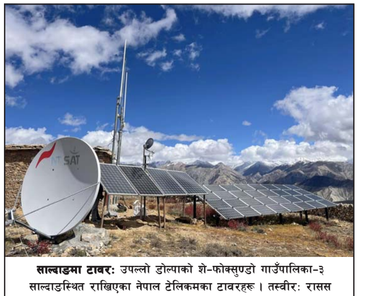
साब्बाङमा टावर: उपल्लो डोल्पाको शे-फोकसुण्डो गाउँपालिका-३ साब्बाङस्थित राखिएका नेपाल टेलिकमका टावरहरू ।

कालीगण्डकी करिडोर अन्तर्गत कोरला नाका जोड्ने सडक स्तरोन्नतिको क्रममा रहेको छ । सीमानाका निरीक्षणसँगै गण्डकी प्रदेशस्तरीय सुरक्षा समिति र मुस्ताङ जिल्लास्तरीय सुरक्षा समितिको बैठक पनि कोरलामा बसेको थियो । मुख्यमन्त्री पाण्डेसहित सङ्घीय सांसद, प्रदेशभा सदस्यलागायतले मुस्ताङ जिल्लाको सीमावर्ती क्षेत्रका १० भन्दा बढी गाउँमा पुगेर स्थानीयसँग भेट गरेका थिए ।