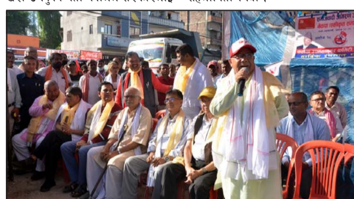
कार्यक्रममा सम्बोधन गर्दै नेकपा एसका अध्यक्ष माधवकुमार नेपाल।

कारण आक्रान्त बनिरहेका उनको जिकिर थियो। मिटरब्याजीका पीडा भोगिरहेका गरिबहरूको समस्याको समाधानमा सरकार इमानदारीका साथ खरो उत्रनुपर्ने नेता नेपालले सरकारलाई