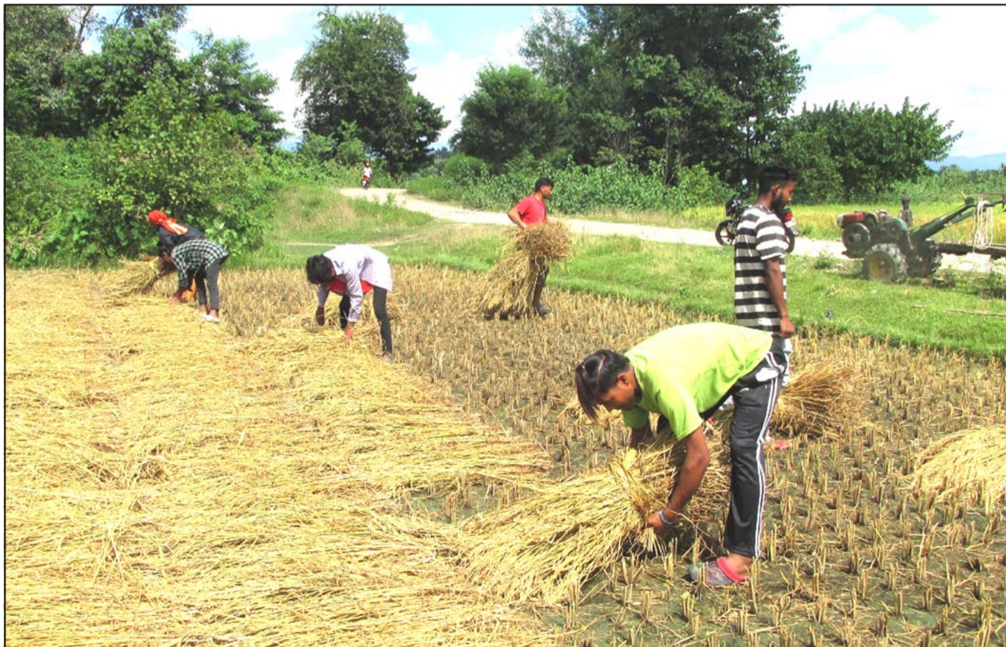
आकाशमा बादल मडारिन शुरू भएपछि कञ्चनपुरको शुक्लाफाँटा नगरपालिका-३ का किसान खेतमा काटिएको धानका मुठा बाँड्दै । पानी पर्ने सम्भावना बढेपछि किसान खेतमा काटिएको धानलाई सुरक्षित तवरले राख्नका लागि खेतबारीमा व्यस्त हुन थालेका छन् ।