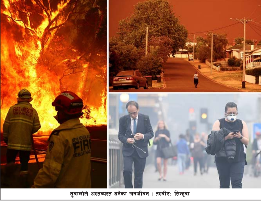
तुवालोलो अस्तव्यस्त बनेका जनजीवन।

सिन्धी, १९ असोज/सिन्धुवा अस्ट्रेलियाको न्यु साउथ वेल्समा गत शुक्रवारदेखि लागेको आगो बिहीवारसम्म चार सय जङ्गलमा फैलिएको स्थानीय अधिकारीहरूले बताएका छन्। बेगा उपत्यका, मध्य पश्चिम, हन्टर र उत्तरी कोस्टसहित राज्यका थुप्रै क्षेत्रमा आगो निभाउन अनिनियन्त्रकहरूलाई व्यस्त समय भएको न्यु साउथ वेल्स रूल फायर सर्भिस (आरएफएस)ले बताएको छ।