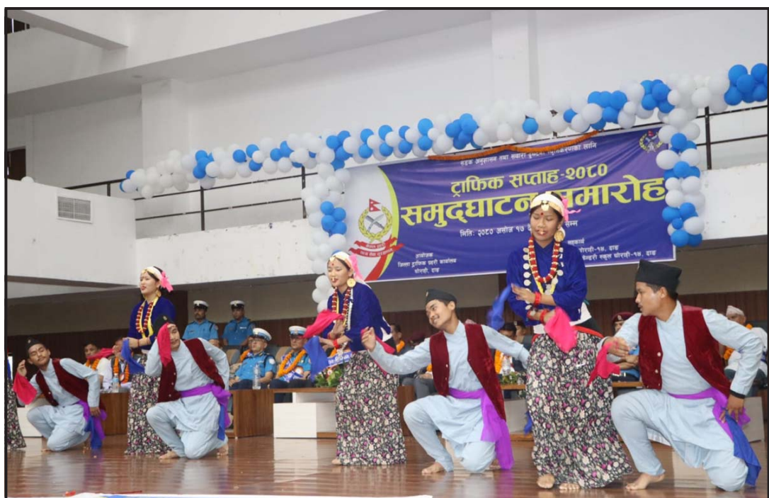
जिल्ला ट्राफिक प्रहरी कार्यालय दाङले शुरू गरेको ट्राफिक सप्ताहको उद्घाटन समारोहमा ट्राफिक सचेतना नृत्य प्रस्तुत गर्दै घोराहीस्थित गोरखा माविका विद्यार्थी।