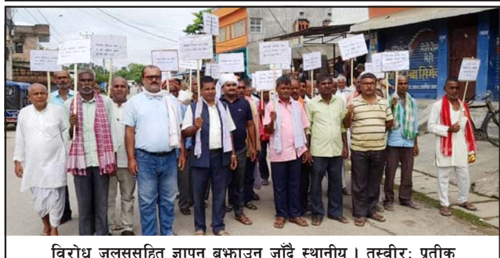
विरोध जुलुससहित जापन बुझाउन जाँदै स्थानीय ।