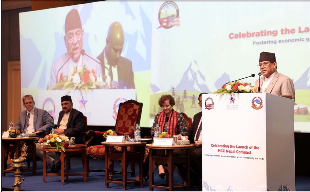
एमसिसी नेपाल परियोजना शुभारम्भ भएको अवसरमा बुधवार आयोजित कार्यक्रममा मन्त्रव्य व्यक्त गर्दै प्रधानमन्त्री पुष्पकमल दाहाल 'प्रचण्ड'।

एमसिसी परियोजना पूरा भएपछि नेपालको समग्र अर्थतन्त्र सुदृढ बन्ने बताउँदै प्रधानमन्त्री प्रचण्डले नेपालको विकासमा अमेरिकीको सहयोग महत्वपूर्ण रहेको उल्लेख गरे। उनले यस