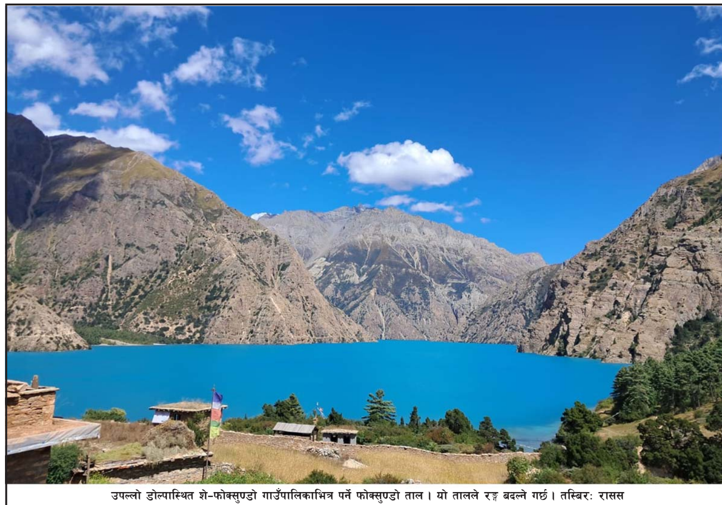
उपल्लो डोल्पास्थित शे-फोक्सुण्डो गाउँपालिकाभित्र पर्ने फोक्सुण्डो ताल। यो तालले रङ्ग बदल्ने गर्छ।