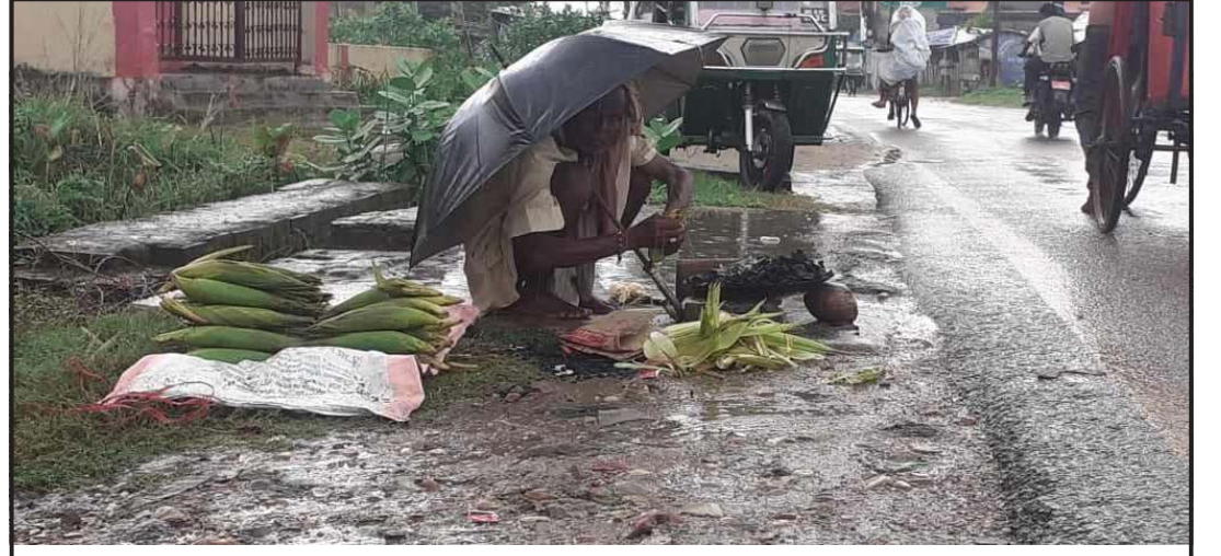
करीमा मकै बेच्दै वृद्ध: वीरगंज-१३ को सडकछेउमा बुधवार करीको समयमा मकै बेच्दै एकजना वृद्ध। मकैको छुटा बाला पोलेर रु २०-२५ मा बिक्री हुन्छ।

त्यसको केही समयमा म्याककार्थीका शीर्ष सहयोगी रिपब्लिकन सदस्य प्याट्रिक म्याकहेनरी आर एन सीलाई सदनको नियमानुसार अर्को सभामुख चयन नभएसम्मका लागि काम गर्न नियुक्त गरियो। रासस