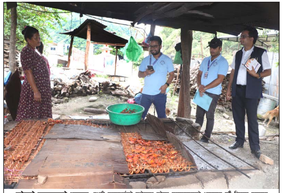
मलेखुको माछापसलको अनुगमन: पृथ्वी राजमार्गको मलेखुमा रहेका माछापसलको अनुगमन गर्दै जिल्ला प्रशासन कार्यालय र घरेलु तथा साना उद्योग कार्यालयको टोली। टोलीले मलेखुका माछा प्रशोधन केन्द्र, माछापसल र होटलबाट हानिकारक रङ मिसावट गरिएका ५० हजार बराबरको माछा जफत गरेको छ।

उनले सरकारका तर्फबाट समकालीन शिखर व्यक्तित्व डा दासलाई दीर्घ (बाँकी पाँचौं पातामा)