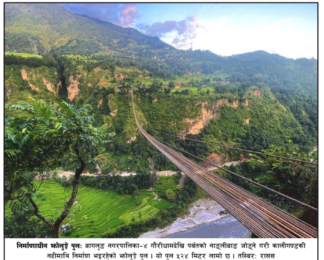
निर्माणधीन भोलुङ्गे पुल: बागलुङ नगरपालिका-४ गौरीधामदेखि पर्वतको नाङ्गलीबाड जोड्ने गरी कालीगण्डकी नदीमाथि निर्माण भइरहेको भोलुङ्गे पुल । यो पुल ५२४ मिटर लामो छ ।

त्रिभुक्ति सिनेमा हल रोड, श्रीपुर, वीरगंज-११ (नेपाल), पोस्ट बक्स नं. ७८, फोन नं. ०५१-५२५१२२, ५२३९०५ email: prateekdaily@gmail.com, Website: eprateekdaily.com