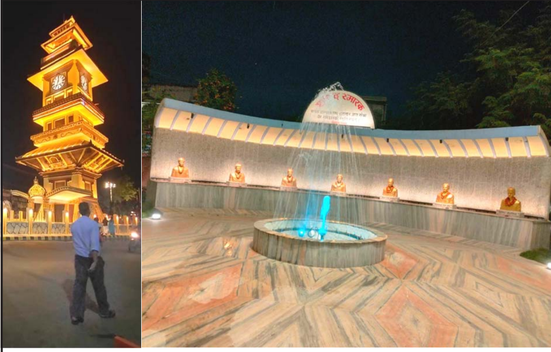
वीरगंजको घण्टाघर र शहीद स्मारकमा लाइटिङ र फाउन्डेसनको काम भएपछि अहिले सो क्षेत्रमा सेल्फी लिनेहरू आकर्षित हुन थालेका छन् ।