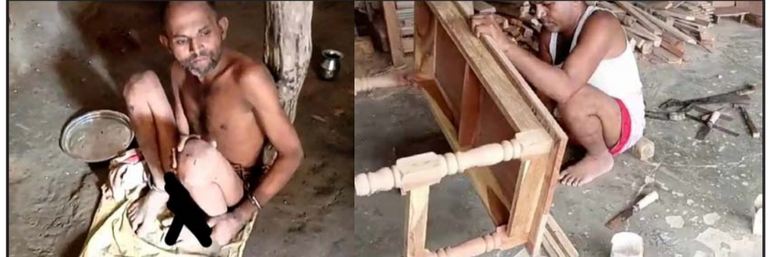
तीन वर्षअघि गोठमा सिक्रीले बाँधिँएर राखिएका ठाकुर अहिले उपचारपछि फर्निचरको काम गर्दै।

बताउँछन्। मानसिक स्थिति बिग्रिएपछि उनलाई