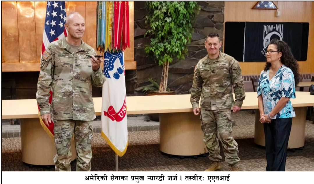
अमेरिकी सेनाका प्रमुख यान्डी जर्ज ।

गर्ने साझा रणनीतिसमेत तयार गर्नुपर्ने परिस्थिति उत्पन्न भएको बताउँदै उनले सेनाहरूबीचको सम्बन्ध बलियो बनाउन