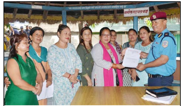
दोषीलाई कारबाहीको माग गर्दै महिलाहरू ।

यता सो घटनामा संलग्न अभियुक्तलाई हदैसम्मको कानूनी कारवाही गर्न मेचीमहाकाली संयुक्त बुहारी