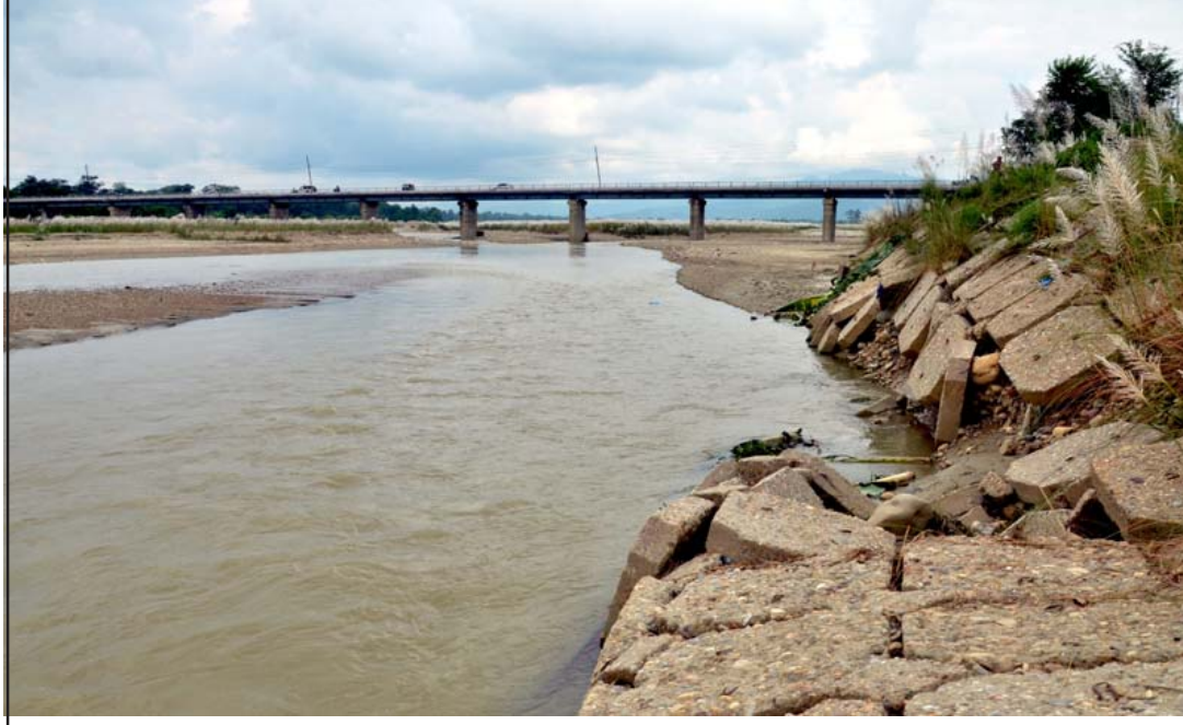
पूर्व-पश्चिम राजमार्गको निजगढस्थित बकैया पुल र बाढीले भत्काएको पक्की डयाम।

मा बकैया खोलामा नदीजन्म पदार्थ उत्खनन, सङ्कलन गर्न ठेक्का लगाएको थियो।