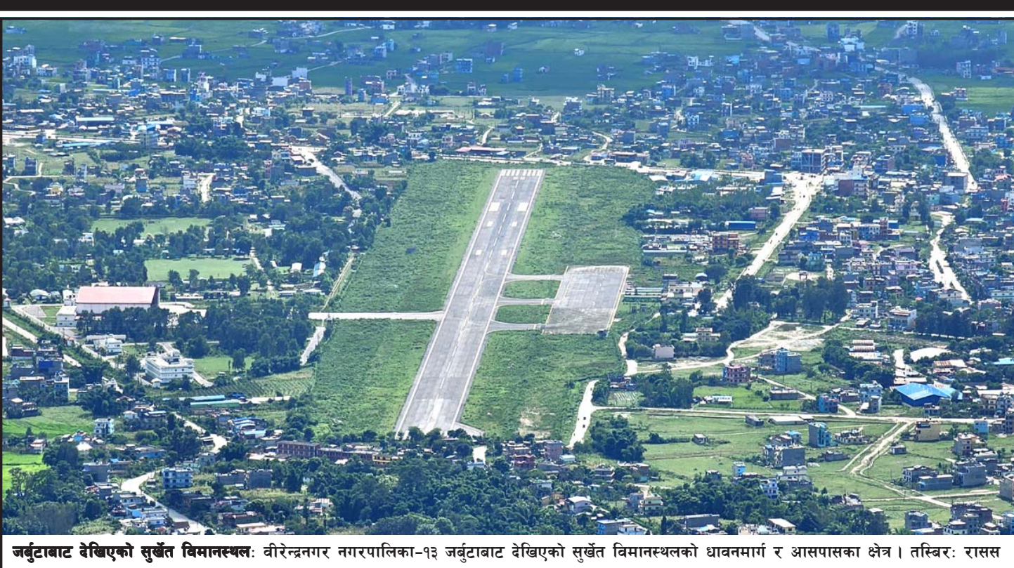
जर्बुटाबाट देखिएको सुर्खेत विमानस्थल: वीरेन्द्रनगर नगरपालिका-१३ जर्बुटाबाट देखिएको सुर्खेत विमानस्थलको धावनमार्ग र आसपासका क्षेत्र।

नेपालका राजनीतिक दलहरूले माथि भनिएका दुवै स्रोतको राम्रो उपयोग हुने