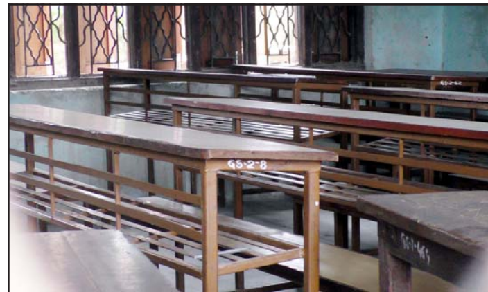
शिक्षकहरू आन्दोलनका लागि काठमाडौं गएपछि बिहीबार बन्द अवस्थामा निजगढस्थित सामुदायिक विद्यालयको कक्षाकोठा।

भरण हुनेगरी समय मिलान गरी विद्यार्थीहरूलाई अध्ययन गराइने नेपाल शिक्षक महासङ्घको भनाइ छ। विद्यालयहरू बन्द भएपछि विद्यालय पुगेर घर फर्कंदै गरेका विद्यार्थीहरूले बताए। "सरहरू काठमाडौं जुलूसमा सहभागी हुन जाने भनेका त सुनेका थियौं। विद्यालय