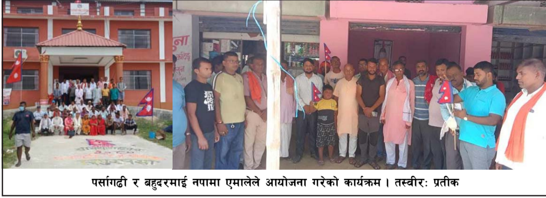
पर्सागढी र बहुदरमाई नपामा एमालेले आयोजना गरेको कार्यक्रम।