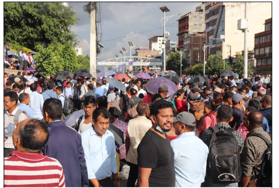
संसद्मा दर्ता भएको विद्यालय शिक्षा विधेयकप्रति असन्तुष्टि जनाउँदै काठमाडौंको नयाँ बानेश्वरमा नेपाल शिक्षक महासङ्घद्वारा आयोजित धर्नामा सहभागी सामुदायिक विद्यालयका शिक्षक, कर्मचारीहरू।