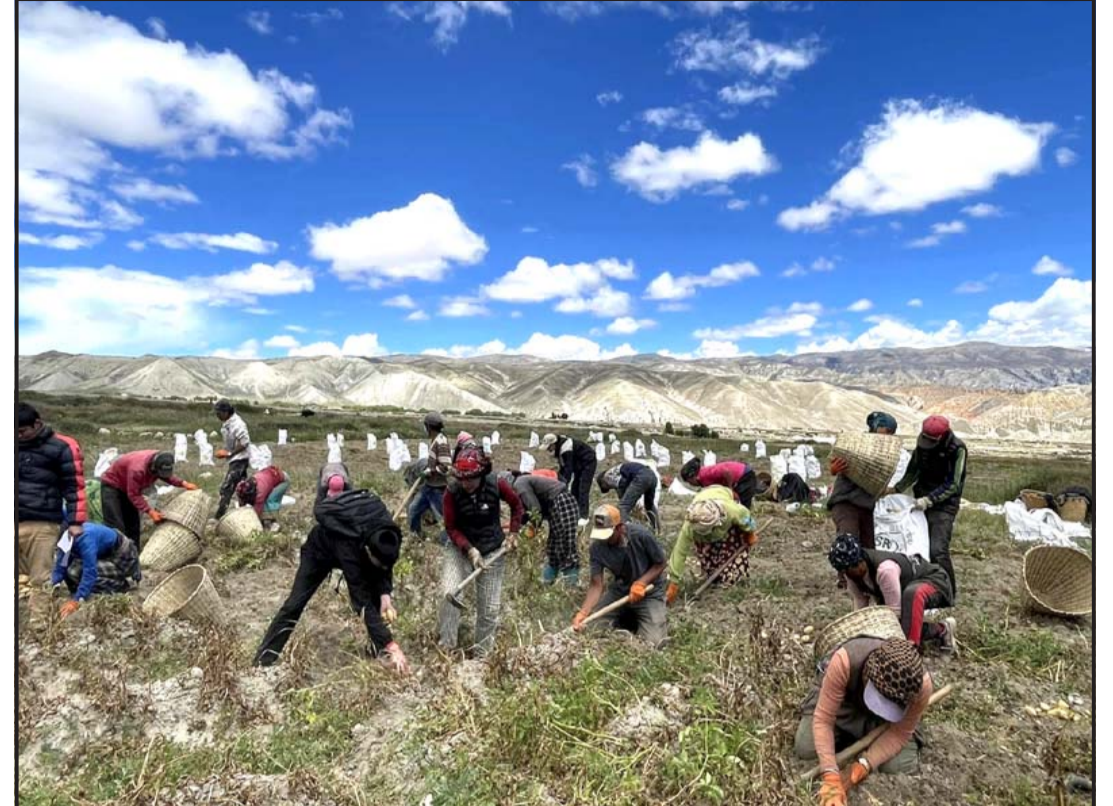
आलुखेती : मुस्ताङको लोमान्थाङ गाउँपालिका-३ थिङ्गुरा कृषकले सामूहिकरूपमा गरेको आलु खन्दै। लोमान्थाङ गाउँपालिकाको आर्थिक सहयोगमा डेकार कृषक समूहले १३० रोपनी बाँझो जग्गामा सामूहिक आलुखेती गरेर आम्वानी लिन थालेका छन्।

१,६४६ घरमा सामान्य क्षति पुगेको छ। अन्य १३७ घरमा भने पूर्ण क्षति भएको छ। आँधीले ४२ हेक्टरमा लगाइएको बाली क्षति भएको छ। आँधीबाट ४०५ जना विस्थापित भएका छन्। नहरको आपत्कालीन व्यवस्थापन विभागले उनीहरूलाई सहायता सामग्री प्रदान गरेको छ। रासस