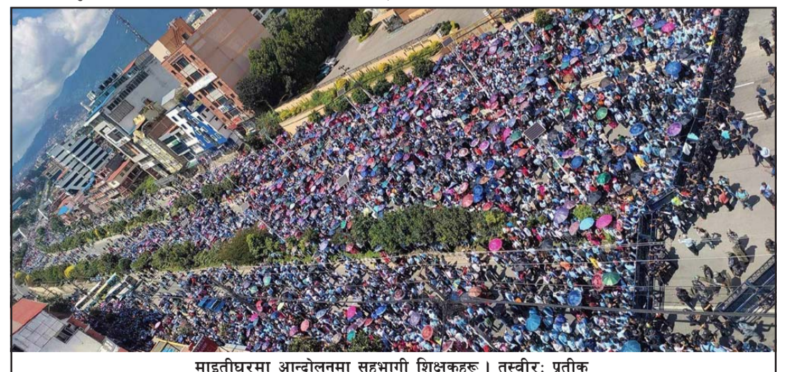
माइतीघरमा आन्दोलनमा सहभागी शिक्षकहरू ।

विवाद भएको थियो । ७७ वटै जिल्लाबाट अनुमानित एक लाख शिक्षक सहभागी थिए । माइतीघर मण्डलामा आन्दोलनमा