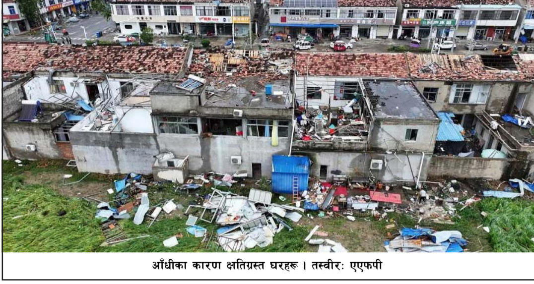
आँधीका कारण क्षतिग्रस्त घरहरू।