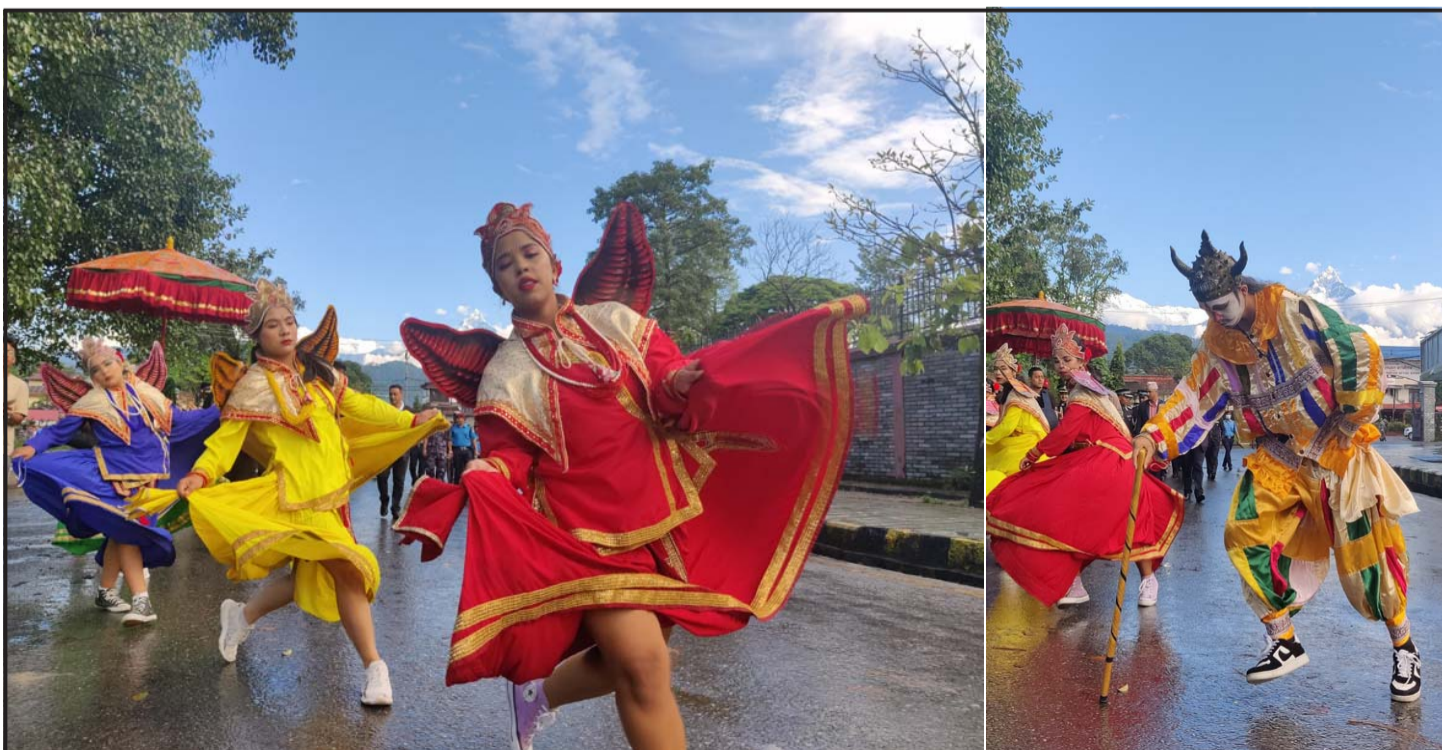
गण्डकी प्रदेश सरकारले संविधान दिवसको अवसरमा बुधवार बिहान पोखरामा निकालेको प्रभातफेरी कार्यक्रममा भाँकीसहित सहभागीहरू।

संविधानले स्थापित गरेको अर्को सन्दर्भ हो सङ्घीयता। सत्य हो, संविधानको सफल कार्यान्वयनका दिशामा अनेक चुनौती छन्। सङ्घीयता कार्यान्वयनको सन्दर्भ यस्तै एक अर्को