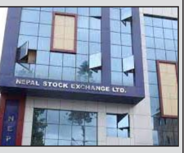
नेपाल स्टक एक्सचेन्ज लिमिटेडको कारोबार भएको छ।

यो साता शेयर बजारमा तीव्र उतारचढाव देखिएको छ। आजको कारोबारपछि बजार पूँजीकरण र ३० खर्ब चार अर्ब ६२ करोड ५२ लाख ३८ हजार ३२६ पुगेको छ।