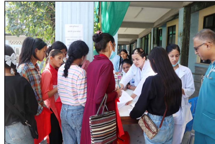
पोखरा स्वास्थ्य विज्ञान प्रतिष्ठान अन्तर्गतको पश्चिमाञ्चल क्षेत्रीय अस्पताल पोखरामा बुधवार किशोरीलाई पाठेघरको मुखको क्यान्सरविरुद्धको 'एचपिभी' खोप लगाउनका लागि नाम दर्ता गराउँदै स्वास्थ्यकर्मी।

एचपिभी खोप लगाएपछि किशोरीमा खोप लगाएको ठाउँमा दुख्ने तथा सुनिने, टाउको दुख्ने, वाकवाकी लाग्ने, थकान महसूस हुने, रिङ्गटा लाग्ने, ज्वरो आउनेजस्ता समस्या देखिने गर्छन्। खोप एलर्जी भएमा वा पहिलो मात्रा लगाएर कडा किसिमको प्रतिक्रिया भएमा, ज्वरो आएको अवस्थामा र गर्भवती अवस्थामा खोप नलगाउन आग्रह गरिएको छ।