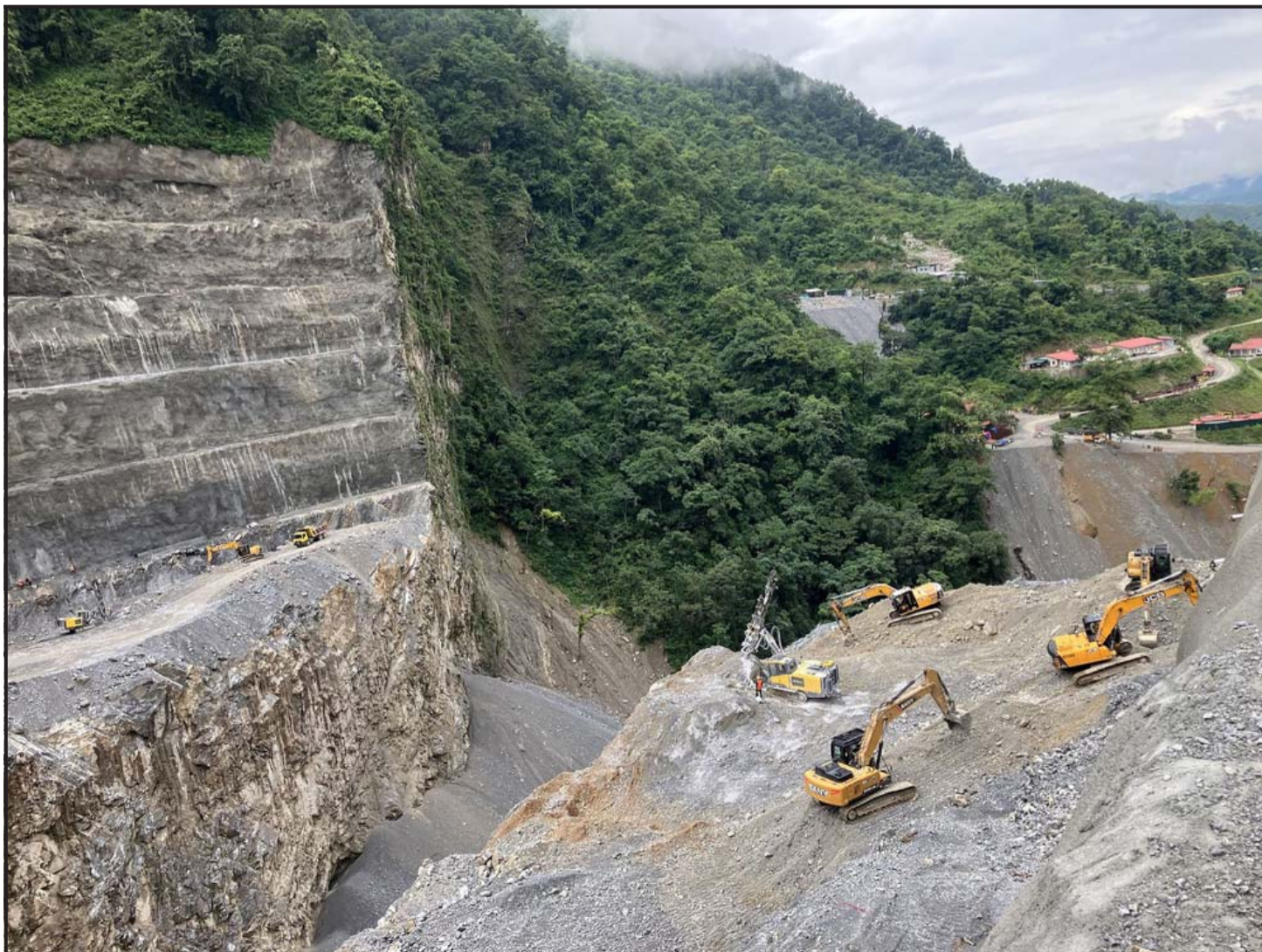
बाँध निर्माणस्थल : तनहुँको ऋषिड गाउँपालिका-१ मा निर्माणाधीन १४० मिटर क्षमताको तनहुँ जलविद्युत् आयोजनाको बाँध निर्माणस्थल। सेती नदीको दायो र बायाँतर्फबाट पहाड काट्ने तथा खन्ने र आवश्यक सपोर्टका लागि सटक्रिट, वायरमेश तथा रिस्स जडानका काम भइरहेको छ।