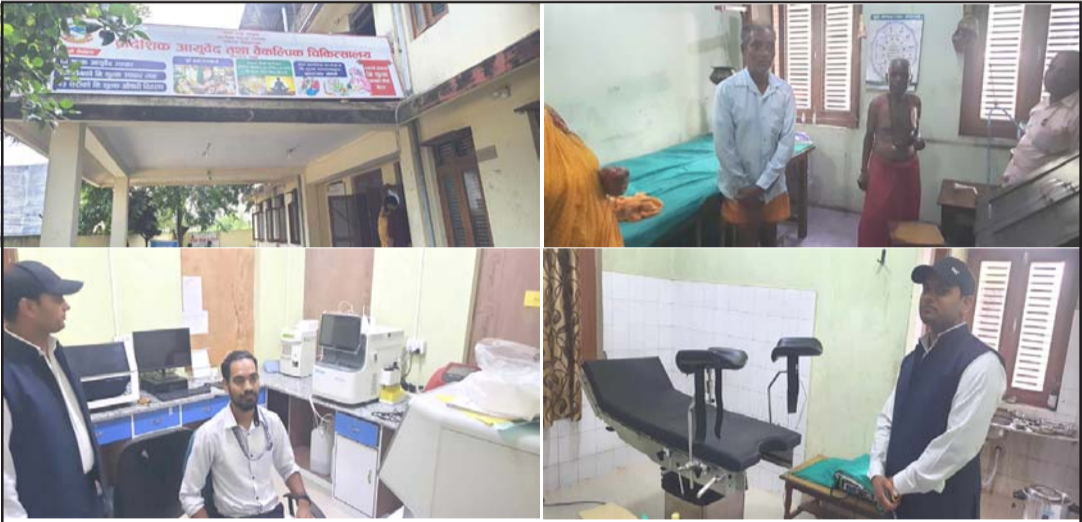
प्रादेशिक आयुर्वेद तथा वैकल्पिक चिकित्सालय वीरगंजमा आधुनिक प्रयोगशाला ।

ल्याब सञ्चालनमा रहेको डा गुप्ताले बताए । आयुर्वेद चिकित्सालयमा अग्निकर्म,