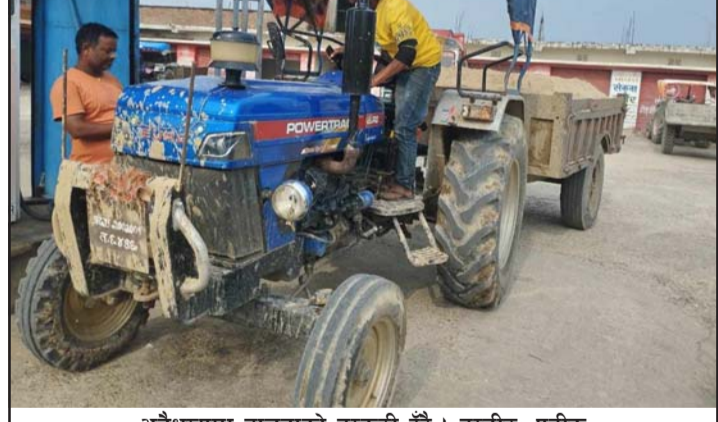
अवैधरूपमा बालुवाको तस्करी हुँदै ।

वीरगंज महानगरपालिका अन्तर्गत भेडाहा खोला, पर्सागढी नगरपालिका अन्तर्गत कर्जनिहा र सिङ्गाही खोलाबाट दिनहुँ गिट्टी, बालुवाको चोरी तस्करी हुँदासमेत वनकर्मी र प्रहरी मुकदशक देखिएका छन् । ती खोलाहरूबाट दिनहुँ गिट्टी, बालुवा चोरी तस्करी गरी सबडिभिजन वन कार्यालय सबैया, सबडिभिजन वन कार्यालय बडनिहार र सो मातहत रहेका छतवनटाँडी वन कार्यालय, मनवा वन कार्यालय, मिलनचोक प्रहरी चौकी, बडनिहार प्रहरी चौकी, मनवा प्रहरी चौकीकै अगाडिबाट गिट्टी, बालुवा ओसारपसार हुने गर्छ । असार १ गतेदेखि बन्द भएका खोलाहरू पालिकाहरूले समयमा ठेक्का