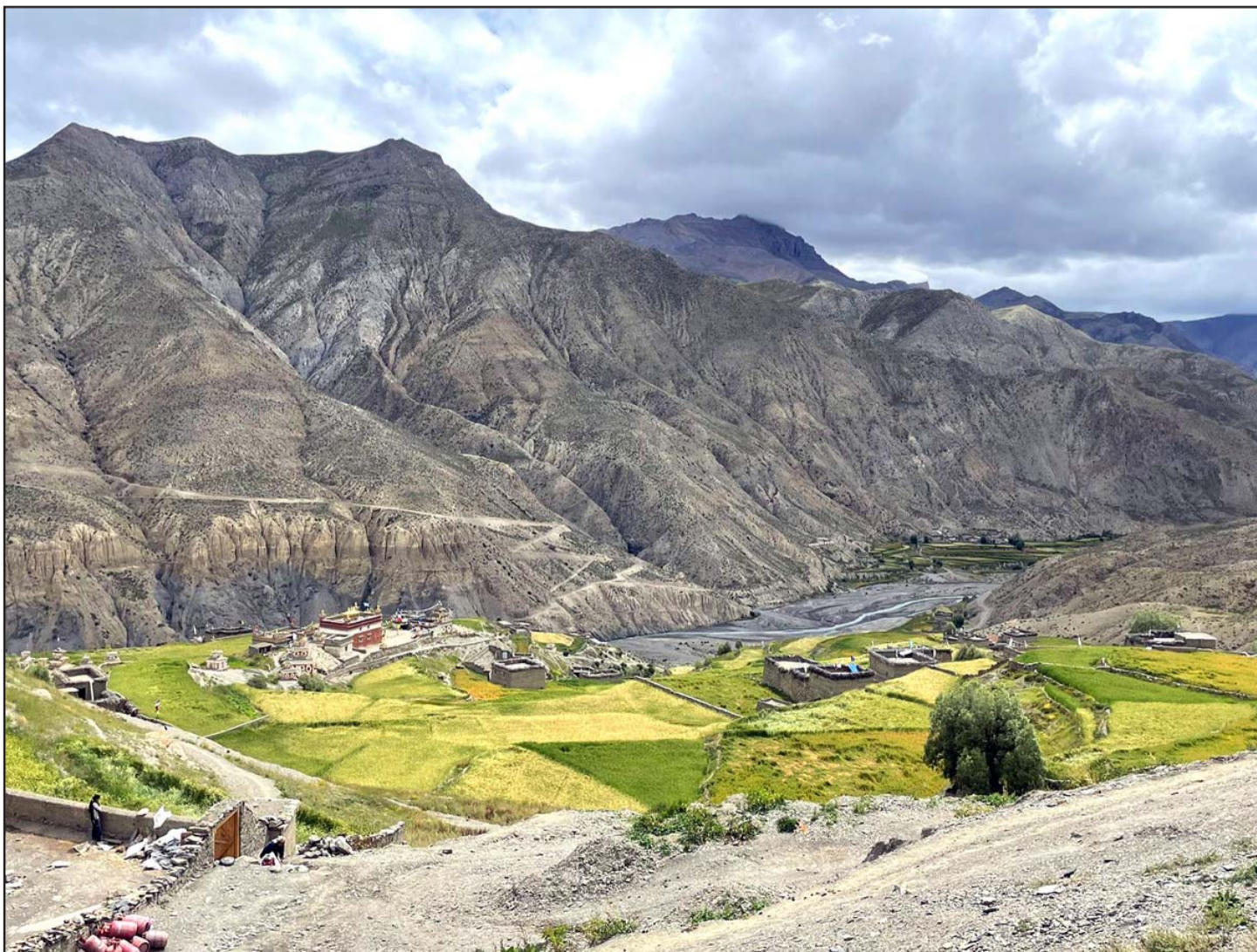
उपल्लो डोल्पाको शे फोक्सुण्डो गाउँपालिका-३ स्थित साल्लाङ गाउँ।