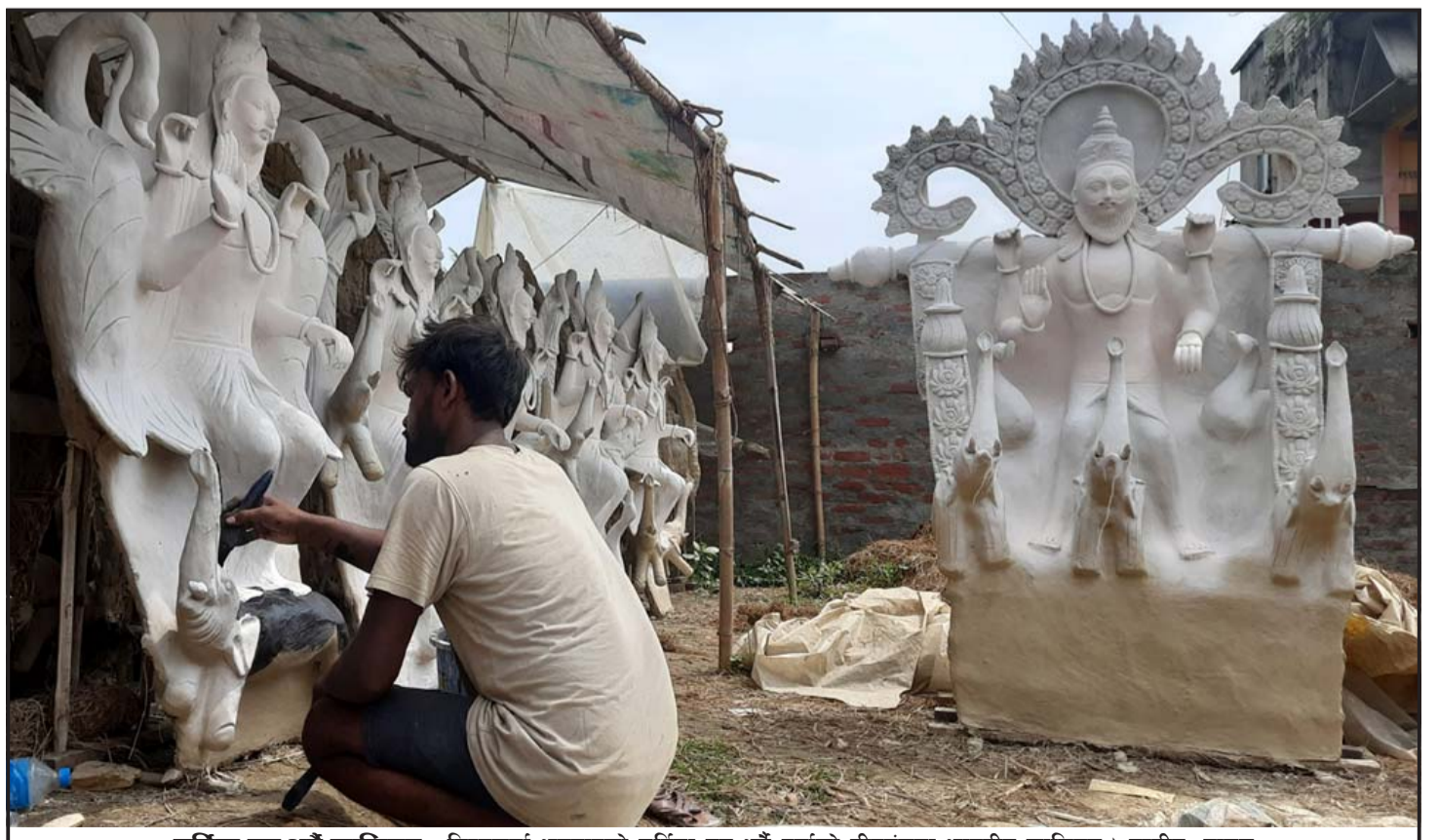
मूर्तिमा रङ्ग भदौ कालिगड : विश्वकर्मा भगवान्को मूर्तिमा रङ्ग भदौ पर्साको वीरगंजमा भारतीय कालिगड।

Aadarsh Nagar, Birgunj, Nepal, www.lordshotels.com,