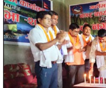
नगरपालिकाको नीति तथा कार्यक्रम

प्रस, गरुडा, २९ साउन/ रौतहटको गढीमाई नगरपालिकाले रु ५३ करोडभन्दा बढीको बजेट ल्याएको