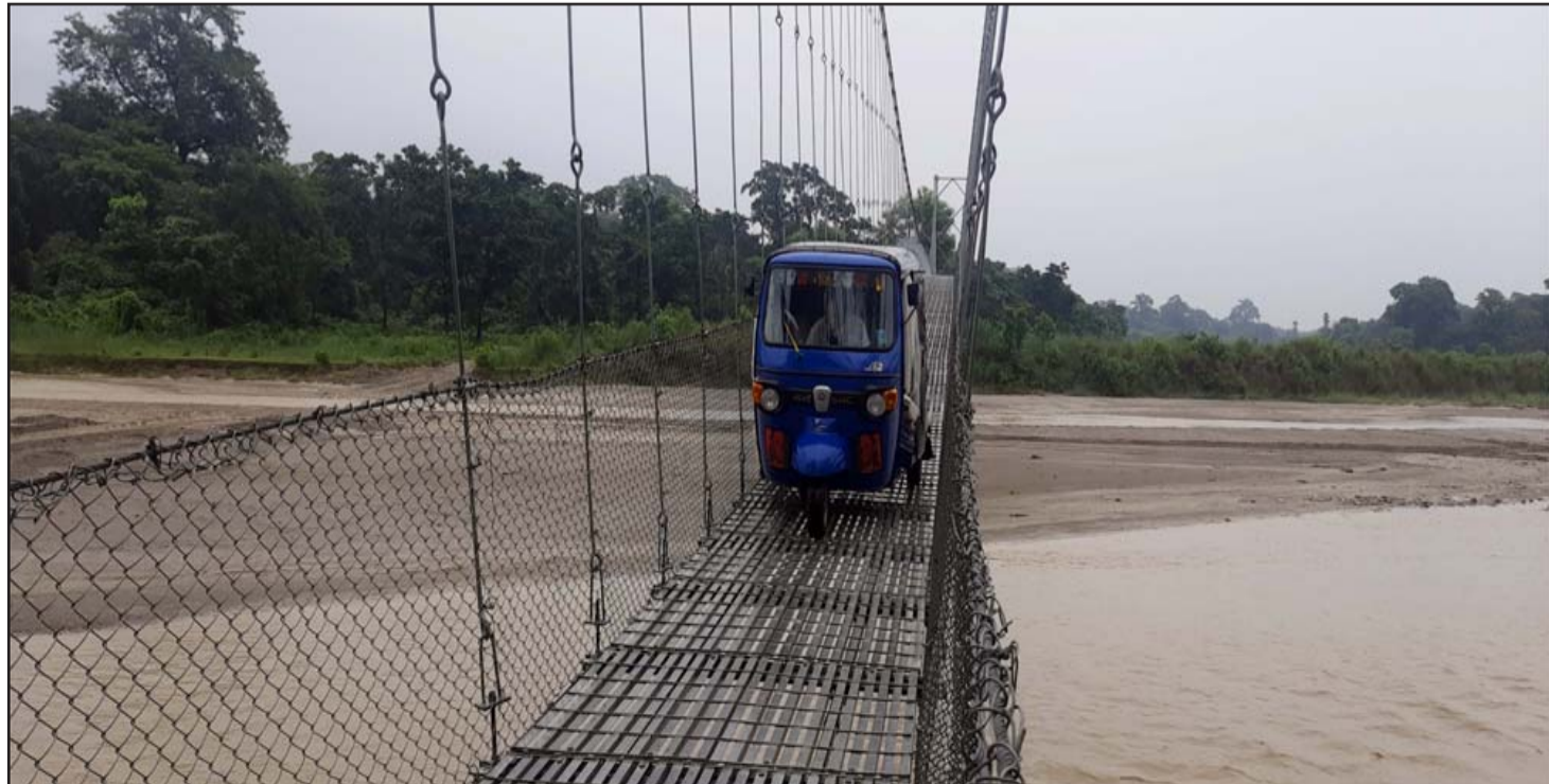
तीन वर्षअघि अटो चल्ने सक्ने झोलुङ्गे पुल बनेपछि लालबस्तीका छ हजारभन्दा बढी र मकवानपुर बकैया गाउँपालिका वडा नं ६ का सयौं घरधुरीका बासिन्दालाई आवतजावतमा जोखिम टरेको छ।

स्थायी चालू पूँजी कर्जालाई आवधिक कर्जा नभई निरन्तर कर्जा नै मान्नुपर्नेलगायतका माग निजी क्षेत्रका छन्। शेयर लगानीकर्ताको मनोबल बढाउन जोखिम भार कम गरी रु १२ करोडको सीमा हटाउनुपर्ने, स्थानीय तहको रकम निक्षेप गणना गर्न पाउने व्यवस्थालाई पुनर्बहाली गर्नुपर्ने, आन्तरिक विप्रेषण कारोबार गर्न पाउनुपर्ने लगायतका माग पनि निजी क्षेत्रका रहेका छन्।