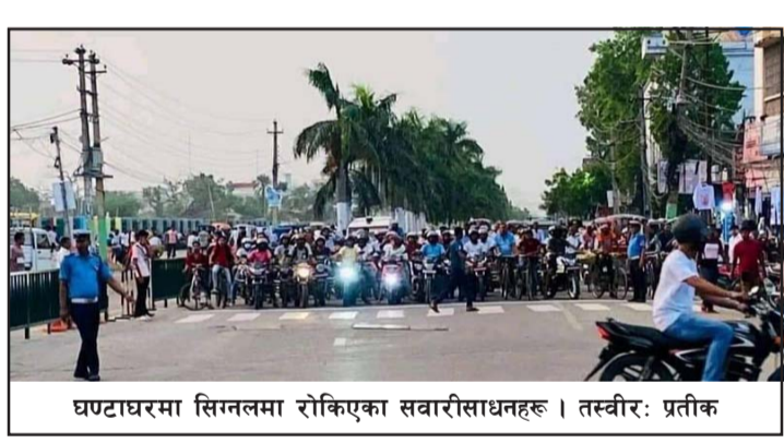
घण्टाघरमा सिग्नलमा रोकिएका सवारीसाधनहरू ।

नष्ट भएका थिए । त्यसपछि अहिले महानगरपालिका भएपछि हालै ट्राफिक सिग्नल लाइट