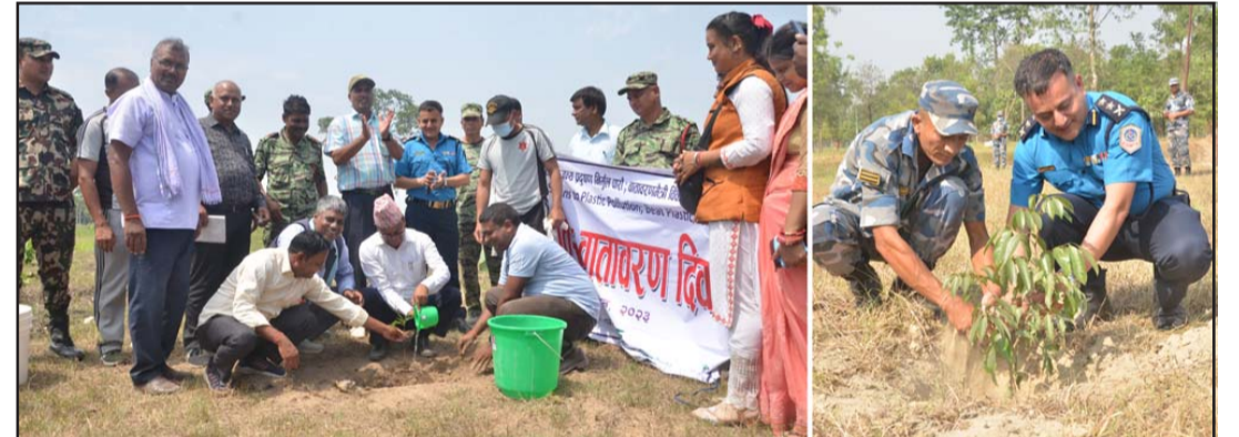
गत आवामा बाराका विभिन्न स्थानमा भएका वृक्षारोपण कार्य।

बाराको जीतपुरसिमरा उपमहानगरपालिका, कोल्हवी नगरपालिका, निजगढ नगरपालिका, करैयामाई गाउँपालिकालागायत अन्य केही स्थानीय तहका भूभाग वन क्षेत्रसम्म