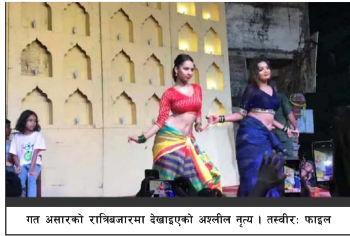
गत असारको रात्रिबजारमा देखाइएको अश्लील नृत्य ।