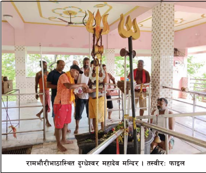
रामभौरीभाठास्थित दुग्धेश्वर महादेव मन्दिर।

अवधिमा आज मितिले अन्तिम सोमवार पर्सा राष्ट्रिय निकुञ्जको चारकोसे