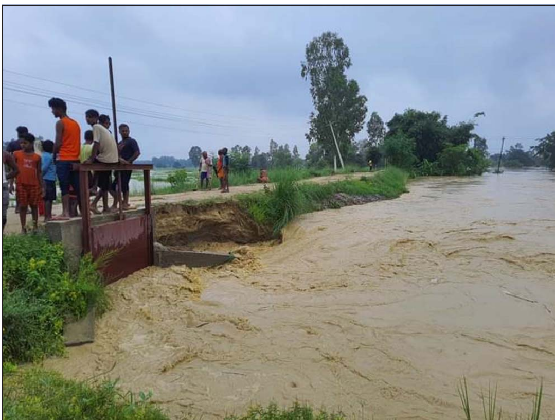
बाढीले सडक भत्काउँदै : महोत्तरी जिल्लाको रातो नदीमा आएको बाढीले बलवा नगरपालिका-१ स्थित नहरको फाँटनजीकै सडक भत्काउँदै ।

अनुसन्धानकर्ताहरूले यसको लम्बाइ लगभग २० मिटर अर्थात् ६५ फिट रहेको अनुमान गरेका छन् । घटनास्थलमा ठूला हड्डीहरू भेटिएका छन्, जसको तौल २०० किलो रहेको बताइएको छ । यीमध्ये चार हड्डी रिब्रका र एउटा ह्वेलको हड्डी हो । यसमा धेरै वर्ष लाग्यो र यी ठूला जीवाश्महरू सङ्कलन गर्न धेरै यात्रा तय गर्नुपर्ने थियो । त्यसपछि पेरु र युरोपका अन्वेषकहरूलाई आफूले पत्ता लगाएको कुरा बुझ्न धेरै वर्ष लाग्यो । -प्रतीक डेस्क (एजेन्सीको सहयोगमा)