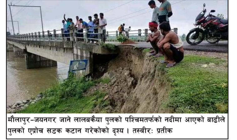
मौलापुर-जयनगर जाने लालबकैया पुलको पश्चिमतर्फको नदीमा आएको बाढीले पुलको एग्रोच सडक कटान गरेकोको दृश्य।

निवेश कर्ण, वीरगंज, २४ साउन/ सर्लाहीको धनकौल गाउँपालिका-४ महिनाथपुरस्थित एकादशी खोला र मानिस अलपत्र परेकोबारे जानकारी हुनासाथ जनपद र सशस्त्र प्रहरी तथा सेनाको टोली पुगेर ९० जनाको उद्धार