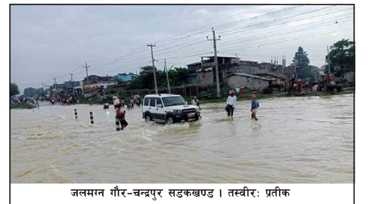
जलमग्न गौर-चन्द्रपुर सडकखण्ड।

विस्थापित भएका छन्। उनीहरू बाढीको प्रकोपबाट जोगिन घर छाडेर सडकमा बस्न बाध्य भएका छन्। नदीहरूमा अलपत्र परेका मानिसहरूको सुरक्षार्मीद्वारा उद्धार अविरोल वर्षाका कारण बागमती, लालबकैया र झाइ नदीमा आएको बाढीले विभिन्न ठाउँमा अलपत्र परेका