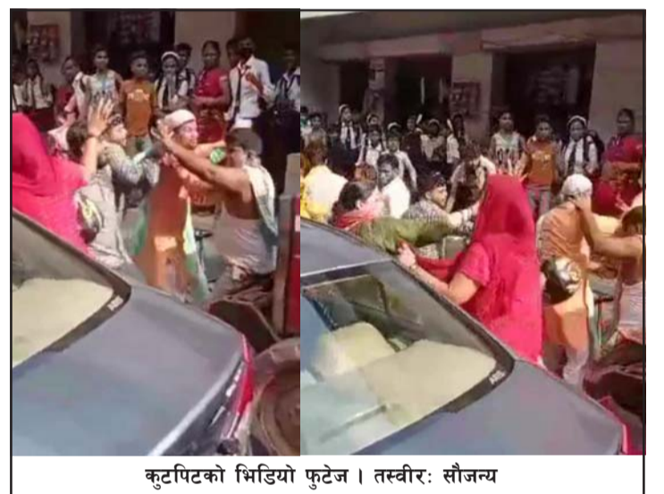
कुटपिटको भिडियो फुटेज।