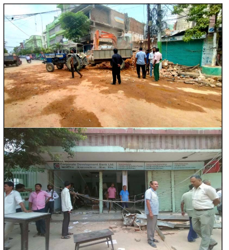
वीरगंज महानगर-१० आदर्शनगरस्थित क्लासिक होटल नालामाथि बनेको भनेर भन्काएको महानगरले भगनावशेष उठाउँदै र कर्पोरेट डेभलपमेन्ट बैंक खाली गरिदै।

हिजो दिउँसोदेखि यो घटनालाई लिएर सो वडामा विवाद सिर्जना गराउन खोजिएको थियो तर ठूलो सङ्ख्यामा प्रहरी परिचालन गरेर स्थानीय जनप्रतिनिधिहरूसमेतले विवादलाई बढ्न दिएका थिएनन्।