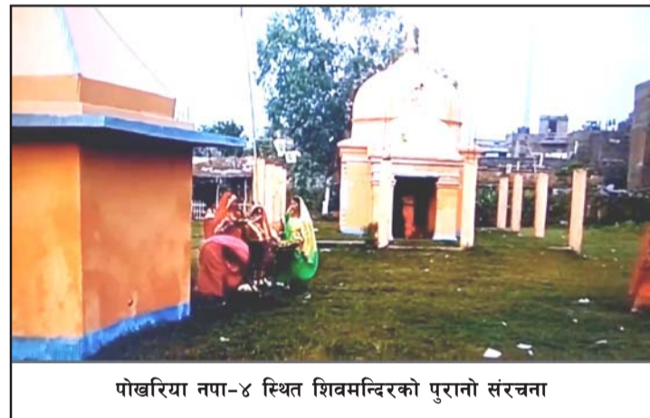
पोखरिया नया-४ स्थित शिवमन्दिरको पुरानो संरचना

संवर्द्धन गर्नु तीनै तहका सरकार तथा नागरिक समाजको परम कर्तव्य हो। श्रद्धालुहरू मठमन्दिरको नाममा जग्गा अर्पण गर्छन्। निष्ठापूर्ण भावले मठमन्दिरको निर्माण गर्छन्। मठमन्दिर तथा शिक्षालयहरूको नाममा सम्पत्ति अर्पण गर्ने मानिसहरूको समाजमा कमी छैन। यद्यपि मानिसहरूकै बीचमा मानिसजस्तै देखिने अमानवहरू पनि छन्, जो मानवको नाममा कलङ्क छन्। एक डम शूद्र तोरीको तेललाई केही बुँद मटीलेले अशुद्ध मात्रा पार्दै, अपितु मानव शरीरको लागि हानिकारक हुन सक्छ। त्यस कारण अमानवीय मनोवृत्तिको छिटा समाजमा किमार्थ पर्नु दिनुहुन्न।