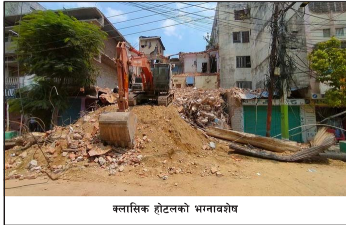
क्लासिक होटलको भग्नावशेष

दिएको थियो तर क्लासिक होटलमा भने बेलुकी साढे सात बजेदेखि डोजर लगाएर संरचना भत्काउने कार्य गरेको थियो।