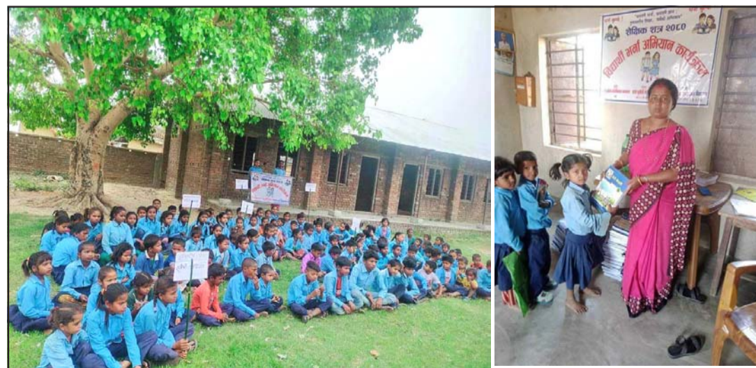
पटेर्वासुगौली गापा-३ स्थित नेपाल राष्ट्रिय आधारभूत विद्यालय महेन्द्रपुर।

प्रस, वीरगंज, ४ साउन/ पटेर्वासुगौली गाउँपालिकाका अधिकांश सामुदायिक विद्यालयमा शिक्षक