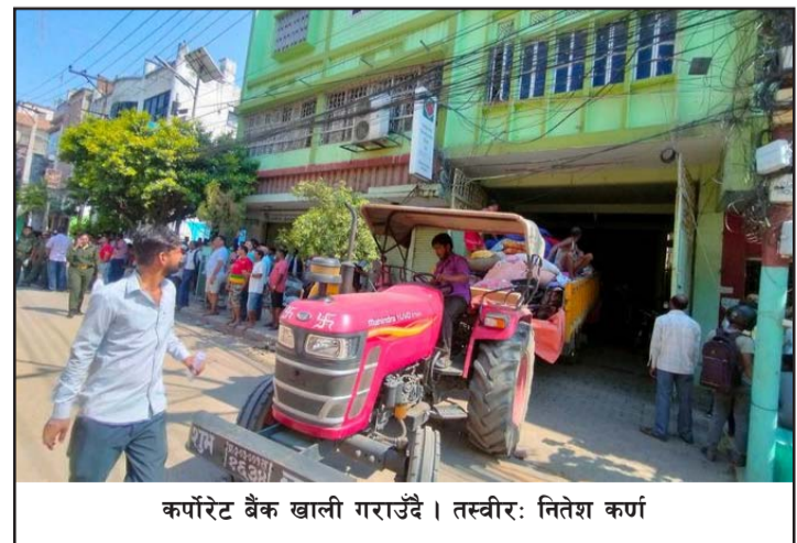
कर्पोरेट बैंक खाली गराउँदै।

२०२६ सालमा नालामाथिको क्षेत्र खरीद गरेको, २०३१ सालमा रजिस्ट्रेशन गरेको र नगरपालिकाबाटै घरनक्शा पास गरेर ५० वर्षदेखि भोग गर्दै आएकोमा अहिले आफैले बिक्री गरेको, नक्शापास गरेको क्षेत्रलाई मुख्य नालामाथि भएको भनेर गैरकानूनी तरीकाले तोडफोड गर्ने चेतावनी दिएको आरोप लगाए। महानगरपालिकाले भने नालामाथि बनेका संरचना सबै भत्काउने र त्यसमा कसैसँग सम्झौता नहुने बताउँदै आएको छ। जिल्ला हुलाक कार्यालयअगाडिदेखि शुरू भएको १० फिट नाला गीता मन्दिरसम्म १० फिटमै केन्द्रित छ भने त्यसपछि वीरगंज जेसीजदेखि हरि खेतान क्याम्पससम्म तत्कालीन पशुपतिनगर निर्माण समितिको नक्शा अनुसार ४० फिटको नाला कायम रहेको छ। हरि खेतानपछि चिल्डेन पार्क हुँदै श्रीसिया नदीसम्म मुख्य नाला १० फिटकै छ। महानगरले अहिलेसम्म वीरगंज जेसीजबाट ४० फिट नाला सफाई अभियान शुरू गरेको र पहिलो चरणमा राष्ट्रिय वाणिज्य बैंक, होटल रेसिडेन्सी र केडिया परिवार तथा हरि खेतान क्याम्पसद्वारा अतिक्रमित नालामाथिको संरचना भत्काएको थियो।