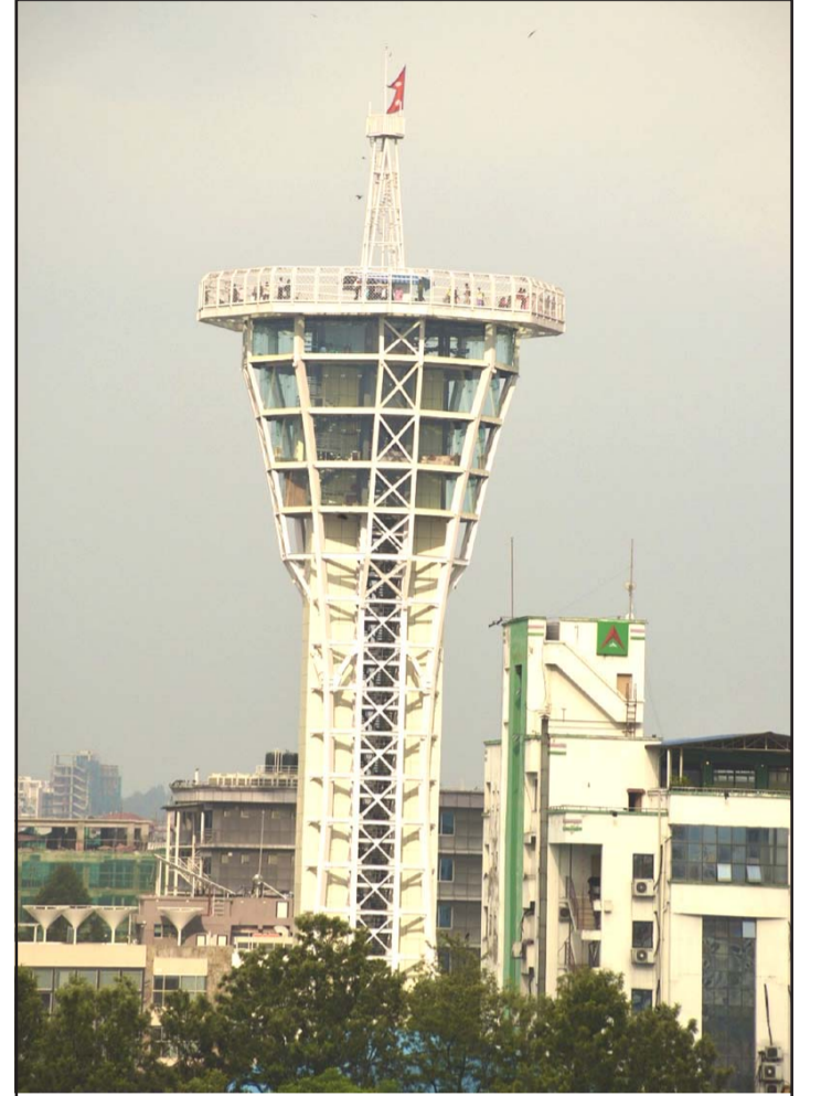
२५ तले स्काई टावर: राजधानीको कमलपोखरीमा अवस्थित २५ तलाको स्काई टावर, जहाँबाट राजधानीको सुन्दर दृश्य हेर्न सकिन्छ।

आयातमा प्रतिबन्धलगायत विभिन्न कारणले अहिले पनि अर्थतन्त्र मन्दीमा छ। आर्थिक गतिविधि सुस्त छ, नयाँ लगानी भएको छैन, रोजगार घटेकोले उपभोक्ताको खरीद क्षमतामा कमी आएको छ। यस्तो पृष्ठभूमिमा राष्ट्र बैंकले ल्याउने नीतिले मौद्रिक औजार परिचालनमाफत ब्याजदर कम गर्दै कर्जा माग बढाउने, वित्तीय स्थायित्व कायम गर्ने र उत्पादनमूलक क्षेत्रमा कर्जा पुग्ने वातावरण सिर्जना गर्नुपर्ने चुनौती रहेको छ। आयात घटेको र रेमिट्यान्स बढेका कारण अर्थतन्त्रका बाह्य सूचकहरू (शोधनान्तर, विदेशी मुद्रा सञ्चित आदि) सबल छन्। विदेशी मुद्रा सञ्चितमा कमी आएकै कारण नेपालको अर्थतन्त्र पनि श्रीलङ्काको जस्तै बन्नु कि भन्ने डर अब छैन। यस्तो अवस्थामा आन्तरिक अर्थतन्त्रलाई चलायमान बनाउन नेपाल राष्ट्र बैंकले तुलनात्मकरूपमा खुकुलो मौद्रिक नीति ल्याउनुपर्ने माग निजी क्षेत्रको छ। विगतमा कसिलो मौद्रिक नीतिका कारण निकै तल ओर्लेको सेयर बजार