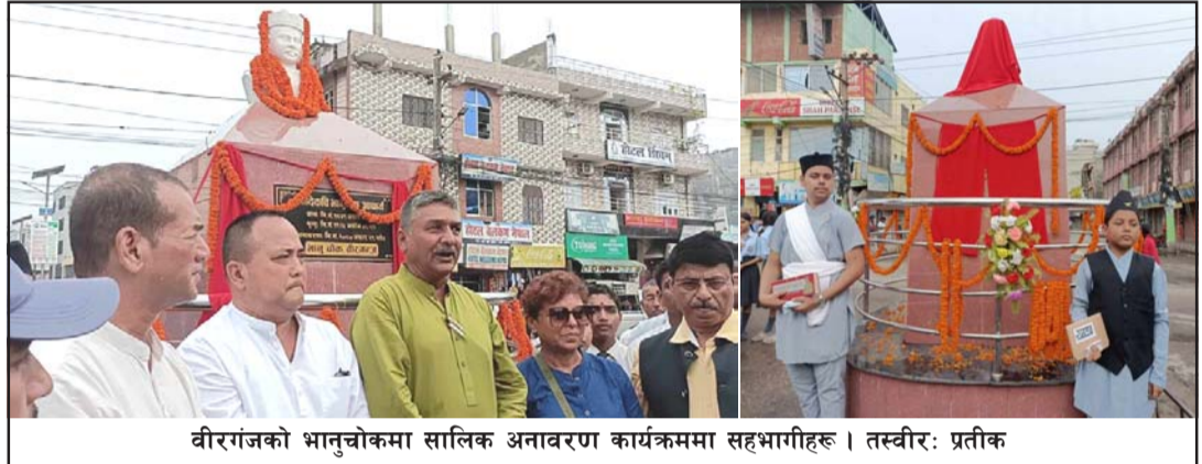
वीरगंजको भानुचोकमा सालिक अनावरण कार्यक्रममा सहभागीहरू।

प्रस, वीरगंज, २९ असार/ वीरगंज-१६ नयाँ बसपार्कस्थित पुगी सम्पन्न भएको थियो। कार्यक्रममा विभिन्न विद्यालयका विद्यार्थीहरूले राजेन्द्रप्रसाद कोइरालाले भानुभक्तबाट प्रेरणा लिएर जीवनलाई सार्थक बनाउन