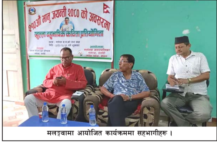
मलङ्गवामा आयोजित कार्यक्रममा सहभागीहरू।

नेपाल मिथिला प्रज्ञा प्रतिष्ठान मलङ्गवा, सर्लाहीको संयोजन तथा मलङ्गवा (बाँकी अन्तिम पातामा)