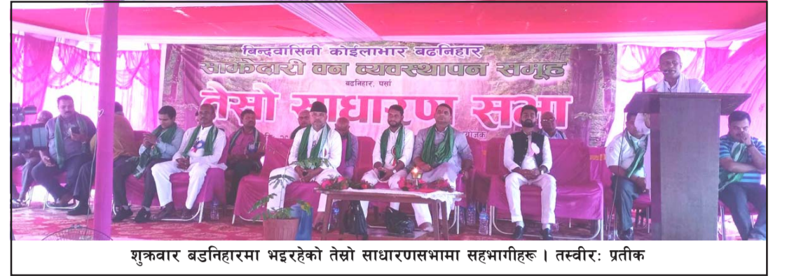
शुक्रवार बडनिहारमा भइरहेको तेस्रो साधारणसभामा सहभागीहरू।

बडनिहार साभेदारी वन व्यवस्थापन समूहको शुक्रवारदेखि शुरू भएको निर्वाचन प्रक्रियामा अदालतले रोक लगाएको छ।