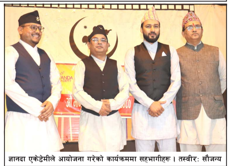
जानदा एकेडेमीले आयोजना गरेको कार्यक्रममा सहभागीहरू।

त्यसै अवसरमा नारायणी वाङ्मय प्रतिष्ठान र लक्ष्मी साहित्य समाजले संयुक्तरूपमा आयोजना गरेको प्रभातफेरी, कविता वाचन र पुरस्कार वितरण कार्यक्रम सम्पन्न गरेको थियो।