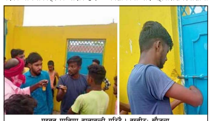
महुवन माविमा तालाबन्दी गरिँदै।

आरोप-प्रत्यारोप गरेर दिन बिताउने गरेको अभिभावकहरूको आरोप छ।