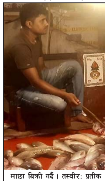
माछा बिक्री गर्दै।