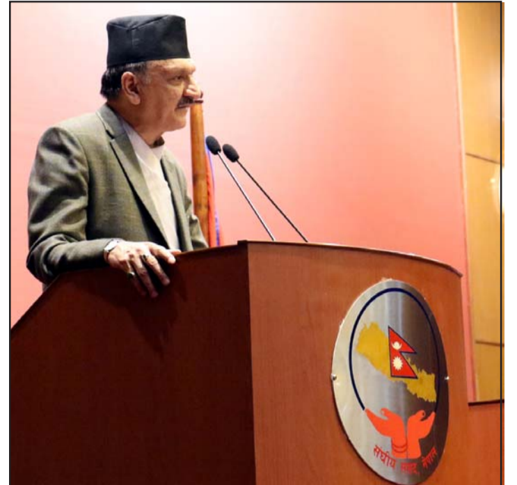
अर्थमन्त्री डा प्रकाशशरण महत।

लागि आवश्यक रकम जोहो गर्न तथा अत्यावश्यक कामका लागि खर्च गर्नका