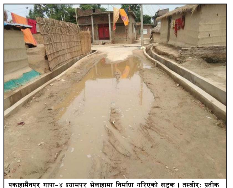
पकाहामैनपुर गापा-४ श्यामपुर भेलाहामा निर्माण गरिएको सडक।

प्रस, परवानीपुर, २८ असार/ पसा, पकाहामैनपुर गाउँपालिका-४ जम्ने गरेको छ। जसले गर्दा १० फिट चौडा सडक भएर आउजाउ गर्न