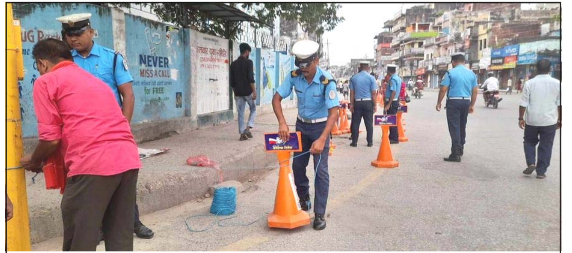
वीरगंजको घण्टाघरमा ट्राफिक चिह्न राख्दै।

प्रस, परवानीपुर, २८ असार/ आगामी आठ साउन १ गतेदेखि मधेश प्रदेशमा ट्राफिक प्रहरीले गर्ने कारबाई तथा जरिवानालाई टिभिआरएस (ट्राफिक भायलेशन रेकर्ड सिस्टम) अन्तर्गत कार्य सञ्चालन गर्ने भएको छ। मधेश प्रदेशका आठ जिल्लामध्ये पसा, महोत्तरी र सिराहा गरी तीनवटा जिल्लामा प्रारम्भिक चरणमा यो विधिबाट कारबाई तथा जरिवाना कार्य शुरू गर्ने ट्राफिक प्रहरी कार्यालयको तयारी छ। कुनै पनि नेपाली सवारी चालक वा सवारीधनीले सवारी नियम उल्लङ्घन गरेको खण्डमा निजको कागजपत्र ट्राफिक प्रहरीद्वारा २४ घण्टे पुर्जी जारी गरी नजीकको प्रहरी कार्यालयमा पठाइनेछ। तत्पश्चात् उक्त कागजातको इन्ट्री टिभिआरएसमा गरिने जिल्ला ट्राफिक प्रहरी कार्यालय, पसाले जनाएको छ। उक्त कागज लिन सवारीचालक वा धनीले जरिवाना रकम राष्ट्रिय वाणिज्य बैंकमा