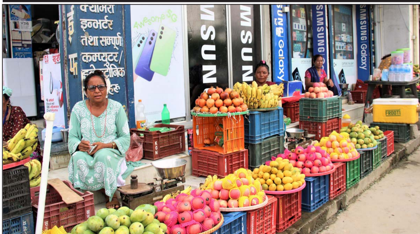
फूटपाथबाट हटाइएपछि सटरको पेटिमा फलफूल बेच्दै : बाँकेको कोहलपुर नगरपालिकाद्वारा फूटपाथबाट हटाइएका केही फलफूल व्यापारी सटरपेटिमा फलफूल बेच्दै।

माथि नाम लेखान चाहने चिकित्सकहरूले यस दैनिकको वार्षिक ग्राहक हुन जानकारी गराइन्। सम्पर्क: बजार व्यवस्थापक जीतेन्द्र पटेल मोबाइल नं. ९८४५०८७५८, ९८०२७७७५३