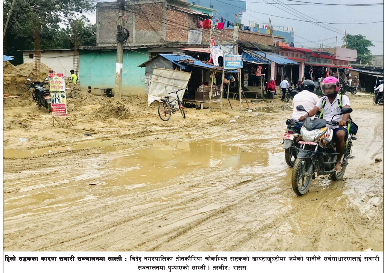
हिलो सडकका कारण सवारी सञ्चालनमा सास्ती : विदेह नगरपालिका तीनकौरिया चोकस्थित सडकको खाल्डाखुल्डीमा जमेको पानीले सर्वसाधारणलाई सवारी सञ्चालनमा पुऱ्याएको सास्ती।