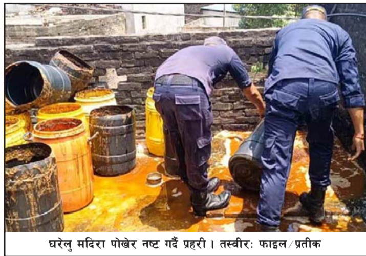
घरेलु मदिरा पोखेर नष्ट गर्दै प्रहरी ।

उत्पादन तथा बजारीकरण गर्ने प्रदेश सरकार र स्थानीय तहको घोषणा कार्यान्वयनका लागि सङ्घीय कानून संशोधन गर्नुपर्ने या नयाँ बनाउनुपर्ने आवश्यकता औल्याए । "प्रदेश सरकार र स्थानीय तहले चाहेर मात्र हुँदैन जस्तो लाग्छ, सङ्घीय मदिरा ऐनले नै घरेलु मदिरालाई गैरकानूनी भनेकोले पहिले कानूनी प्रबन्ध मिलाउनुपर्ने देखिन्छ"-उनले भने ।