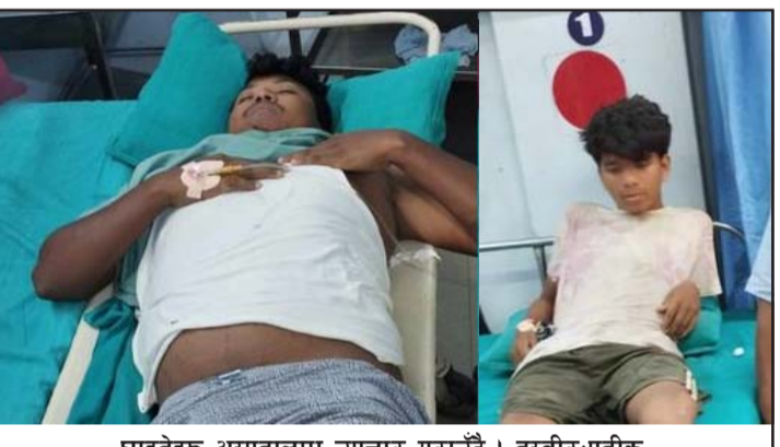
घाइतेहरू अस्पतालमा उपचार गराउँदै ।