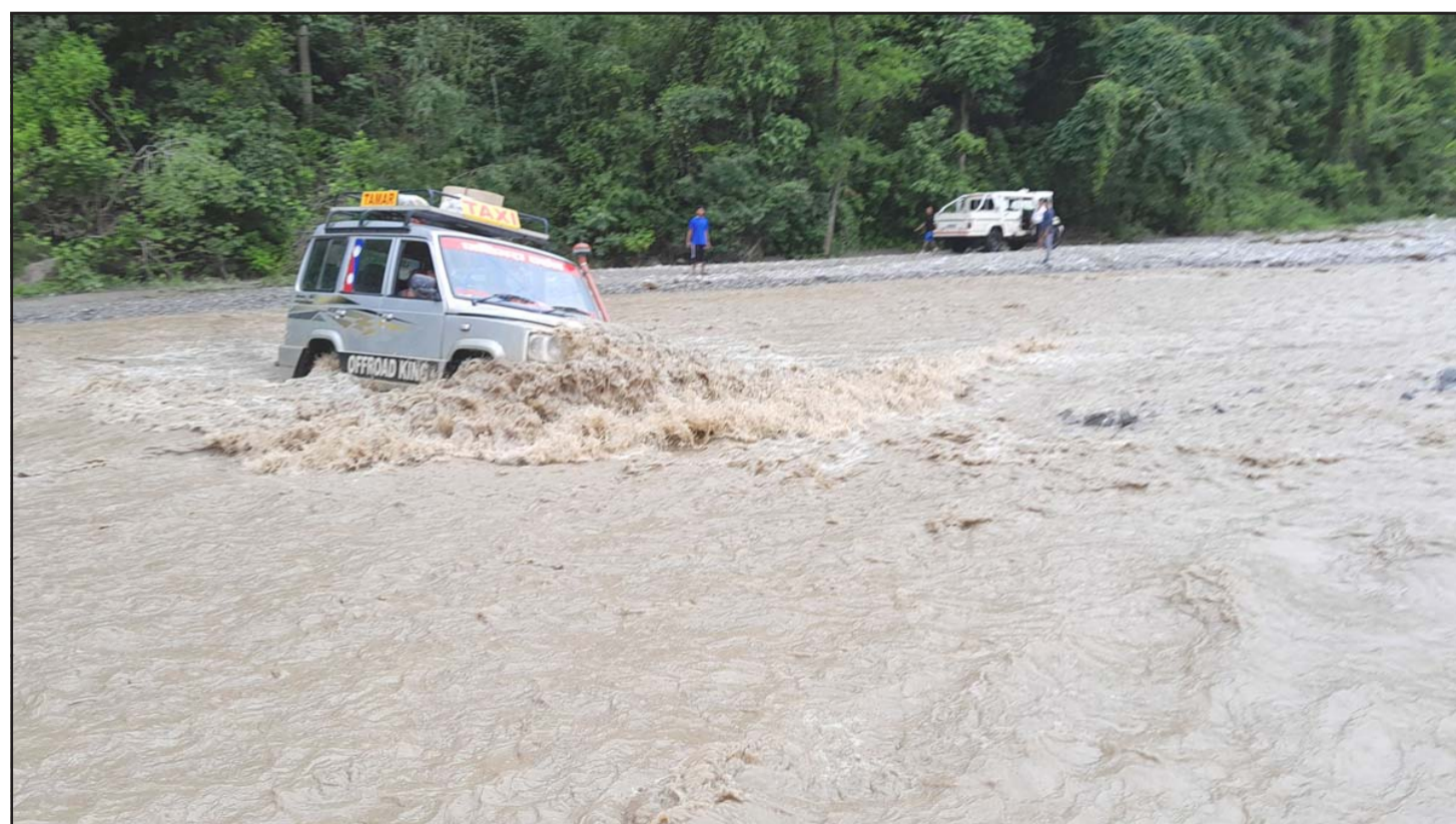
जोखिमका साथ खोला तराउँदै गाडी: तमोर कोरिडोर सडक अन्तर्गत पाँचथार र धनकुटाको सीमा हुँदै बग्ने नावा खोलामा बाढी आएसँगै जोखिमका साथ गाडी खोला तराउँदै चालक ।