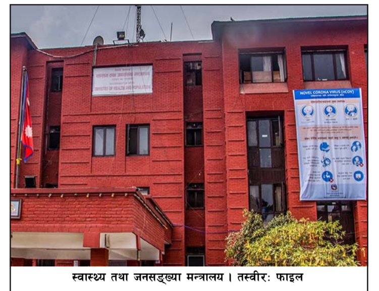
स्वास्थ्य तथा जनसङ्ख्या मन्त्रालय।

मृत्यु हुन्छन् भन्ने तथ्याङ्क छैन।" क्यान्सर रोग विशेषज्ञ डा शाहीका अनुसार वर्षमा