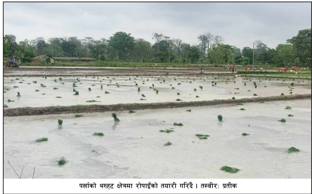
पसाँको थरुहट क्षेत्रमा रोपाइँको तयारी गरिदै ।