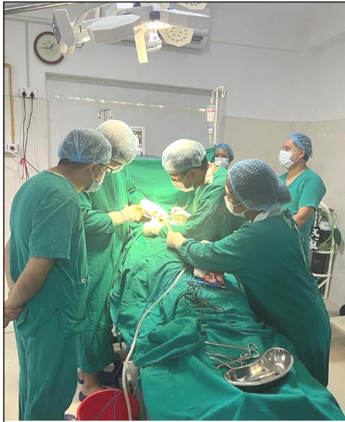
तनहुँको शुक्लागण्डकी नगरपालिका-५ बेलचौतारास्थित जिपी कोइराला श्वासप्रश्वास उपचार केन्द्रमा शल्यक्रिया सेवा दिँदै चिकित्सक ।