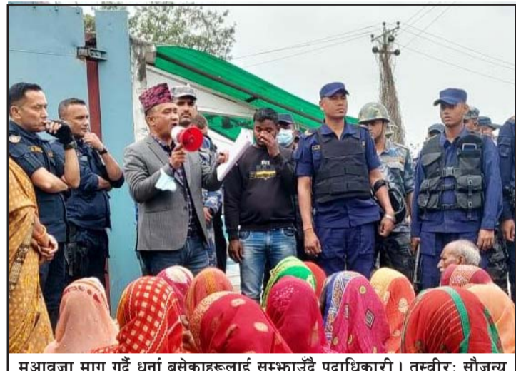
मुआवजा माग गर्दै धर्ना बसेकाहरूलाई सम्झाउँदै पदाधिकारी ।

प्रस, वीरगंज, १९ असार/ वीरगंज महानगर-२५ श्रीसियावासीका