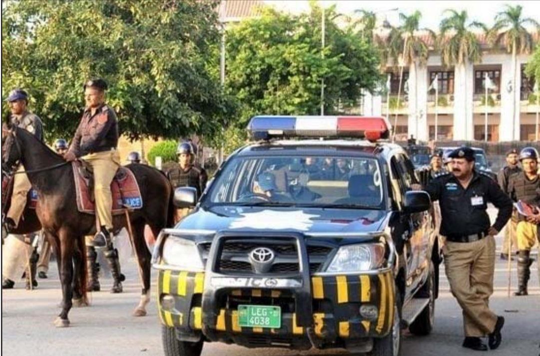
सुरक्षाका लागि पाकिस्तानको पंजाब प्रान्तमा तैनाथ प्रहरी।

पाकिस्तान, १९ असार/एएनआई पाकिस्तानमा नक्कली प्रहरी