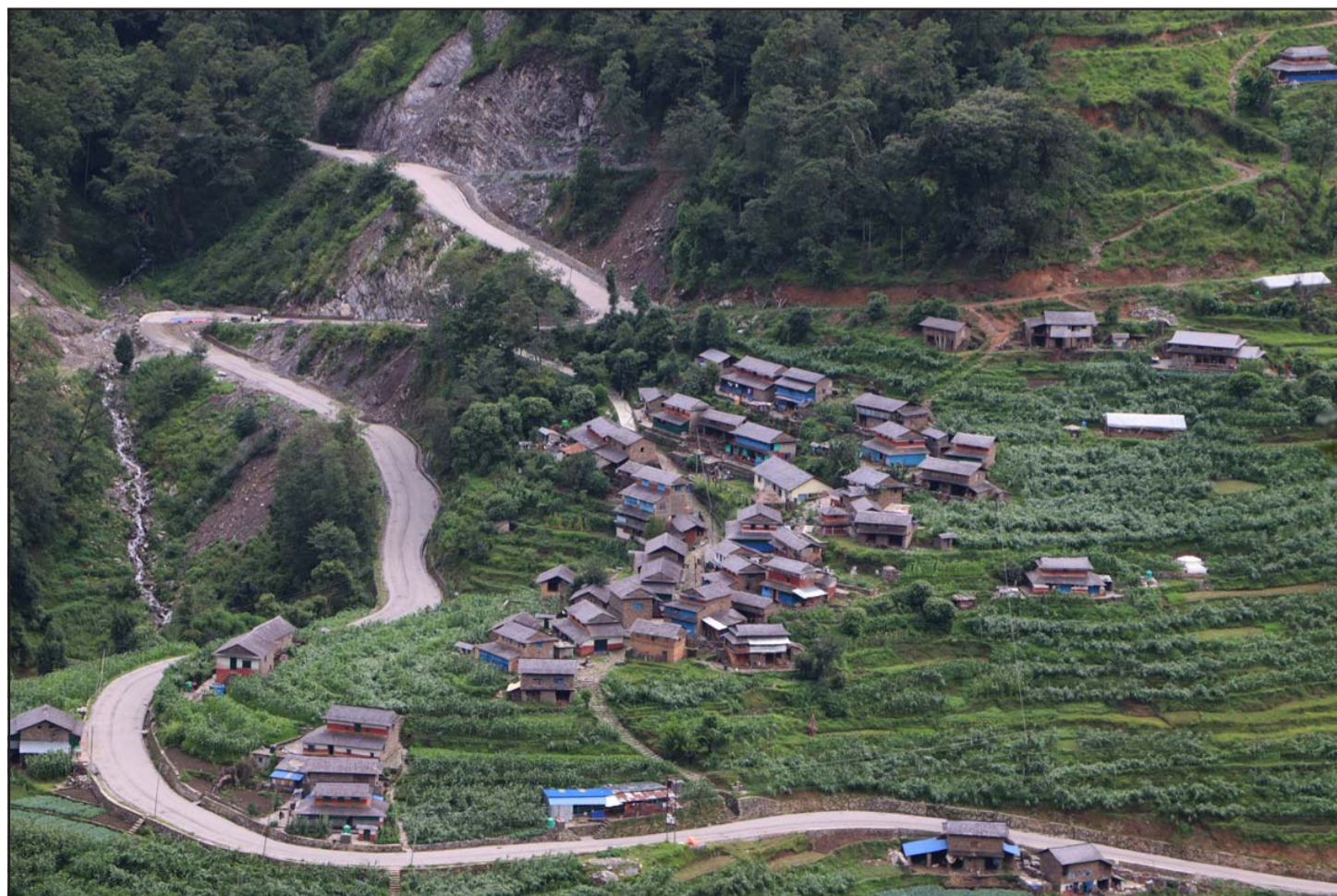
माझखर्क गाउँ: बागलुङको ताराखोला गाउँपालिका-१ स्थित माझखर्क गाउँ । जिल्लाकै विकट मानिने यो गाउँ सडक सञ्जालले जोडिएपछि अहिले सुगम बन्दै गएको छ ।