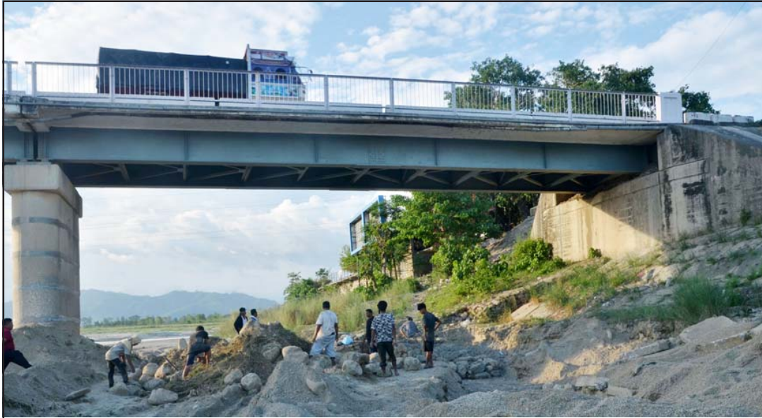
निजगढ नपास्थित बकैयापुल संरक्षणका लागि तारजाली लगाउँदै सडक डिभिजन कार्यालय हेटौंडा।

तारजालीमा ढुङ्गा भर्न करीब ८ लाख ५० हजार रकम आन्तरिक स्रोतबाट जोहो