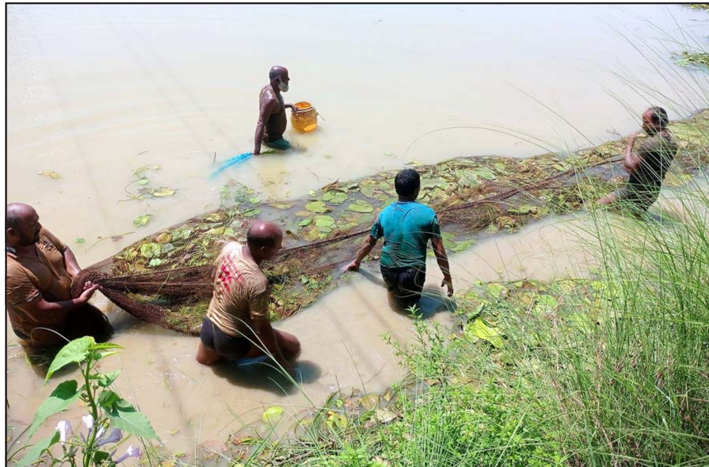
माछापालनबाट राम्रो आम्दानी : सुनसरीको इनरुवा-४ स्थित पोखरीमा माछा मार्दै किसान । यहाँका किसानले माछापालनबाट मनःजे आम्दानी गर्ने गरेका छन् ।

देशी भरका सदस्य, समर्थक तथा शुभेच्छुकमा पार्टीको हार्दिक अनुरोध छ। रास्वपाले अति राजनीतिकरण र दलतन्त्रले जर्जर भएको अवस्थामा पुनः पुरानै ढाँचाका त्यस्ता गतिविधि नगरी सार्वजनिक सम्पत्तिको संरक्षण तथा प्रवर्द्धनमा स्थानीय निकायको कार्यमा रचनात्मक सहयोग गर्न सम्बन्धित सबैमा अनुरोधसमेत गरेको छ।