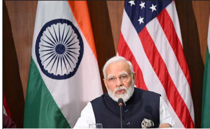
भर्जिनिया राज्यको अलेक्जेंड्रियास्थित नेशनल साइन्स फाउन्डेसनको निरीक्षणको क्रममा बोल्दै भारतीय प्रम नरेन्द्र मोदी।

भारत-अमेरिका शिक्षक आदानप्रदान कार्यक्रमको प्रस्ताव गर्दै प्रधानमन्त्री मोदीले भने-“हामी भारत-अमेरिका शिक्षक आदानप्रदान कार्यक्रम शुरु गर्ने बारे सोच्न सक्छौं। वैज्ञानिकको संलग्नता बढाउन यो अत्यन्तै सान्दर्भिक छ।” रासस