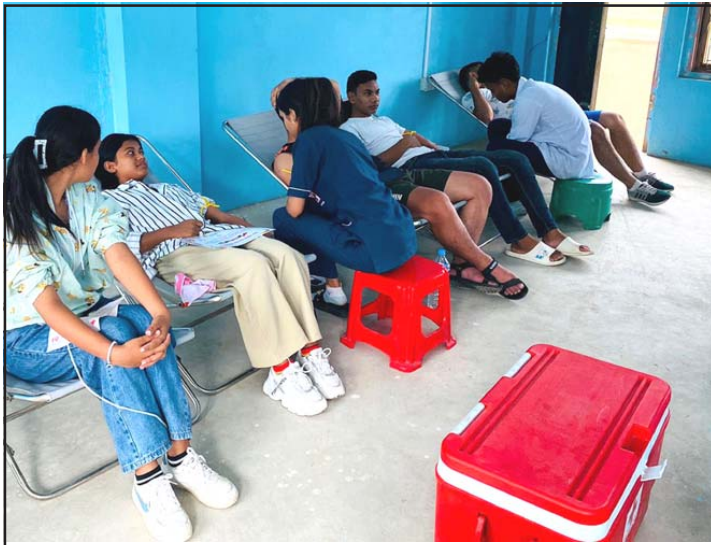
रक्तदान गर्दै रक्तदाता : विश्व रक्तदाता दिवसका अवसरमा ब्लड डोनर्स सोसाइटी नेपाल चितवनले बुधवार आयोजना गरेको रक्तदान कार्यक्रममा रक्तदान गर्दै युवायुवती।

पनि रक्तदाताहरूको दानबाट नै बिरामीले रगत पाइरहेका छन् र जीवन बचाइरहेका