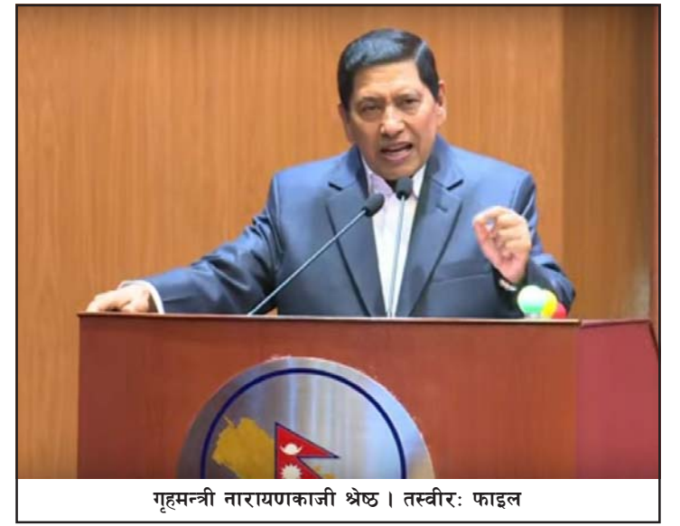
गृहमन्त्री नारायणकाजी श्रेष्ठ।

व्यवहार नगरिने स्पष्ट पारे। सदस्यहरूको एक प्रश्नको जवाफमा गृहमन्त्री श्रेष्ठले