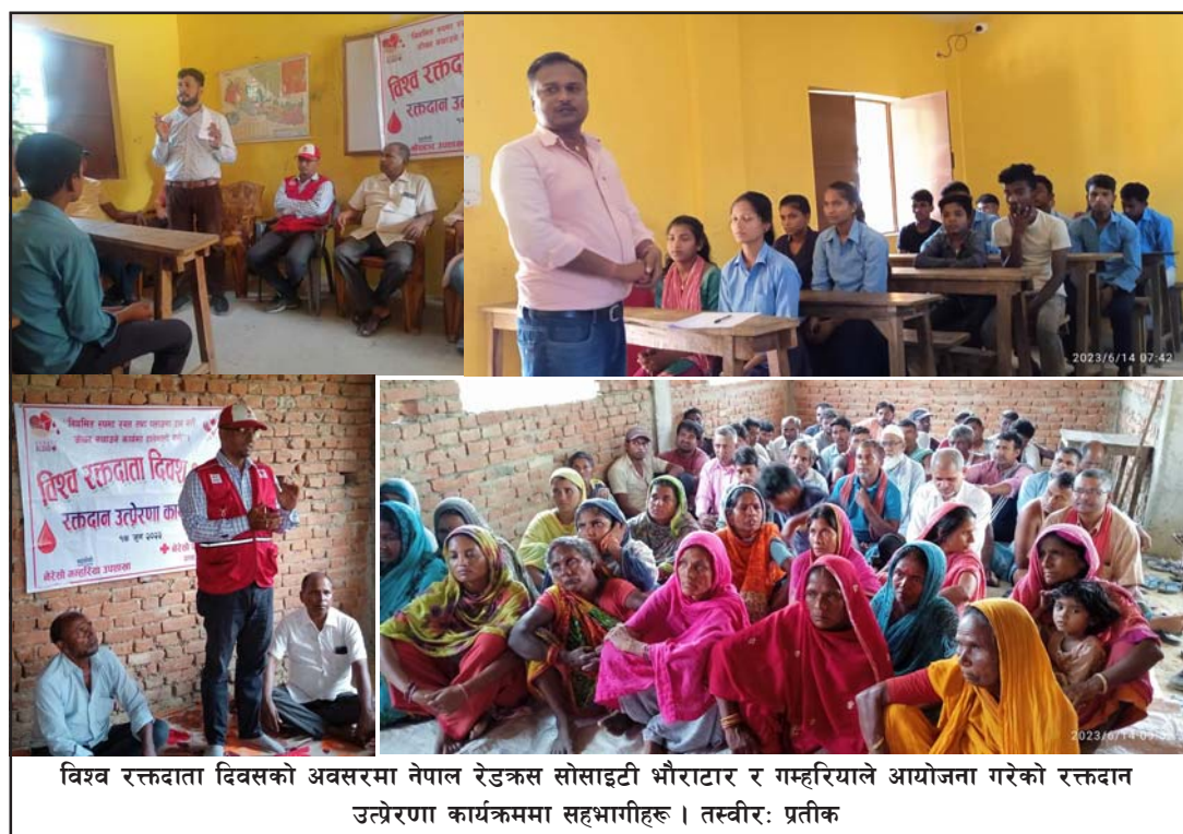
विश्व रक्तदाता दिवसको अवसरमा नेपाल रेडक्रस सोसाइटी भौराटार र गम्हरियाले आयोजना गरेको रक्तदान उत्सव कार्यक्रममा सहभागीहरू।