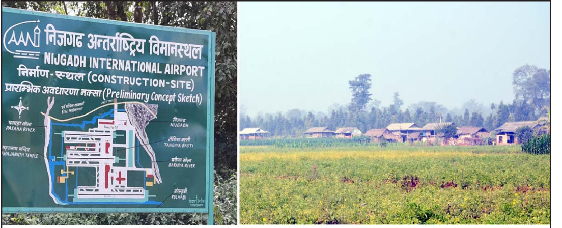
निजगढ विमानस्थल निर्माण गरिने क्षेत्रको बीच भागमा पर्ने टाँगियाबस्ती।

वनजङ्ग कमभन्दा कम नोक्सान हुनेगरी विमानस्थल बनाउन सकिने सुझाव दिएको