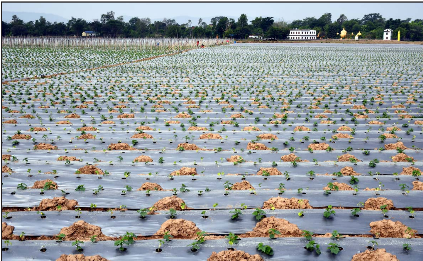
भाइको जग्गामा तरकारीखेती: घोराही उपमहानगरपालिका-१६ तेरोटेस्थित स्थानीयवासीको जग्गा भाइमा लिपर व्यावसायिकरूपमा गरिएको काँक्राखेती। उत्पादन राख्ने भएपछि जिल्लाबाहिरका व्यापारीहरूले घोराहीका विभिन्न स्थानमा जग्गा भाइमा लिपर तरकारीखेती गर्दै आएका छन्।

लागि गरिने लगानीले नेपालले अपनाएको सघाउ पुऱ्याउनेछ भन्ने अपेक्षा छ," उनले ग्रिड अवधारणा कार्यान्वयनमा पनि भने।