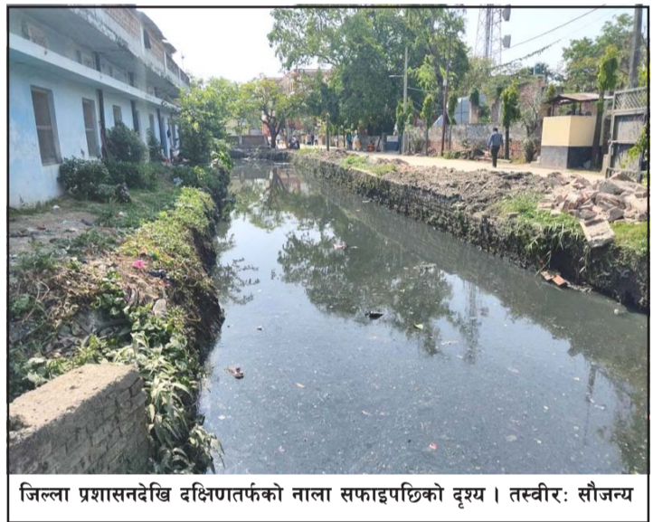
जिल्ला प्रशासनदेखि दक्षिणतर्फको नाला सफाइपछिको दृश्य।

कार्यालयको दक्षिणतर्फको नाला पनि बनेको थियो। १० फुटे नाला निर्माण भएपनि सरसफाइको समस्याले गर्दा