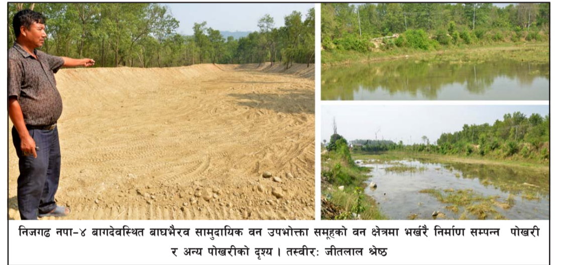
निजगढ नपा-४ बागदेवस्थित बाघभैरव सामुदायिक वन उपभोक्ता समूहको वन क्षेत्रमा भर्खरै निर्माण सम्पन्न पोखरी र अन्य पोखरीको दृश्य ।

हामीले आँट, साहस गरेका थियौं । त्यस बेला गरेको दुःख, मेहनत अहिले घना र हरियाली वनको रूपमा देखा भुल्छौं । अहिले निकै खुशी लाग्छ," तत्कालीन वन समूहका अध्यक्ष लामिछाने भने ।