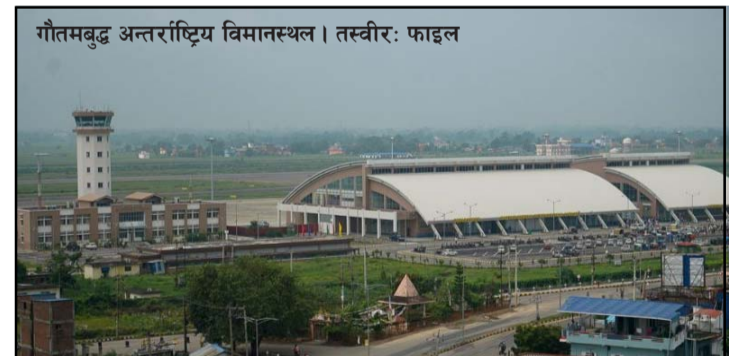
गौतमबुद्ध अन्तर्राष्ट्रिय विमानस्थल। तस्वीर: फाइल

भारत सरकारसँग छलफल गर्न प्रदेश सरकारले भूमिका निर्वाह गर्नुपर्ने उनीहरूको भनाइ छ। चेम्बर अफ कमर्स,