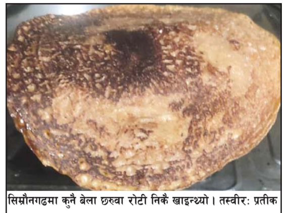
सिम्रौनगढमा कुनै बेला छरुवा रोटी निकै खाइन्थ्यो।

लोपोन्मुख हुँदै गएका यी परिकार कुनै बेला मधेसी संस्कृतिको आधार र पहिचान थियो। आधुनिक र पश्चिमी परिकारको कारण रैथाने खानेकुराप्रति स्थानीयको रुचि कम भएको बढापाकाहरूले बताएका छन्।