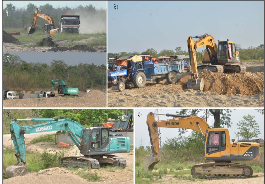
तस्वीर १, २, ३) कोल्हवी नपाको बकैया खोलामा बुधवार दिउँसो उत्खनन गरिएकोतीनवटा एक्साभेटर। ४, ५, प्रहरीले सोही दिन साँझ नियन्त्रणमा लिएको तीनवटामध्ये एउटा खोला बगरमा रहेको एक्साभेटर।