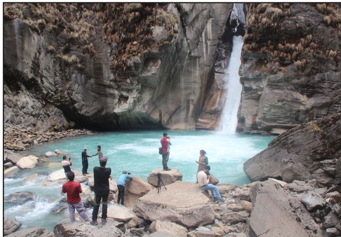
फुत्फुत्ते झरनामा पर्यटक: म्याग्दीको अन्नपूर्ण गाउँपालिका-४ नारस्याङमा अवस्थित नर्थ अन्नपूर्ण हिमालको आधार शिविर जाने पदमार्गमा पर्ने फुत्फुत्ते झरनामा पुगेका आन्तरिक पर्यटक। पहाडभित्रबाट निस्कने यो झरना पर्यटकहरूका लागि आकर्षण बनेको छ।

यसैगरी उमेर पुगेर (२० वर्ष नघाएर) छोरीको विवाह गर्ने अभिभावकलाई सामाजिक सम्मान गर्ने कार्यक्रम राखिएको शाखाप्रमुख दासले